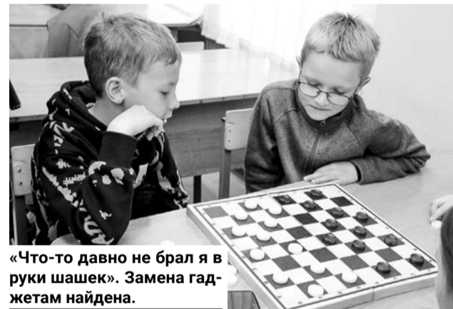
«Что-то давно не брал я в руки шашек». Замена гаджетам найдена.

Питание в пришкольных лагерях тоже очень разнообразно. Некоторые блюда участни-