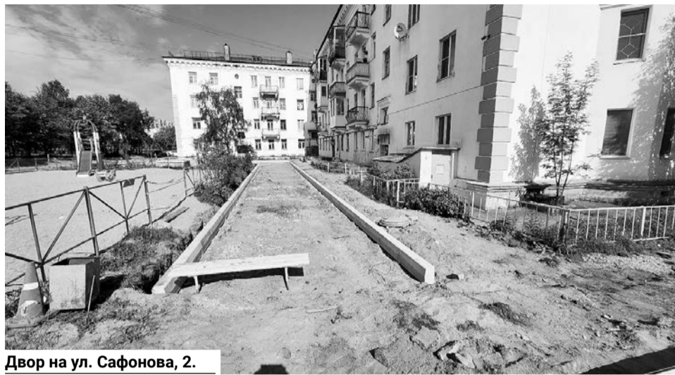
Двор на ул. Сафонова, 2.

Все работы по ремонту дворовых территорий должны завершиться в летний период. Их ход — на постоянном контроле администрации.