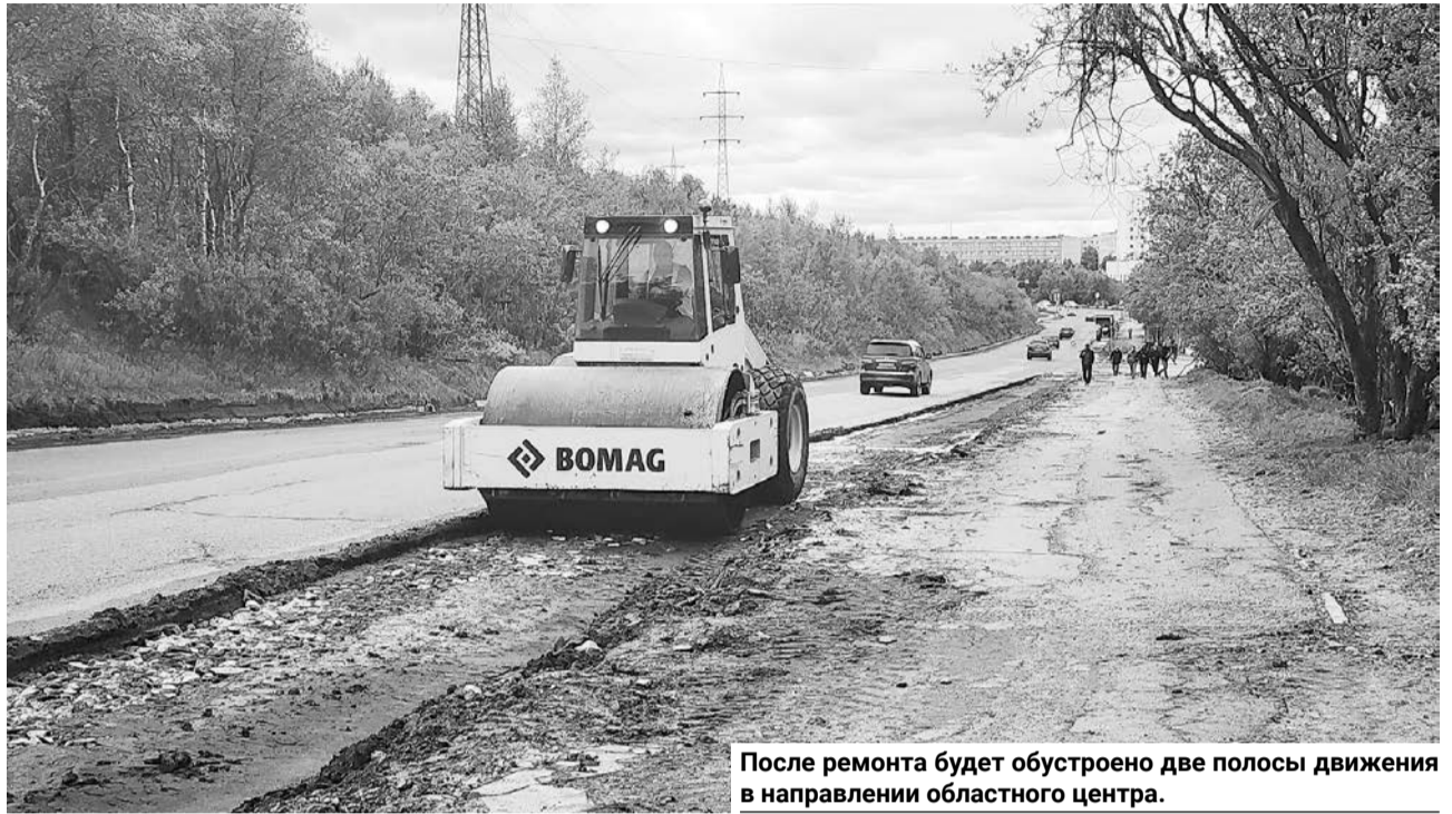
После ремонта будет обустроено две полосы движения в направлении областного центра.

альтернативные технические решения. Кроме того, необходимо максимально учитывать пожелания жителей. Одно из них поступило прямо во время объезда.