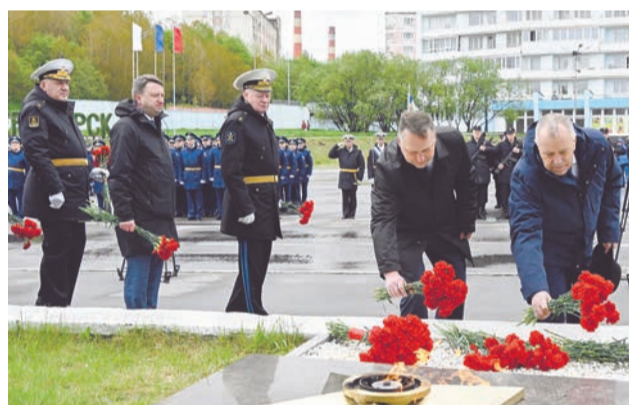
Участники митинга возложили цветы в память о погибших воинах-североморцах.