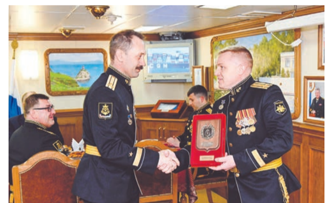
Торжественная церемония награждения на борту фрегата «Адмирал Касатонов».