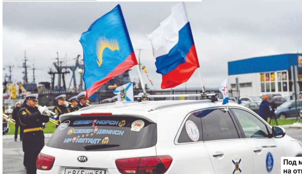
Под марш военного оркестра колонна отправляется в путь.