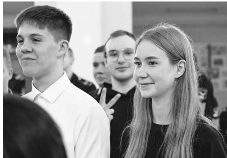
ЕГЭ - важный и ответственный этап в жизни выпускников, школьники встречают его с улыбкой.

Напомним, «базу» достаточно сдать ребятам, которые хотя бы просто получить аттестат или поступают в вузы, где не требуются результаты по математике. Обычно это гуманитарные направления, творческие специальности и так далее. «Профиль» нужен выпускникам,