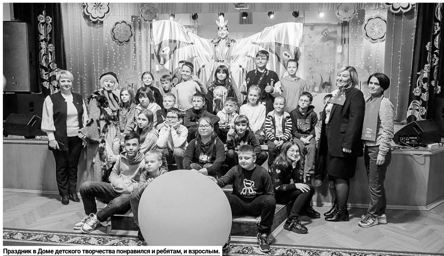
Праздник в Доме детского творчества понравился и ребятам, и взрослым.

В первый день лета во флотской столице началась оздоровительная кампания для юных североморцев, посещающих пришкольные лагеря.