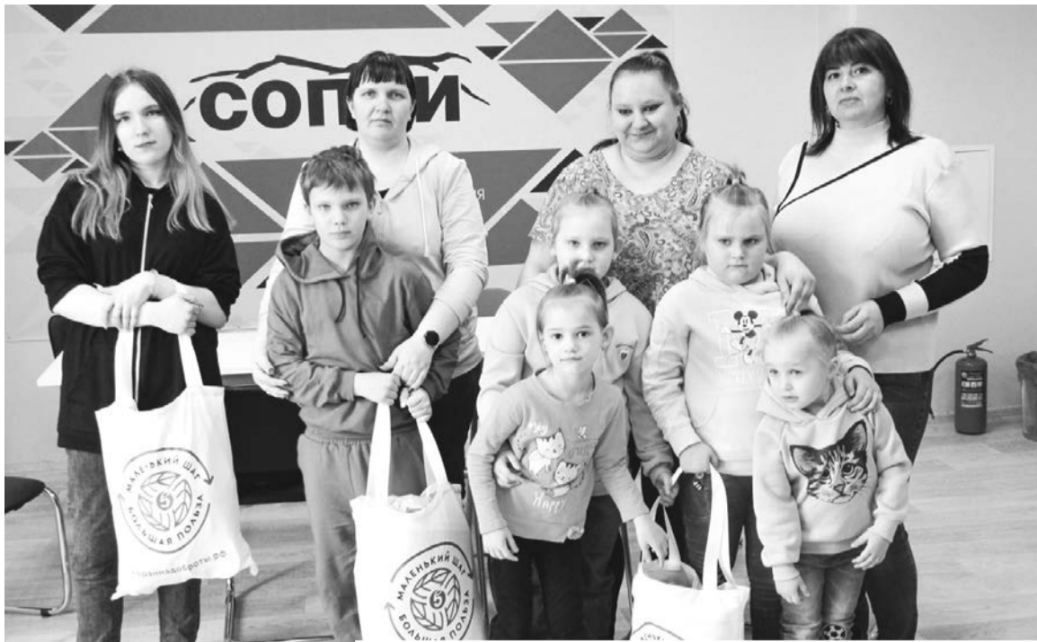
Помощь, собранную волонтерами, получили первые многодетные семьи.

— Это мастер-класс для детей от пяти лет. Пряники у нас ирландские, пекутся по особой тех-