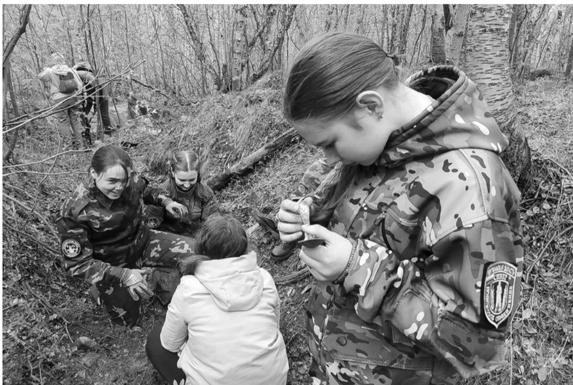
Вооружившись поисковыми приборами, ребята увлеченно исследовали местность и часто находили интересные предметы под слоем грунта.

шли, начали раскопки. Через год возникла идея привести сюда детей, главным образом членов поисковых отрядов. Так возникла молодежно-патриотическая экспедиция «Школа юного поисковика». Мы учим ребят работать с металлоискателем, пинпоинтерами, щупами, показываем, как правильно копать. Одним словом, даем базовые принципы ра-