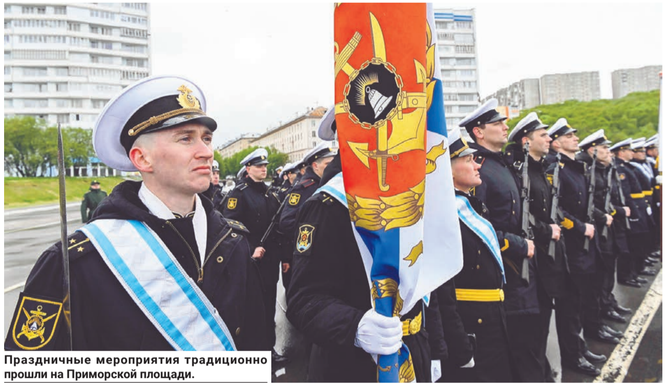
Праздничные мероприятия традиционно прошли на Приморской площади.