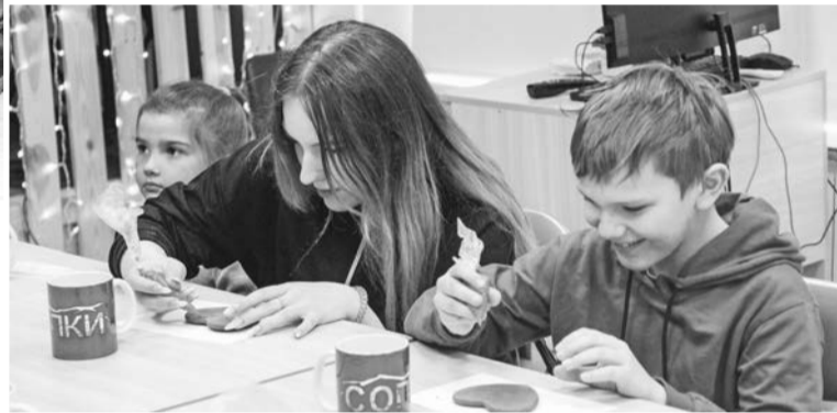
Айсинг, которым дети расписывают пряники, представляет собой массу для рисования и создания съедобных украшений.