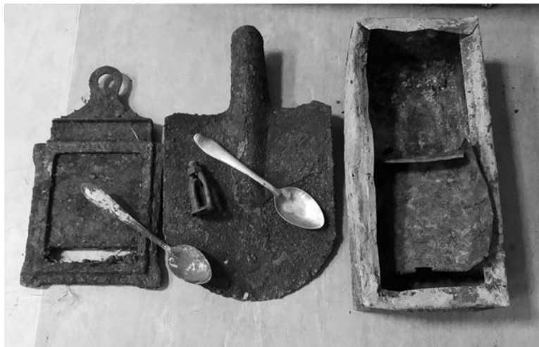
Во время раскопок участники экспедиции нашли предметы быта времен Великой отечественной войны.

Мурманские и североморские поисковики подрастающему поколению пример неравнодушного отношения к истории родного края.