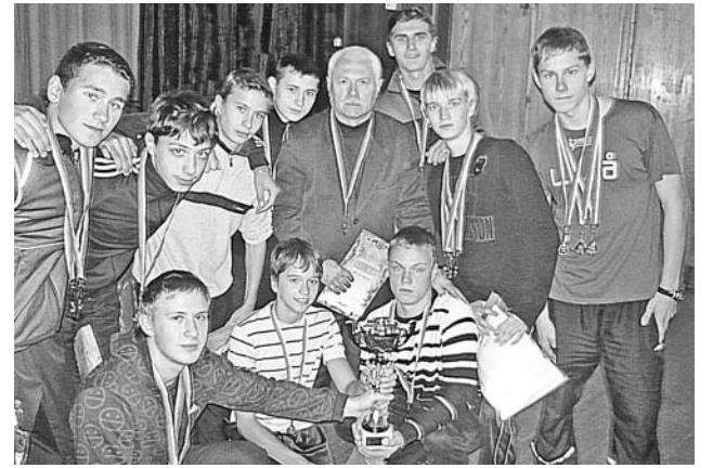
В сборную Североморска вошли ребята из гимназии №1, школ №№1, 7, 9, 10 и 12.

Вот уже третий год подряд вне конкуренции оказались юноши из флотской столицы, занявшие в общекомандном