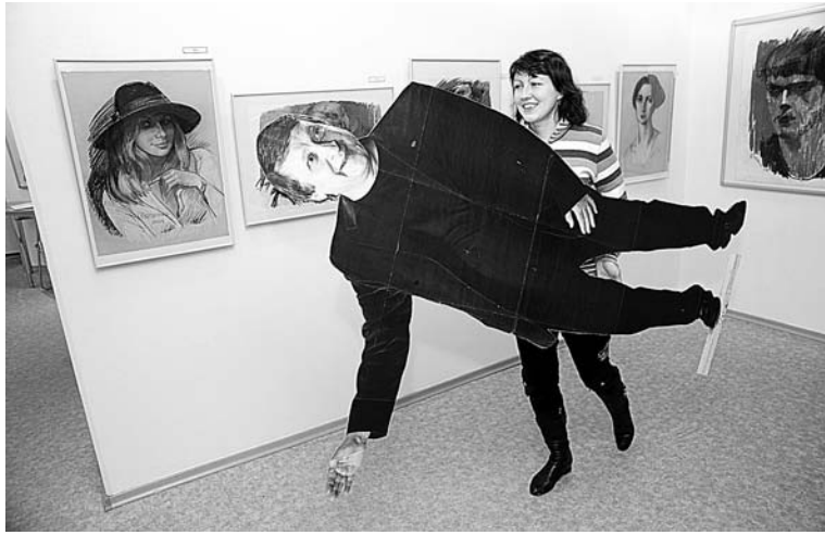
Каждый день посетителей выставки приветствует художник, правда, не лично, а при помощи двойника.

– Последние биеннале (от лат. bis – «дважды») и annus – «год»; международные выставки изобразительного искусства, проходящие каждые два года – авт.) по-