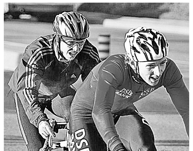
Только конкуренция заставляет показывать высокие результаты.