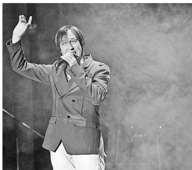
Каждая песня Николая Носкова – сгусток переживаний, эмоций, впечатлений.

– Причины не в том, что не приглашают, наоборот, – комментирует певец. – Я принимал приглашения несколько раз, но каждый раз недоумевал, что я там делаю. Та тусовка, то, о чем там люди говорят, – все это совершенно далеко от меня. И я как-то стараюсь, выкручиваюсь, но в итоге, когда видишь себя по телевизору, понимаешь, что выглядишь как идиот какой-то. Поэтому я очень-очень редко откликаюсь на подобные предложения. Обычно, если ведущий мне как человек импонирует или передача ориентирована на какую-то хорошую интересную тему, тогда при-