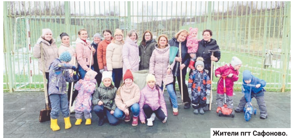
Жители пгт Сафоново.