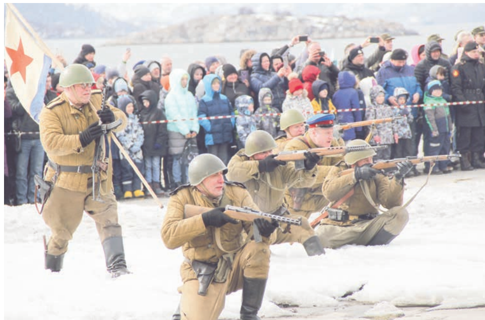
Отряд «СМЕРШ» ведет захват диверсантов.