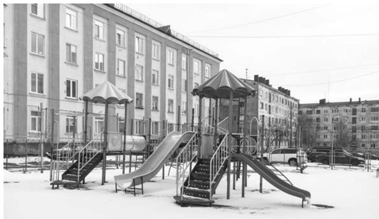
Площадка на ул. Комсомольской, 1–9: установка нового игрового оборудования с устройством травмобезопасного покрытия, а также скамеек и урн.