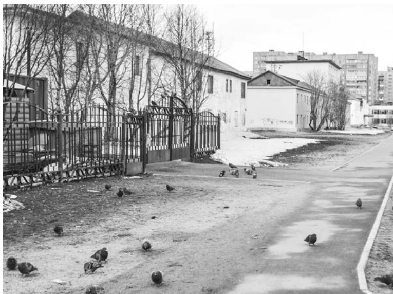
Аллея от дома №4а до дома №27 на ул. Северной: обустройство смотровой площадки, прогулочной аллеи, зоны отдыха и мини-парковки на 3–5 мест, установка новых опор уличного освещения и озеленение территории.