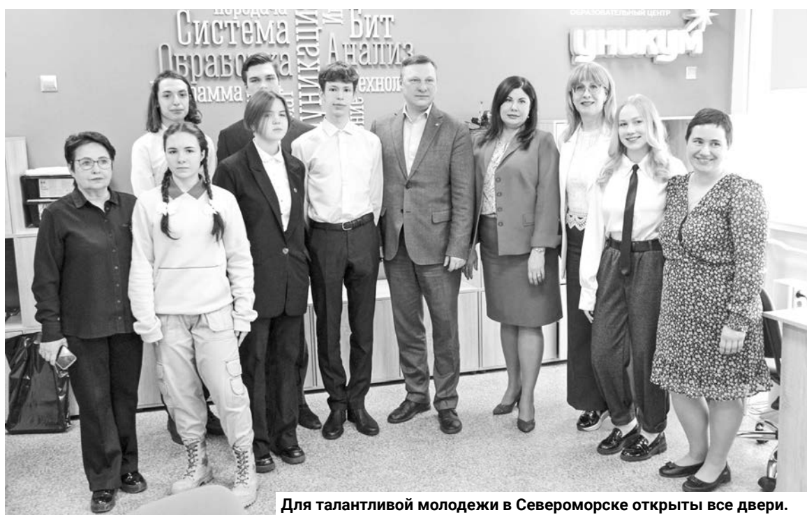
Для талантливой молодежи в Североморске открыты все двери.