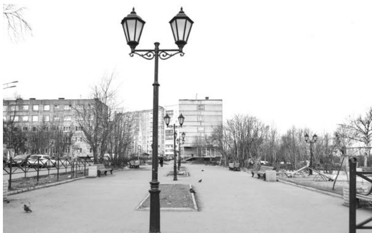
Сквер «Народный»: устройство прогулочных дорожек, установка новой детской площадки, освещения, скамеек, урн и других элементов.