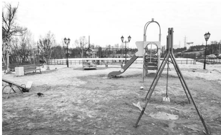
Площадка возле ТЦ «Авиатор» (Авиагородок): демонтаж старого оборудования. Планируется обустройство детской площадки современным игровым оборудованием. Назначение – детская, комбинированная, для младшего и среднего возраста.