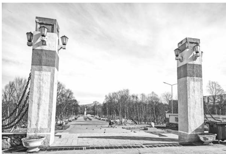
Городской парк: ремонт пешеходной зоны (мощение из плитки), установка новых опор уличного освещения, замена ограждения вокруг танцевальной площадки, а также установка парковых скамеек и малых архитектурных форм.

С 15 апреля по 31 мая 2023 года проходит Всероссийское рейтинговое голосование по отбору общественных территорий для благоустройства в 2024 году в рамках нацпроекта «Жилье и городская среда», инициированного Президентом России Владимиром Путиным. В голосовании могут принять участие жители в возрасте 14 лет и старше из муниципальных образований с населением более 20 000 человек.