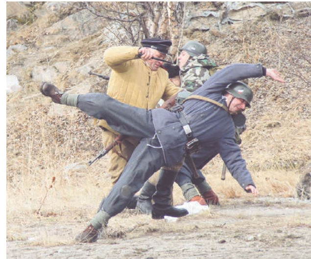
На этот раз в реконструкции участвовали даже актеры Драматического театра Северного флота.

В другом эпизоде реконструкции разыгрывалась сцена искоренения дезертирства. Несколько красноармейцев якобы идут сдаваться в плен. Группа во главе с контрразведчиком снимает вещмешки, обмундирование, оставляет автоматы и винтовки, вооружается ножами и гранатами, которые прячут в одежде. Подняв палку с белым флагом, начинают движение в сторону противника с поднятыми руками, в которых держат лист бумаги — якобы немецкую листовку с призывом к сдаче в плен. Сблизившись с противником, добровольцы рассредоточиваются среди врага, достают ножи и режут вражеских солдат, одновременно забрасывая гранатами.