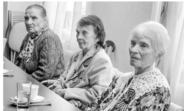
Вот такие они - свидетели Великой Победы!

— Для меня большая честь быть сегодня здесь с вами, с людьми, которые дали нам право на жизнь, на свободу, на развитие. Я искренне благодарю всех ветеранов за их подвиг в военные годы и за тот нравственный пример, который они демонстрируют нам сегодня. Наш долг подхватить это знамя, пронести память о Великой Победе,