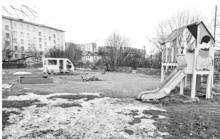
Площадка на ул. Душенова, 13: установка нового игрового оборудования с устройством травмобезопасного покрытия, а также скамеек и урн.