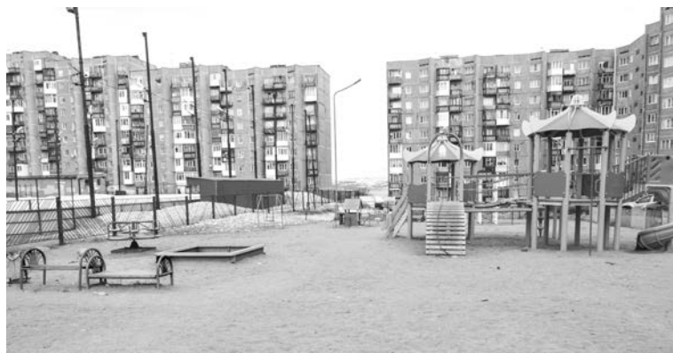
Площадка на ул. Полярной, 4: установка нового игрового оборудования с устройством травмобезопасного покрытия, а также скамеек и урн.