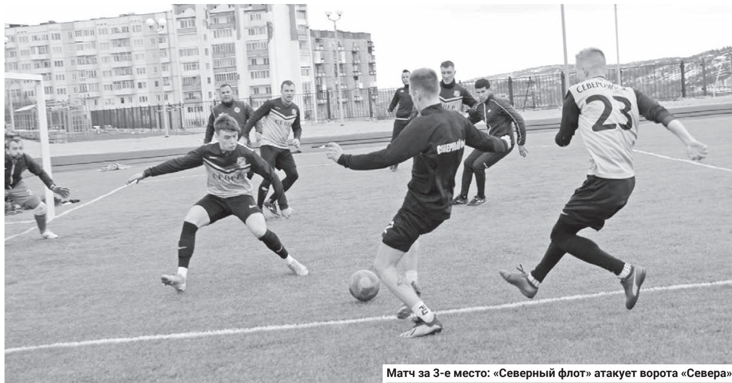
Матч за 3-е место: «Северный флот» атакует ворота «Севера».