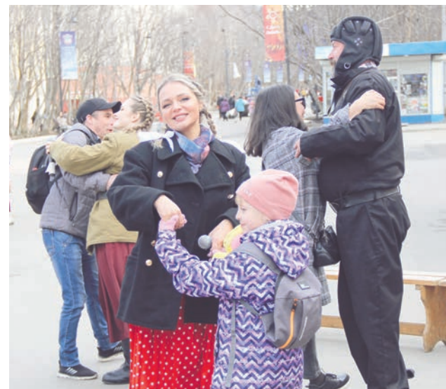
На «Случайный вальс» артисты ЦДМ пригласили зрителем концерта.

— Я по образованию музыкант, поэтому репертуар подбирала сама. В исполнении военных песен главное — душа. Мне близка эта тема, мой дедушка погиб на фронте. Любимая песня «Горит свечи огарочек». Да и вообще весь материал подбирали так, чтобы он трогал струны души — песни, короткие личные истории. На такие мероприятия и внутри коллектива хороший отклик, даже любители готовы в них принять участие. Так у нас поет сэтетик, работает как конференсье и читает сатирическую сценку руководитель клуба военно-исторической реконструкции.