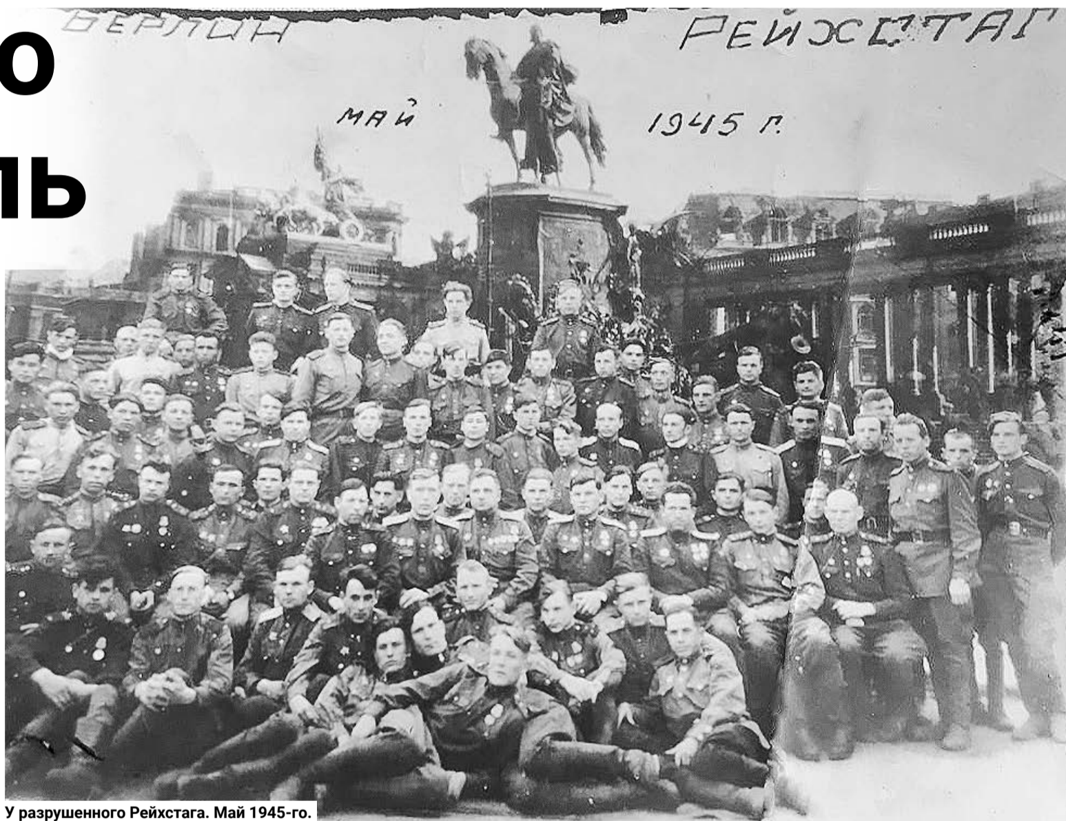
У разрушенного Рейхстага. Май 1945-го.