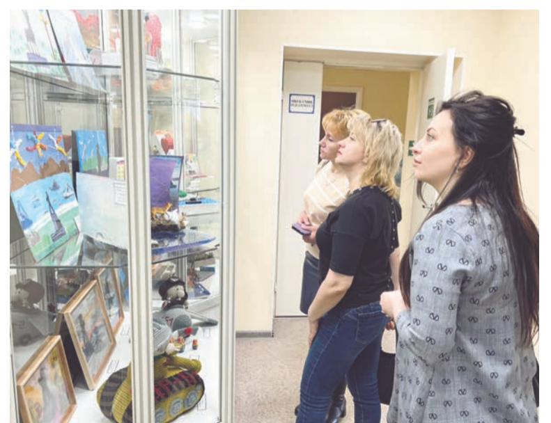
Интерес горожан к выставке «Роднополис» неизменно высок.