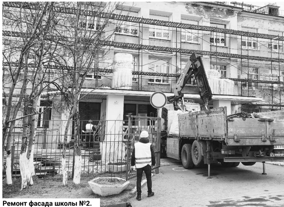
Ремонт фасада школы №2.

В школе №2 пгт Сафоново ремонт только начался, но к началу нового учебного года здесь отремонтируют фасад и кровлю, коридоры, спортивные раздевалки, комнату детских инициатив, входную группу, холл.