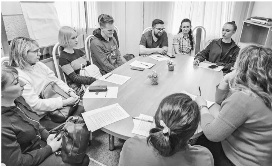
Мероприятия Кадрового центра собирают все больше североморцев.

Также были оказаны необходимые консультации гражданам, которые находятся в поиске работы: по проведению общественных работ, по организации временного трудоустройства безработных граждан, испытывающих трудности