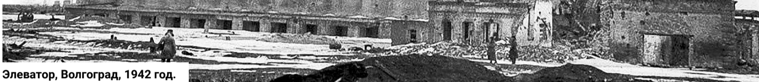
Элеватор, Волгоград, 1942 год.

Многие из тех, на чью долю выпало тяжелое испытание оказаться в гуще военных действий в 1942–1943 годах, делали записи. Кто-то вел личный дневник и спустя десятилетия