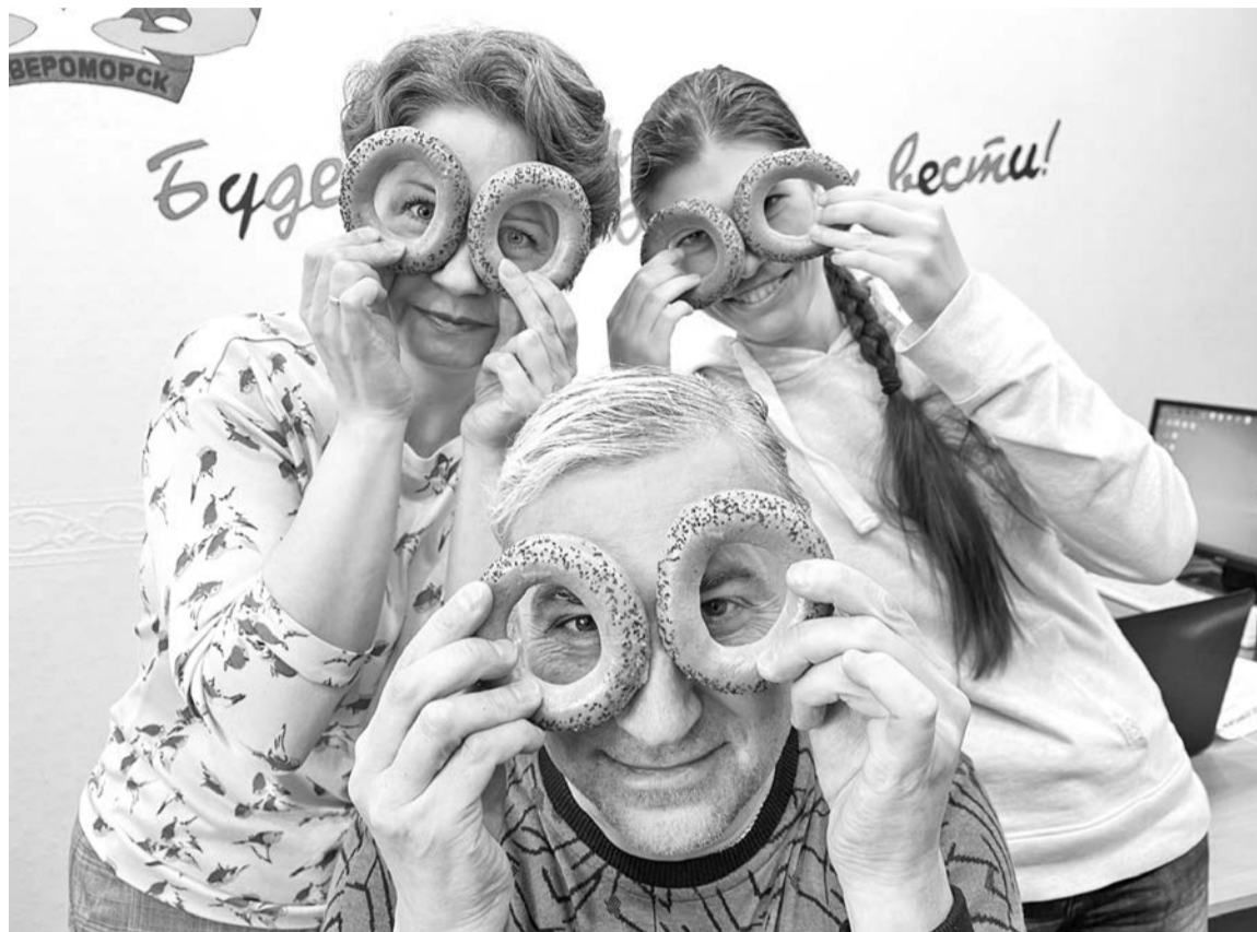
Журналисты «Североморки» готовятся отпраздновать День дырки от бублика.

5 мая — это Хокку-день . Вы пробовали писать японские трехстишия? Это несложно. Никаких