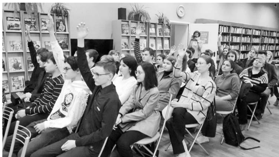
Участники заключительной встречи проекта спешили дать правильные ответы на вопросы игры «О выборах и не только».

— Сначала я думала, что на этом проекте будут обычные занятия по правовой грамотности, а оказалось, что «Правовой ликбез» — это море положительных эмоций, экскурсия в ЗАГС, финансовая игра при поддержке «Сбербанка». Узнала много нового о правовой грамотности. Я уча-