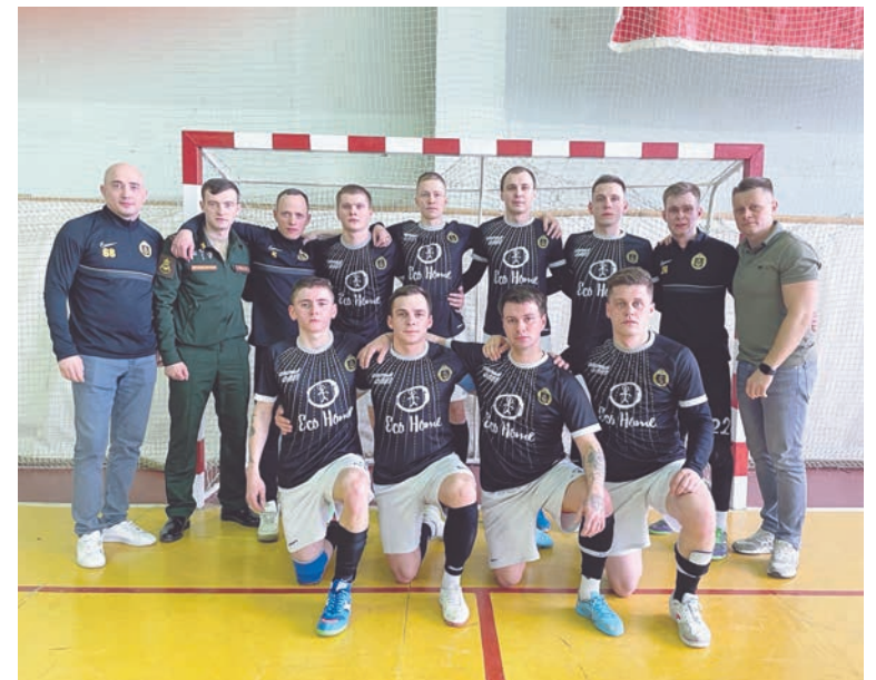
Сборная Северного флота - бронзовый призер чемпионата Вооруженных сил.