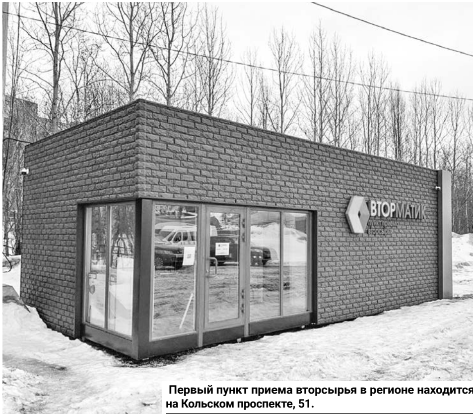
Первый пункт приема вторсырья в регионе находится на Кольском проспекте, 51.

В будущем на площадке экопункта будут проходить образовательные мероприятия, посвященные вопросам экономики замкнутого цикла и раздельного сбора отходов.