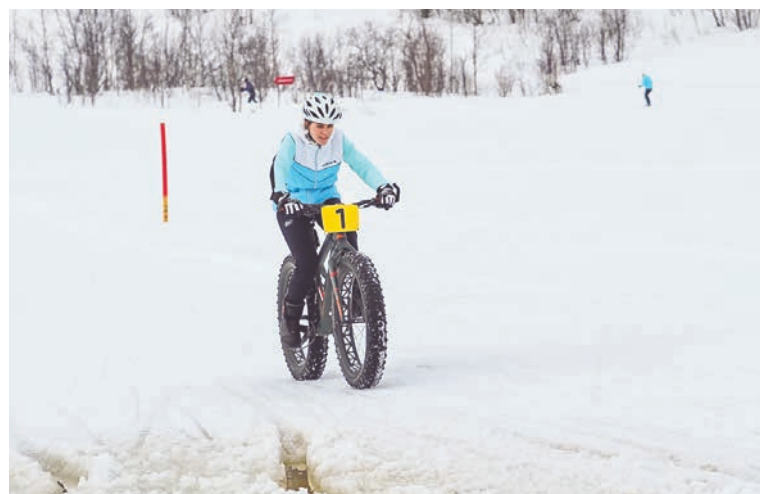
На Рогозере приходилось ехать максимально осторожно: одно неверное движение — и ты по колено в воде.

но было лететь с затаженного марафонского подъема в Долину! С основной задачей — в ровном темпе пройти 25 км — я справилась и прибыла точно к награждению. Для меня участие в соревнованиях было авантюрой — в последний раз я ходила по марафонскому кругу на лыжах несколько лет назад, а на фэте по снегу начала кататься только в этом году. Но увидев соревнования по велоспорту в программе Праздника Севера, просто не могла их пропустить. Благодаря поддерж-