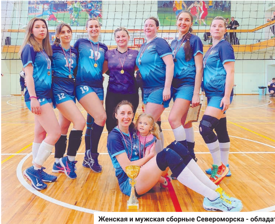
Женская и мужская сборные Североморска - обладатели кубка Мурманской области по волейболу 2023 года.