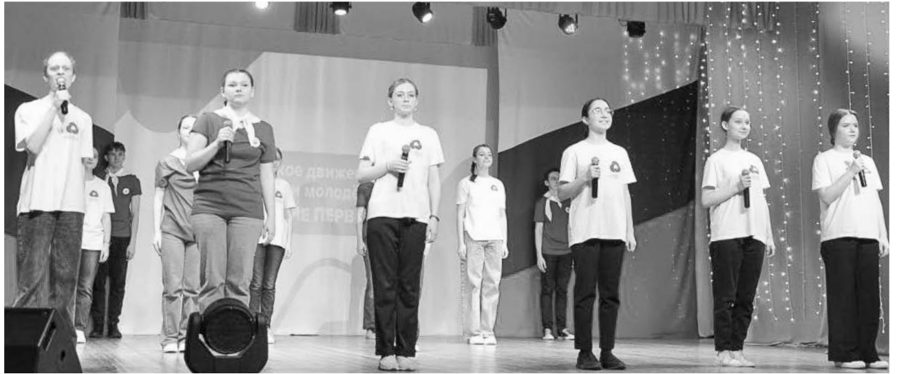
Участники Российского движения школьников и Городского ученического парламента готовы изменить мир к лучшему.

На территории нашего ЗАТО продолжают создаваться первичные отделения Российского движения детей и молодежи «Движение первых» (РДДМ).