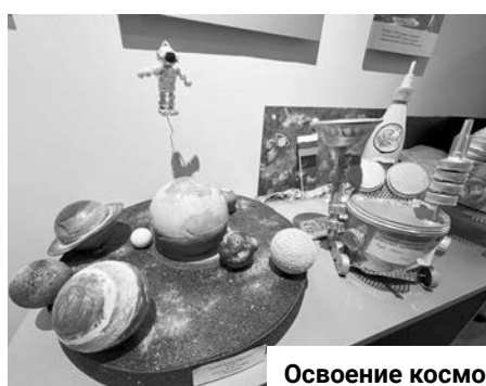
Освоение космоса глазами детей.