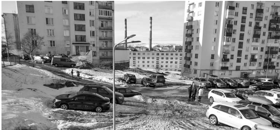
Во время ремонтных работ на ул. Морской по возможности будет расширена проезжая часть и увеличено количество парковочных мест.