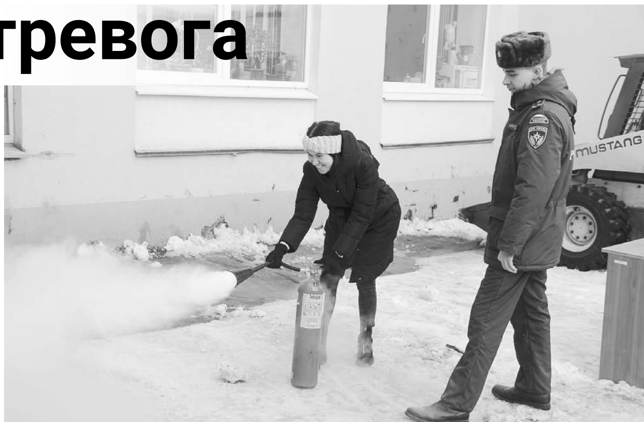
На ежегодных плановых учениях по эвакуации сотрудники администрации получили практические навыки по обращению с огнетушителем.

— Прибыли также сотрудники компании «Вымпел», которая обслуживает пожарную сигнализацию. Нам были даны определенные рекомендации по поводу усовершенствования пожарной системы. В ближайшее время планируем спроектировать более современную конструкцию, у которой будет голосовое сопровождение. Это нужно сделать в целях минимизации числа ложных срабатываний, ведь автоматическая сигнализация порой реагирует на пыль, влажность, воздушные потоки и так далее.