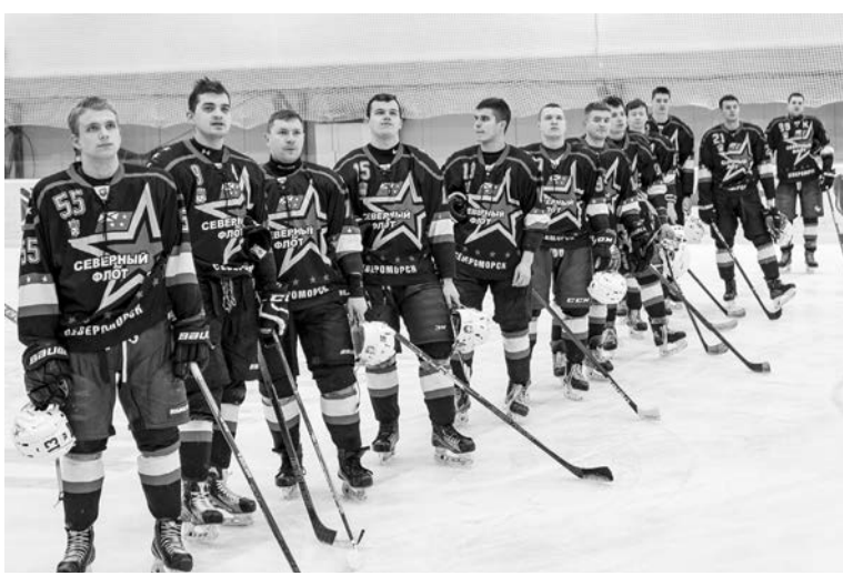
Командные виды спорта на СФ завоевывают все больше болельщиков. Сборная команда СФ по хоккею с шайбой сегодня занимает лидирующую позицию в чемпионате Мурманской области.