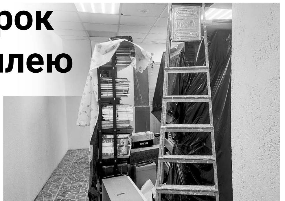
Ремонтные работы в первом читальном зале практически завершены. Уже со следующей недели подрядчик планирует приступить к обновлению второго пространства.

На выделенные муниципалитетом средства уже проведен ремонт уборной — теперь она доступна и для маломобильных граждан,