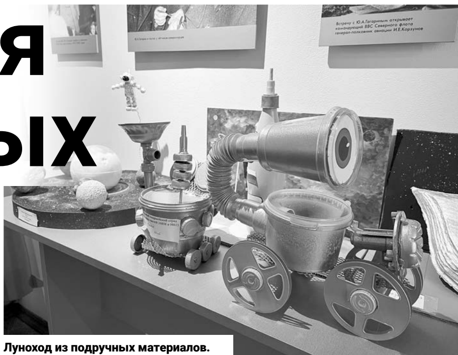
Луноход из подручных материалов.