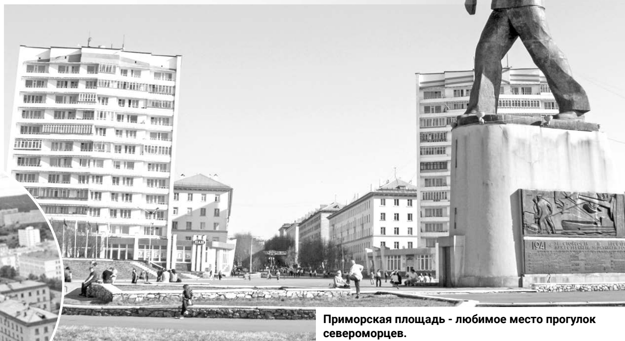
Приморская площадь - любимое место прогулок североморцев.

Горожане любовались своим кинотеатром — вы-