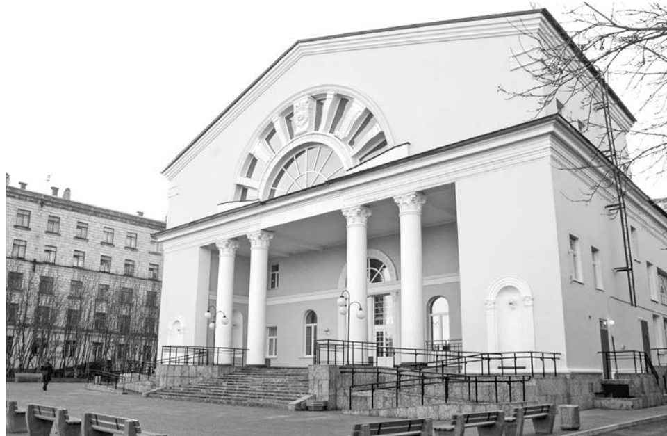
В здании бывшего кинотеатра «Россия» сейчас располагается Центр досуга молодежи.