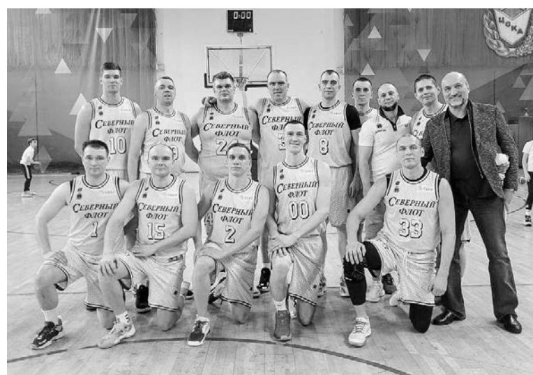
На завершившемся в марте чемпионате ВС РФ по баскетболу сборная СФ замкнула тройку призеров.

18 апреля 2011 года в Североморске была образована Спортивная детско-юношеская школа олимпийского резерва (комплексная). На ее базе открылись два отделения — «плавание» и «бокс», эти виды спорта активно культивируются и сегодня.