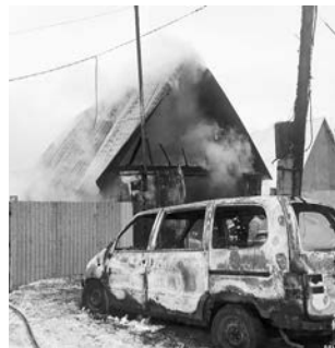
Пожар в гаражном кооперативе в пгт Сафоново.

9 апреля в 4 часа ночи поступило сообщение о пожаре в гаражно-строительном кооперативе, расположенном в районе ул. Панина пгт Сафоново. Огнем были охвачены шпальный гараж и припаркованный в трех метрах от него минивэн Nissan Serena 1996 года выпуска. Площадь пожара составила 50 кв. метров. Огнем полностью уничтожен гараж, автомобиль, мотоцикл, личные вещи хозяина, а также хозяйственная обстановка в гараже и др. Кроме того, частично подгорело соседнее одноэтажное бетонное строение, огнем повреждены деревянный столб с электропитанием и центральная линия электропередачи. В ходе проверки было установлено, что гараж принадлежал 29-летнему А., который утверждает, что конфликта с кем не имел.