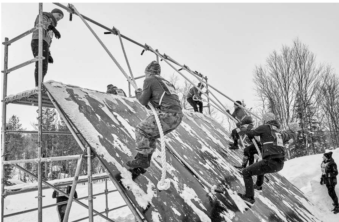
Около 50 военнослужащих СФ приняли участие во Всероссийских соревнованиях «Гонка Героев».

В 1998 году 43-й спортклуб был сокращен, а на его базе сформирован 123-й Центр морской и физической подготовки. 1 октября 2002 года вновь изменения — на базе 123-го Центра сформирован 77-й спортивный клуб, одной из задач которого является развитие Олимпийских видов спорта, а также воспитание достойной спортивной смены.