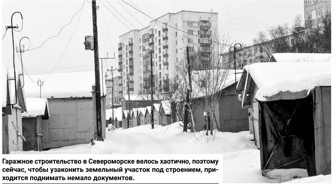
Гаражное строительство в Североморске велось хаотично, поэтому сейчас, чтобы узаконить земельный участок под строением, приходится поднимать немало документов.

Что касается аренды земельного участка под гараж. В 2021 году законодательство определило, что те граждане, которые построили гаражи до введения в действие Градостроительного кодекса, то есть до 2005 года, имеют право при предоставлении документов, подтверждающих право собственности на этот гараж, узаконить свои отношения с арендодателем земельного участка — заключить договор арен-