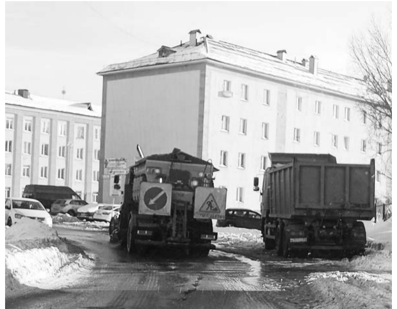
В весенний период гололед — частое явление, поэтому часть спецтехники чистит снег, а часть — занимается посыпкой дорог и тротуаров.

Так, на минувшей неделе, уже в воскресенье, они активно приступили к ликвидации непогоды. Во дворах и на дорогах муниципалитета последствия снегопадов и порывистого ветра устраняли более 32 единиц техники. Также ежедневно велась ручная уборка территорий и тротуаров. В первую очередь силы были сконцентрированы на обеспечении бесперебойного транспортного сообщения, а также доступе к социально значимым объектам: школам, детским садам, учреждениям здравоохранения. Кроме того, необходимо было прочистить подъезды к контейнерным площадкам, чтобы не допустить срыва вывоза мусора. Далее — работа во дворах. Из-за резких перепадов температур очень быстро образуется