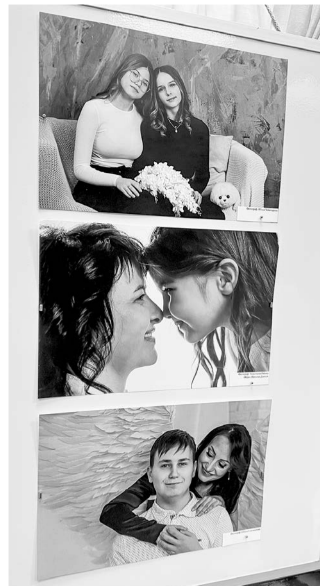
Лучшие снимки - на мольберт.

В Центральной городской библиотеке им. Л. Крейна открылась удивительная выставка, ставшая итогом акции «Крылья ангела». (0+)