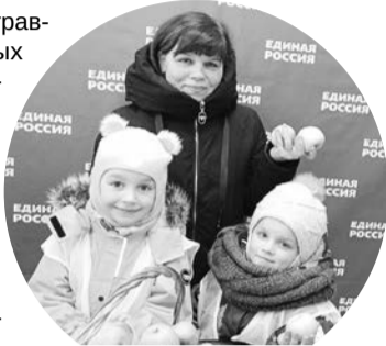
За сданную батарейку - полезный фрукт.