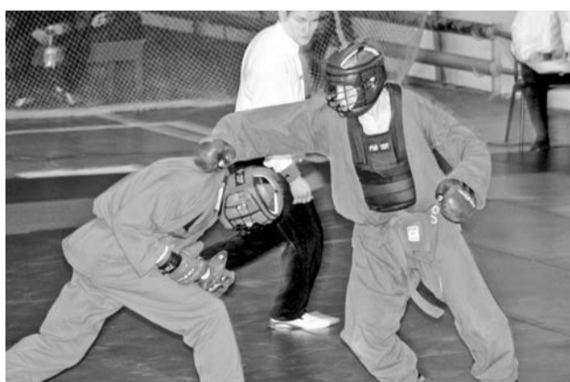
Рукопашный бой - наиболее зрелищный и азартный вид армейского спорта.

граду спортсмен получал, освоив новый вид гоночных яхт олимпийского класса: «Финн», «Торнадо», «Звездный».