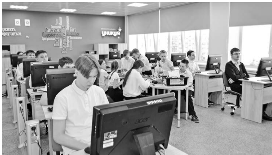
Площадка олимпиадной подготовки «Уникум», открывшаяся на базе школы №7.

20 площадок олимпиадной подготовки «Уникум».