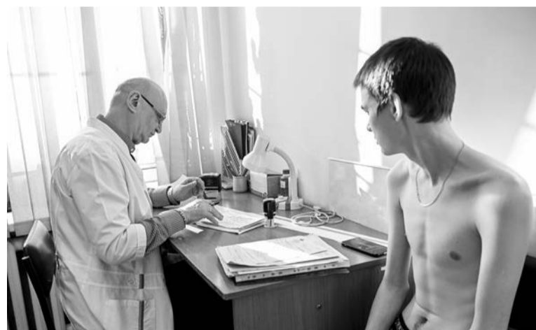
Из армейских и флотских гарнизонов о североморских призывниках приходят неизменно положительные отзывы.