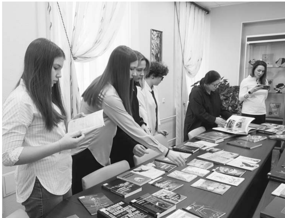
Книги о Кольском крае, представленные в розовой гостиной, заинтересовали участников Дня информации.