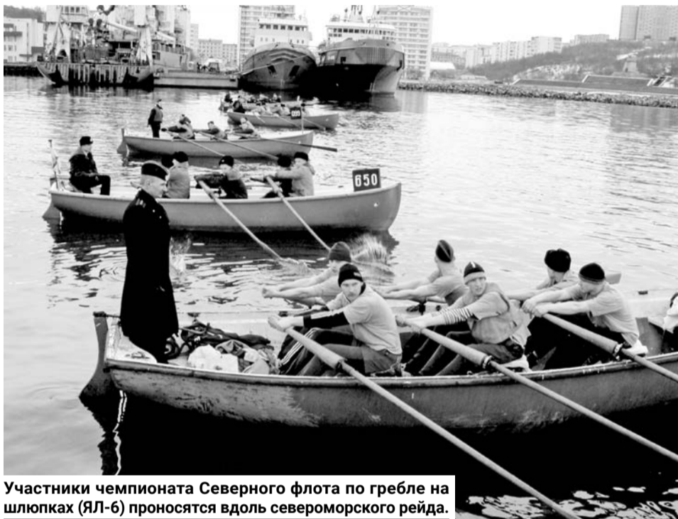
Участники чемпионата Северного флота по гребле на шлюпках (ЯЛ-6) пронеслись вдоль североморского рейда.