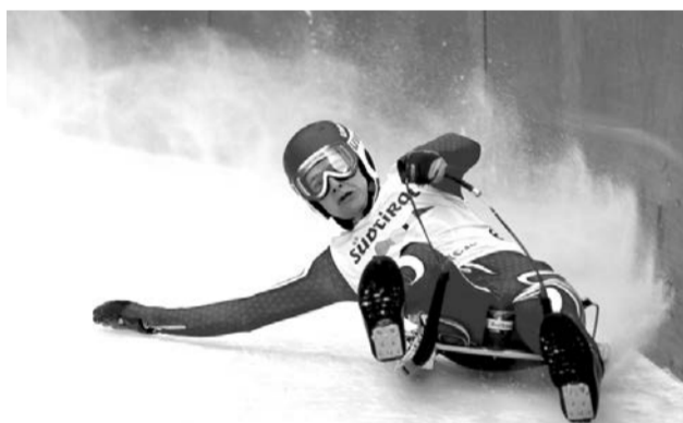
Сборная СФ по натурбану образовалась в 2004 году, а с 2005-го спортсмены начали показывать высокие результаты.