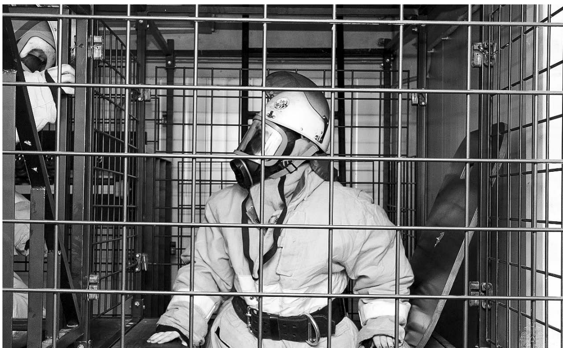
Прохождение участниками теплодымокамеры - замкнутого лабиринта из железных клеток, имитирующего незнакомое задымленное помещение.

В честь 50-летнего юбилея Спецуправления ФПС №48 МЧС России 24 марта с 13 до 16 часов на площадке перед ДК «Строитель» пройдет выставка пожарной техники и оборудования. 0+.