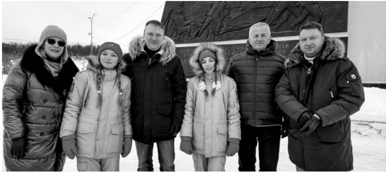
Североморские юнармейцы - активные участники всех патриотических мероприятий. Флешмоб «Крымская весна» - не исключение. А фото на память - это уже традиция.

18 марта 2014 года Республика Крым и город Севастополь официально вошли в состав Российской Федерации и стали ее новыми субъектами.