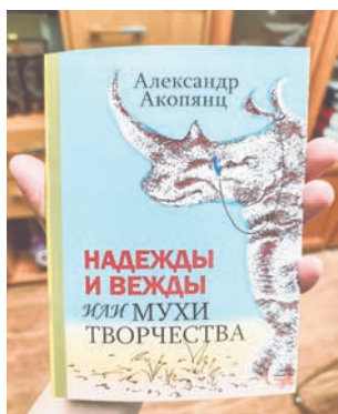
В этой книге - пародии и отповеди. Интересно, как к ней отнесутся «герои».