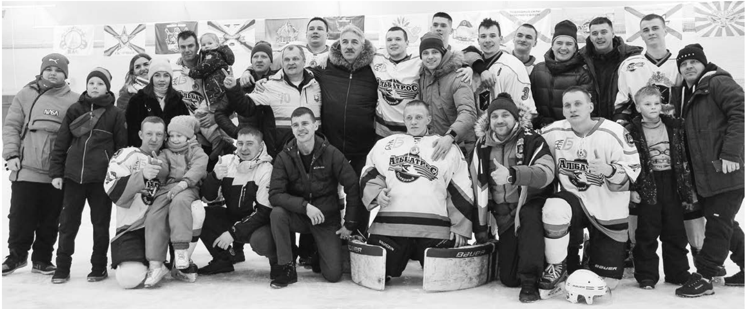
Сборная Кольской флотилии «Альбатрос» (Полярный) с членами семьи и болельщиками. Команда завоевала право представлять Мурманскую область на Фестивале Ночной хоккейной Лиги в Сочи.

Самый яркий хоккей на Мурмане — в Североморске и Полярном, и это хоккей в исполнении команд Северной военной хоккейной лиги.