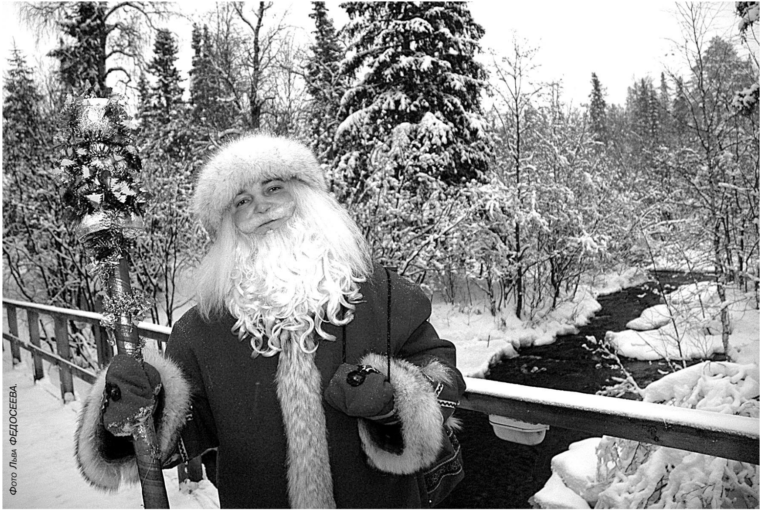
В Мурманской области Дед Мороз поселился в 1995 году. На берегу озера Чуна в Лапландском заповеднике у него свой терем, где во время новогодних каникул он принимает детвору.