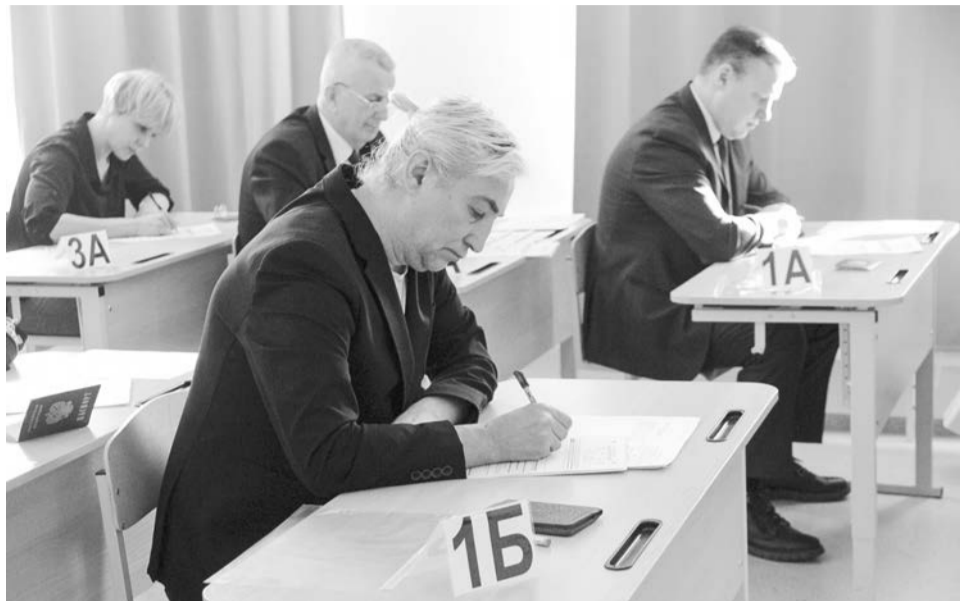
Тот самый случай, когда за парту имеют возможность сесть и глава муниципалитета, и руководитель Совета депутатов, и журналист.

На входе в аудиторию нас встречает охрана. С собой только паспорт и черная гелиевая ручка. Мобильники сдать и — вперед, на металлоискатели!