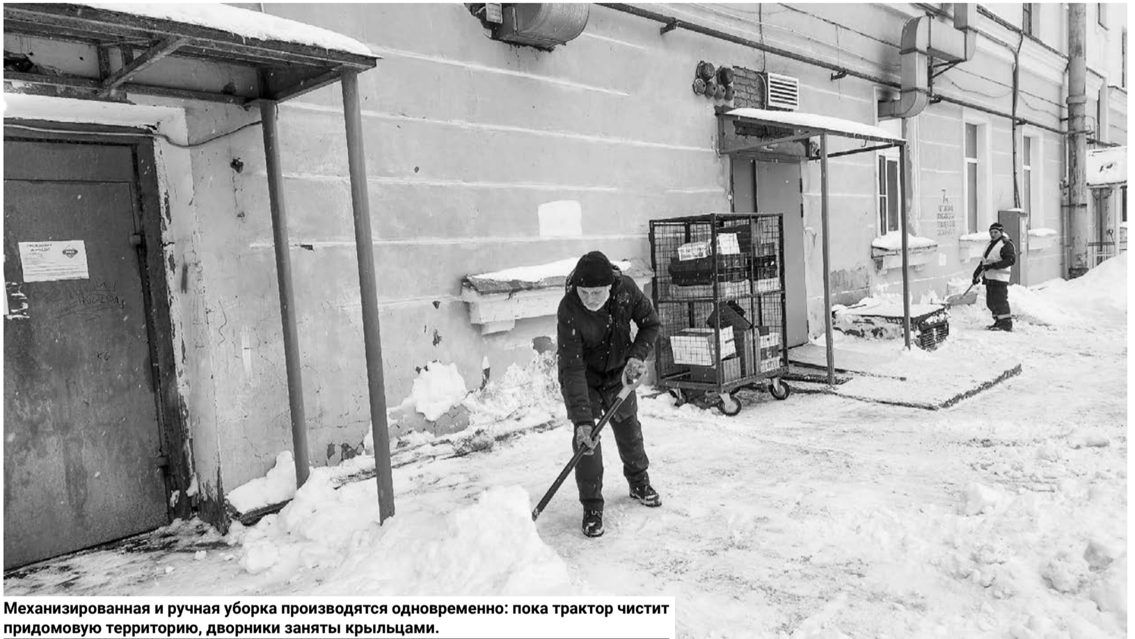
Механизированная и ручная уборка производятся одновременно: пока трактор чистит придомовую территорию, дворники заняты крыльцами.

— Ничего необычного. Работаем в привычном ритме, — рассказывает механизатор