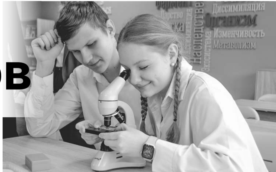
Ученики школы №7 первыми из североморцев оценили возможности кабинетов «Уникум».

— Здорово, что на федеральном, региональном и муниципальном уровне создаются все условия для качественного образования детей, молодежи. Строятся новые учреждения, ремонтируются и модернизируются действующие, — сказал Олег Прасов. — В Мурманской области эти цели реализует программа «Арктическая школа». На базе школы №7 теперь действуют современные высокотехнологичные лаборатории, ко-