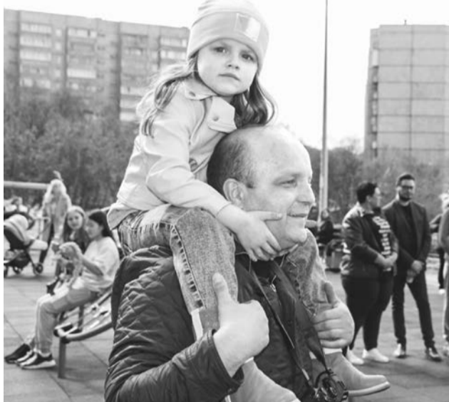
Сергеевы активные участники городских мероприятий, проектов, акций.

В муниципалитетах Мурманской области сейчас проходит отборочный этап конкурса. Комиссии, в составе которых представители органов местного самоуправления, общественных организаций, средств массо-