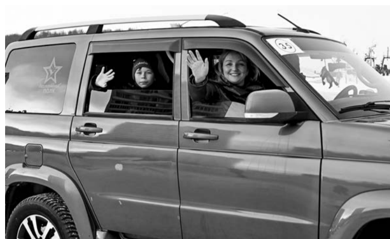
В автопробегах, организованных Профсоюзом гражданского персонала ВС РФ, традиционно участвуют целыми семьями.

Несмотря на не самую «летнюю погоду», маршрут автоколонны остался неизменным. Экипажи