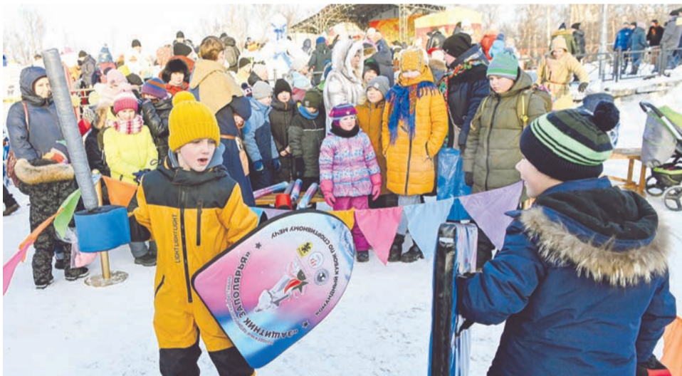
На площадке реконструкторов мальчишки учились азам фехтования и азартно сражались на спортмечах.