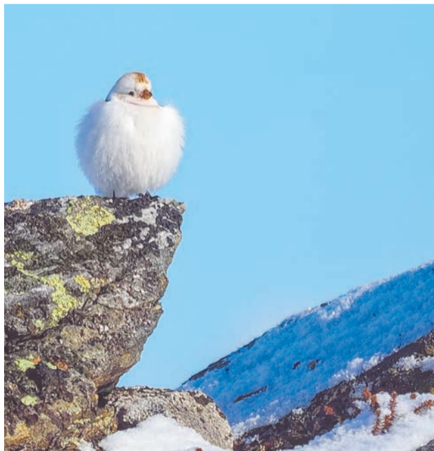
Пушистой пуночке не страшны любые морозы.