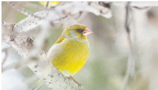
В марте в загородный парк пожаловали зеленушки.