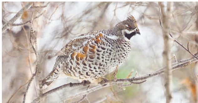
Благодаря пестрой окраске рябчик отлично маскируется в лесу.