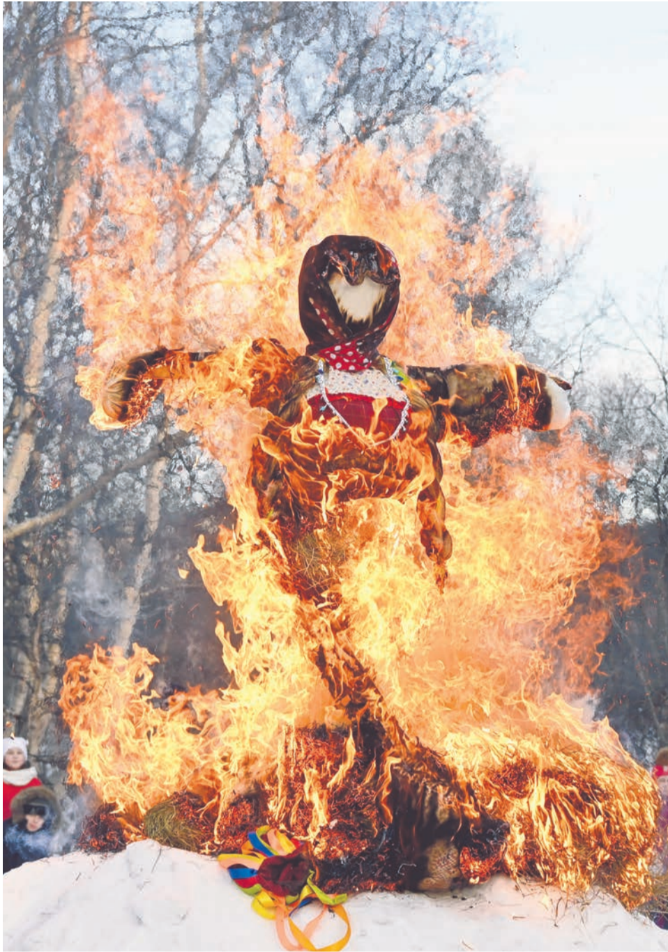
«Прости, Маслена, прощай, а на тот год приезжай!»