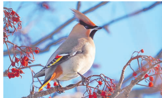
Прошлой зимой свиристели вместе с щурами радовались изобилию рябины в Северноморске и за городом, а этой — кормились в более урожайных местах.

Март — отличное время для лыжной прогулки или просто выхода на природу. И если быть внимательным, там можно встретить любопытных птичек.