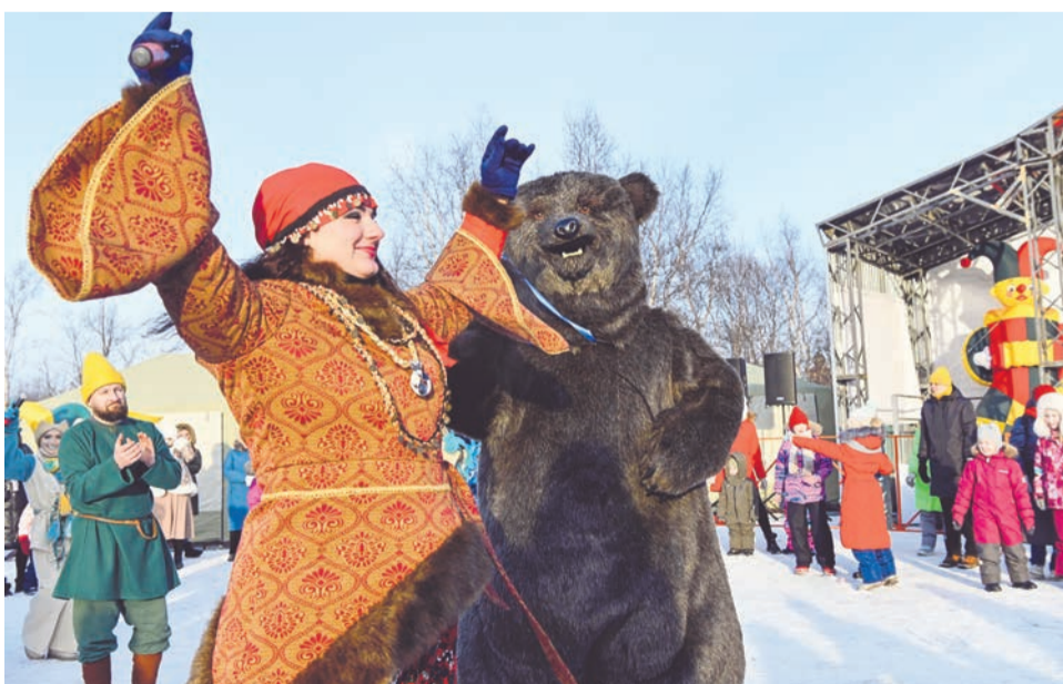
Ручной медведь, впервые появившийся на празднике вместе с Цыганкой, потешал горожан.