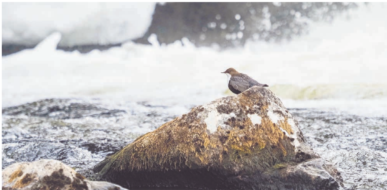
Оляпка умеет не только нырять, но и бегать по дну. Она погружается на глубину 1 метр и может обходиться без кислорода почти минуту, за которую пробегает от 10 до 20 метров.