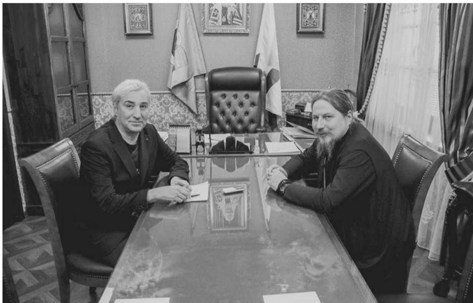
Епископ Тарасий никогда не отказывается от открытого диалога, ежегодное интервью нашему изданию стало уже доброй традицией.

жи есть стремление к духовным ценностям.