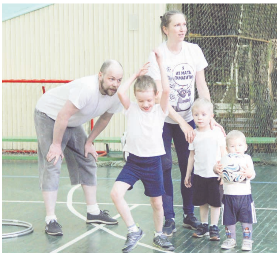
В семье Меньших четверо мужиков и еще один на подходе, но главная «зажигалочка» здесь — мама.