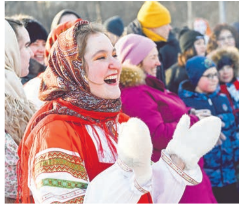
Несмотря на мороз, гости веселились от души.