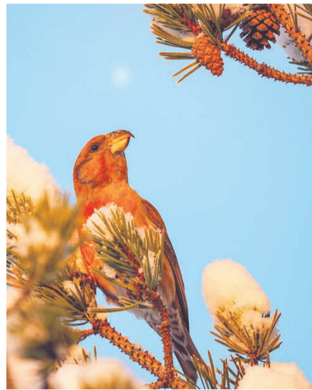
Клестов-сосновиков можно встретить во время лыжной прогулки в районе Авиагородка.