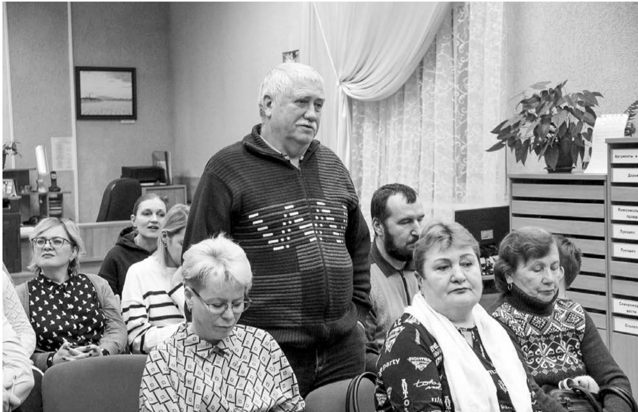
Гаражный кооператив «Шина» часто оказывается на слуху, в том числе из-за внутренних неурядиц.