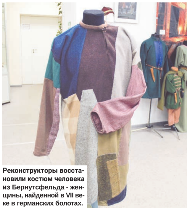
Реконструкторы восстановили костюм человека из Бернутсфельда - женщины, найденной в VII веке в германских болотах.

— Реконструкторы — это люди, увлеченные историей, которые хотят не только читать о ней или мысленно ее представлять, но и сделать ее осязаемой. Каким образом появляются предметы? Мы обращаемся к музейным экспонатам, изучаем их, делаем полное описание, фотографируем.