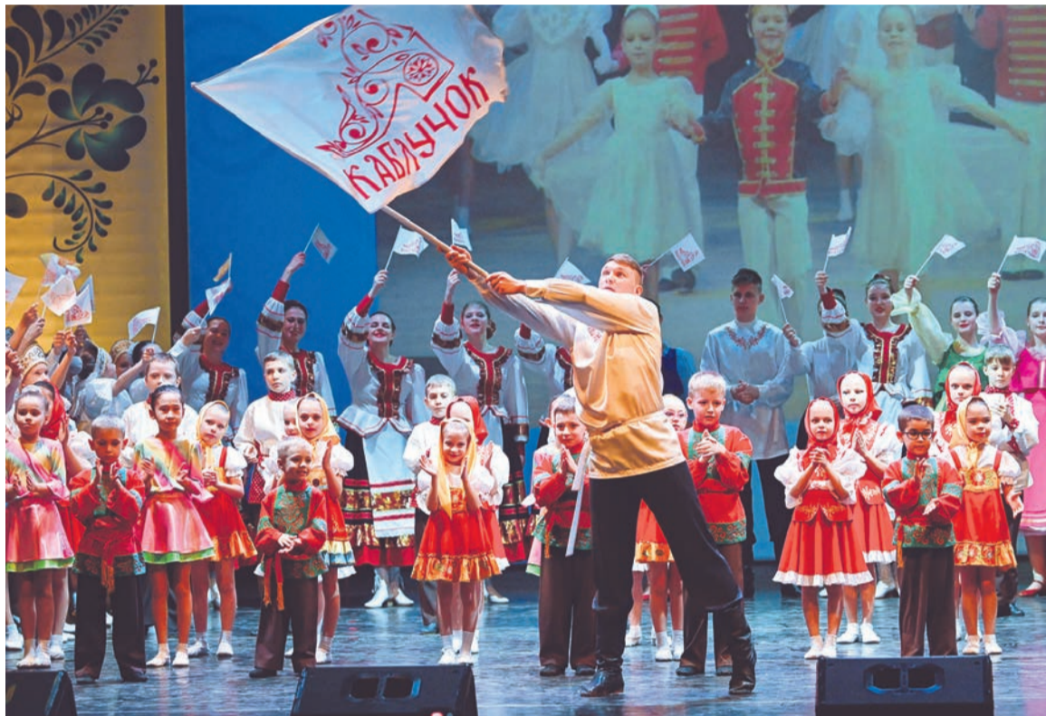
Выход на сцену всего состава ансамбля «Каблучок» в финале юбилейного концерта показал, сколько талантливых ребят объединил народный танец, как он популярен в Североморске.