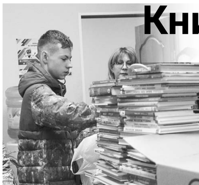
Акция «Книги - детям Донбасса» стартовала с начала февраля, уже две недели североморцы активно несут книги.

«Денискины рассказы» (6+) и «Белый Бим черное ухо» (12+), «Тимур и его команда» (12+), зарубежная литература, всевозможные энциклопедии, справочники, рассказы, задачки — множество книг, сложенных в десятки коробок.