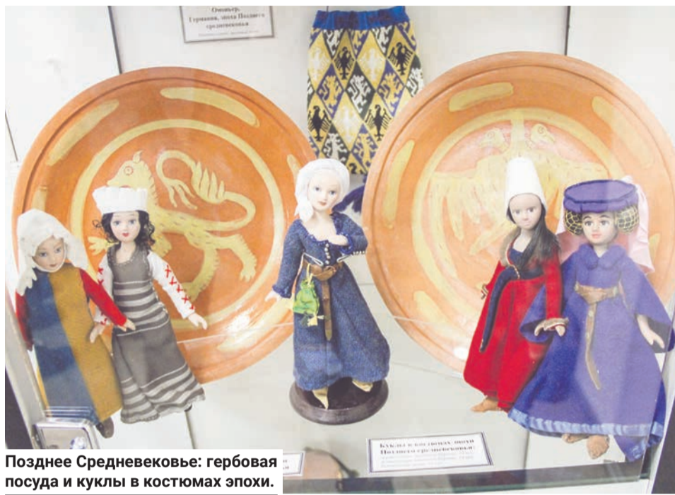
Позднее Средневековье: гербовая посуда и куклы в костюмах эпохи.

Один из наиболее редких экспонатов — так называемый «Человек из Бернутсфельда». Его мумифицированные останки были обнаружены в болотах Северной Германии при добыче торфа и отнесены к VII в. Среди версий о происхождении останков — предположе-