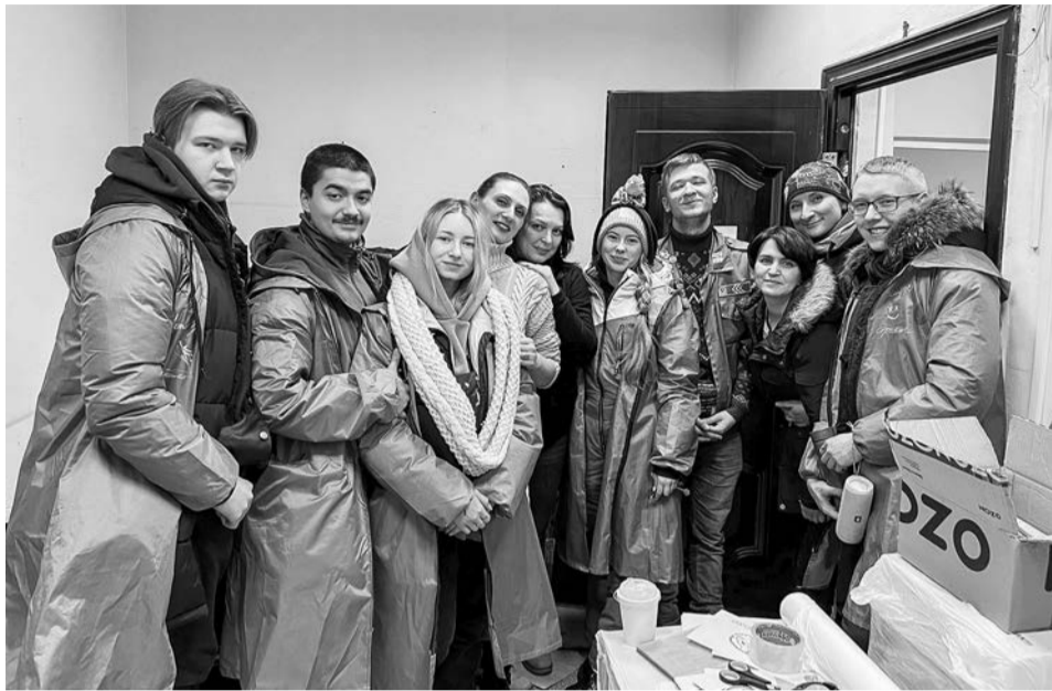
Ребята из «Млечного пути» не ставят перед собой космических задач, а по-земному учатся и трудятся на благо родного края.