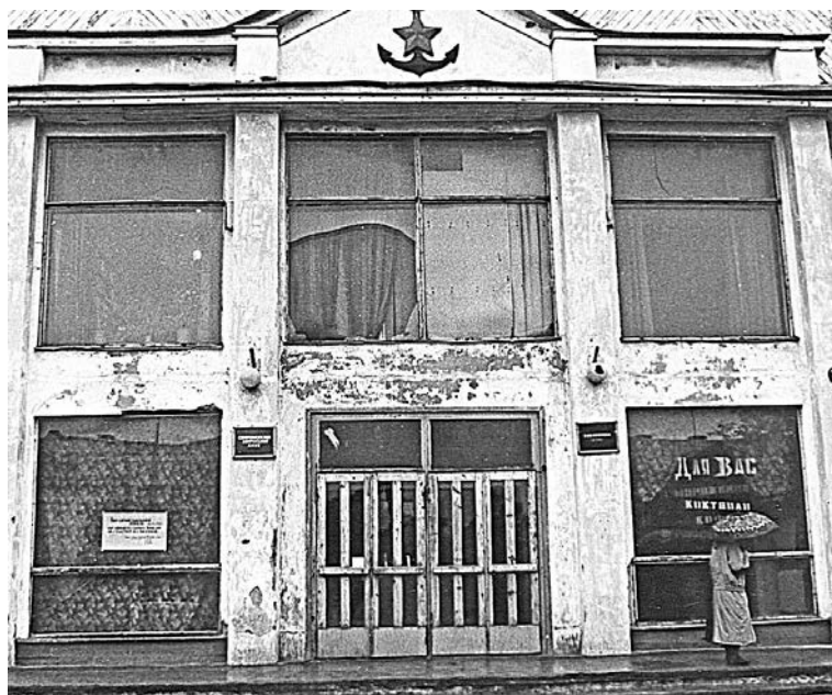
В таком плачевном состоянии здание клуба было до ремонта в 1992 году.