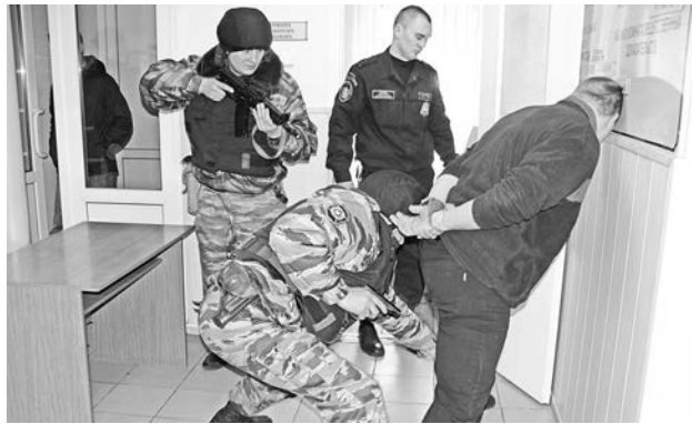
Пронести в зал суда оружие не удастся никому злоумышленнику.

— Цель таких мероприятий — достижение взаимодействия между судебными приставами, ОВД, МЧС и другими силовыми структурами при предотвращении и ликвидации разного рода опасности, —