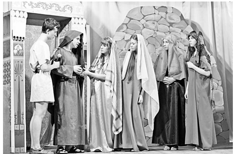
Актеры воссоздали на сцене времена, когда миром правил кесарь Тибериус, а по земле ходил Иисус Христос.