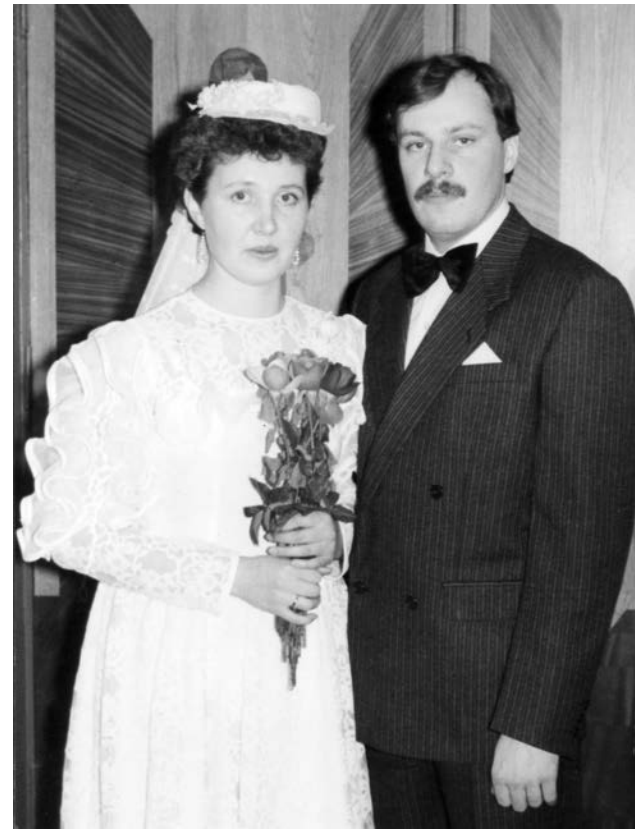
Иногда большая любовь начинается с маленького обмана.

Александру оставалась еще неделя на море, когда отпуск девушки подошел к концу. Она покидала солнечный Севастополь с чувством неуверен-