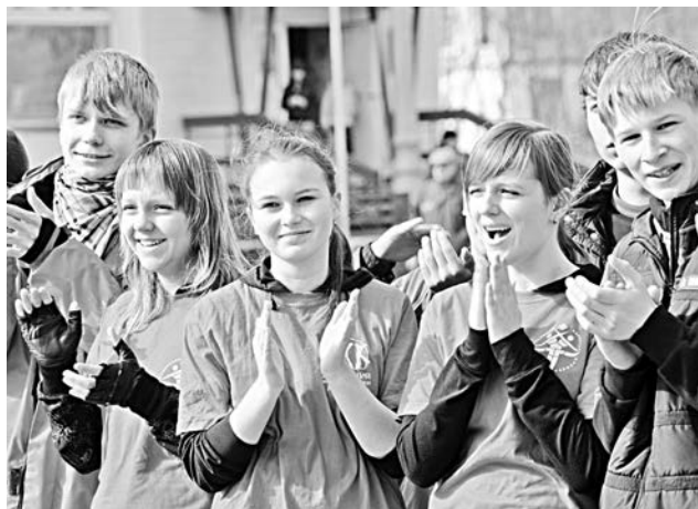
Радость приносит задача любая...

нослужащих и особый участник - команда из города Полярного. Состязание на лучшего знатока истории проходило в два этапа.