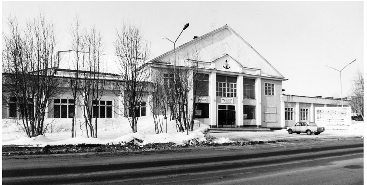
1994 год. После ремонта, проделанного силами сотрудников БМК, клуб стал выглядеть как новенький.

В коллективе меня приняли хорошо, благодаря тому, что я показал свои профессиональные навыки сразу. А было это так. 22 апреля традиционно отмечался день рождения Владимира Ильича Ленина, и так получилось, что готового мероприятия не было. В рукаве у меня был козырь - мероприятие, которое я опробовал в Полярном - устный журнал «Образ Ленина в фото- и киноискусстве». Его можно проводить одному человеку с помощью кинемеханики. Я сам читал текст, сам показывал слайды, сам давал команды на показ кинофрагментов. Мероприятие прошло на одном дыхании, и вопрос о моем профессионализме культпросветработника отпал сам собой. Теперь осталось проявить себя как руководителю. Это было труднее: штат БМК - 32 человека, включая двух офицеров, которые прослужили в клубе не один год. Но я и с этим справился -