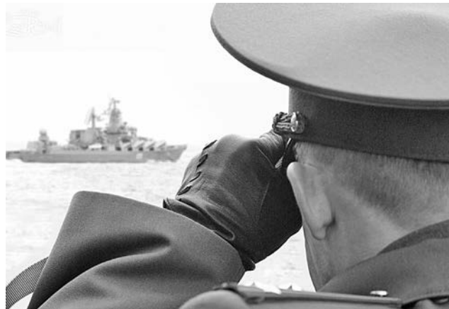
Фотогалерея на сайте Рената Мустафина – отличная возможность взглянуть на мощь Северного флота по-новому.