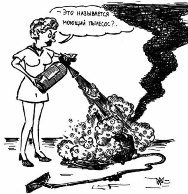
От поломки не застрахован любой пылесос – независимо от цены.

забрали пылесос, без препираний взяли с меня чуть больше 10 тыс. рублей. Бумагу, подтверждающую это, на всякий случай не выбрасываю. Кстати, еще одна знакомая вернула такой пылесос после того, как он задымился и запахом гарью, и при этом заплати-