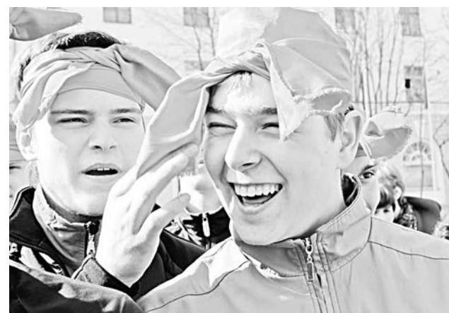
...а солнце играет лучом пригревая.