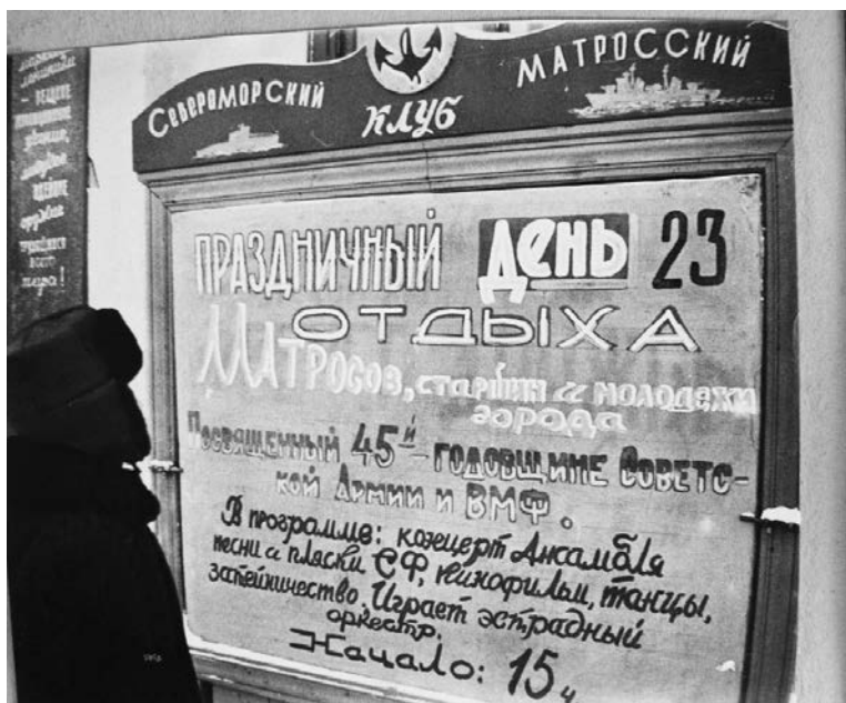
Северноморский МК никогда не пустовал: в нем проходило много интересных мероприятий.