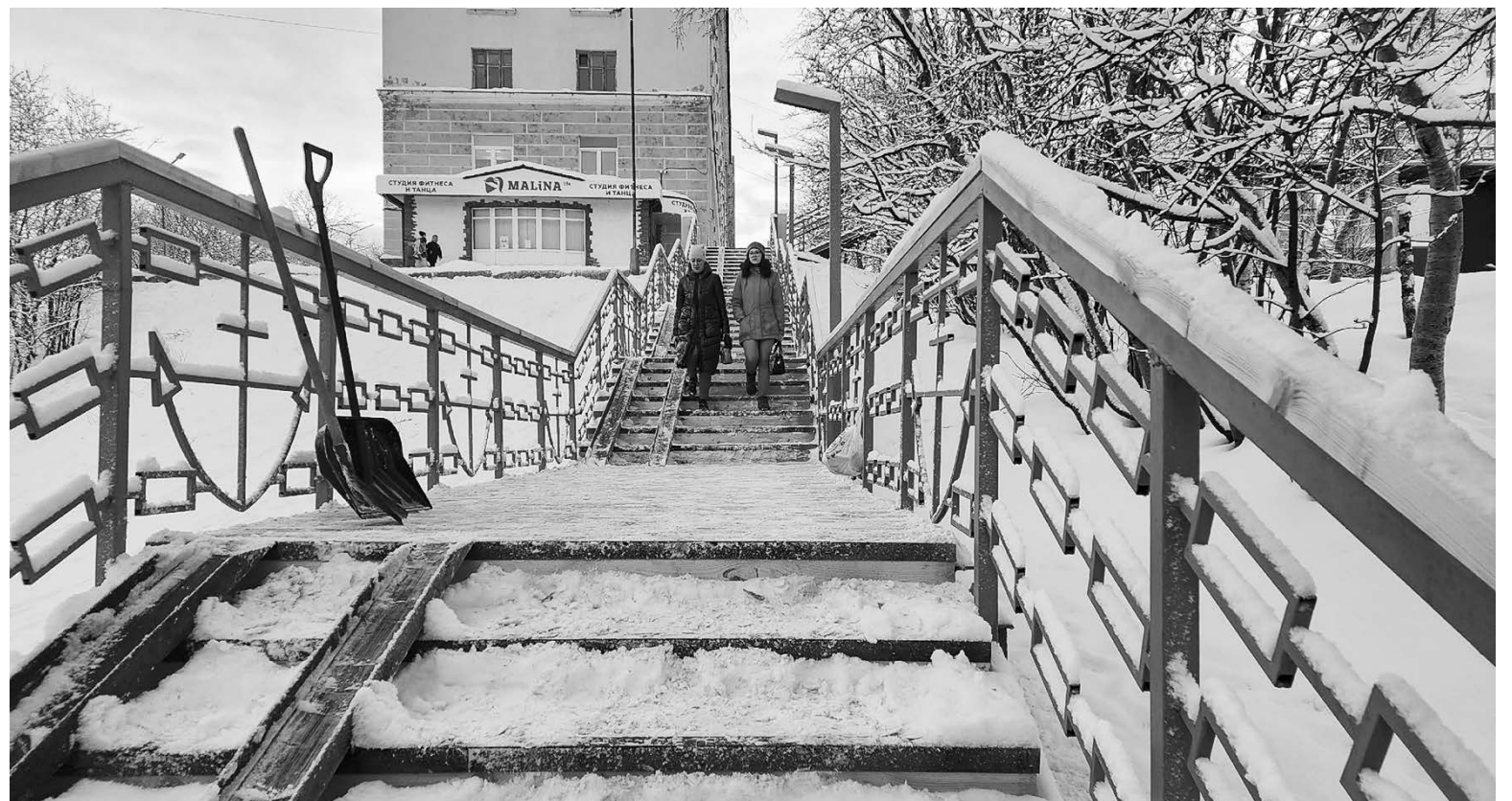
Трап на ул. Душенова стал своего рода продолжением пешеходного моста: опоры освещения и перильные ограждения на обоих объектах выполнены в едином стиле.

10 трапов. В 2023 работы в этом направлении будут продолжены. Конечно, в первую очередь будем обращать внимание на объекты, которые востребованы жителями, — резюмировал глава ЗАТО.