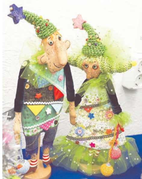
Победители в номинации «Этно-ёлки» Ёлк Ёлкович и Елька Ёликовна Иголкины.