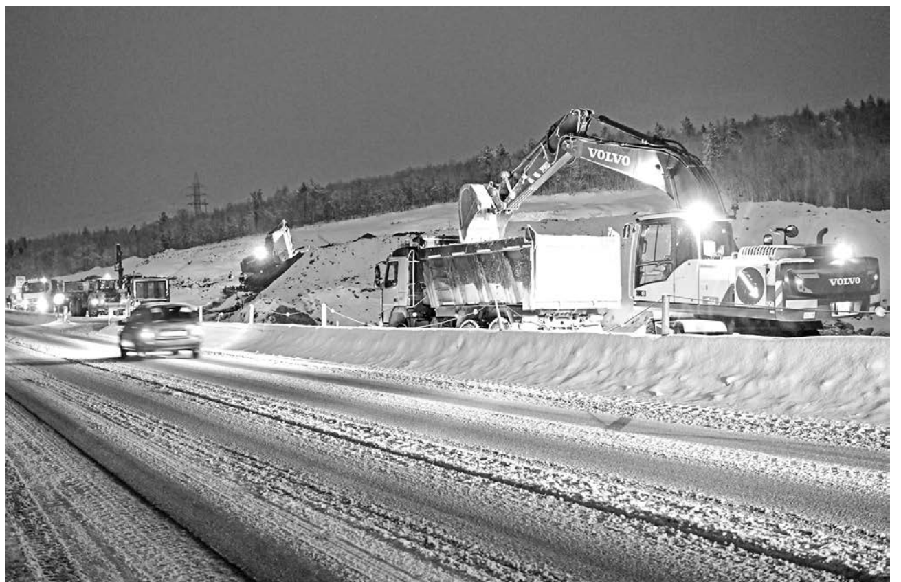
Трасса Североморск-Мурманск будет реконструирована в 2024 году.