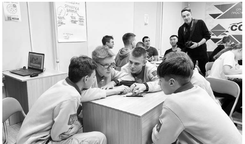
Мозговой штурм команды юнармейцев «Арсенал».