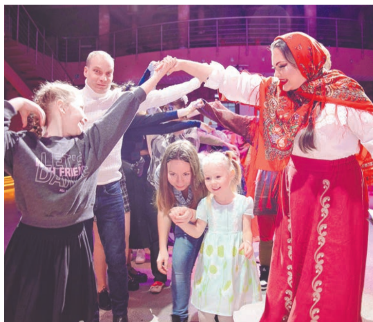
«Ручеек» объединил детей и взрослых, помог участникам праздника познакомиться и подружиться.