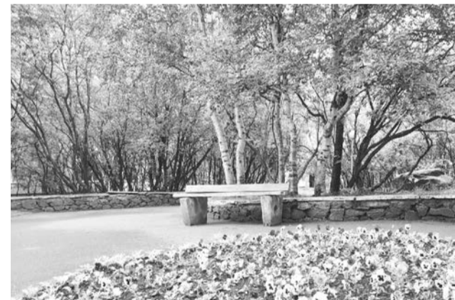
Сквер на пересечении улиц Кирова и Гаджиева может стать еще зеленее и уютнее.

ными боксами, судейским домиком. Рядом будет располагаться парковка для машин. Проект жителя поселка, депутата Совета депутатов по-