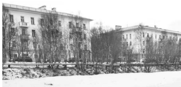
Пустырь на ул. Преображенского в п. Сафоново — подходящее место для нового спортивного объекта.