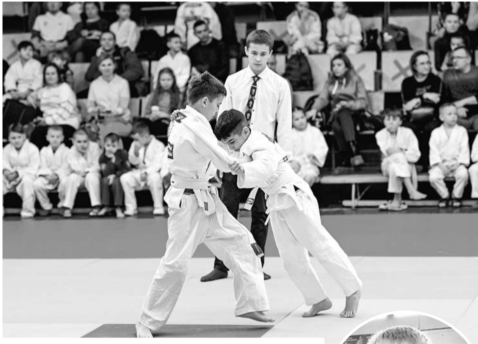
Выполнить зачетный бросок - дело непростое. Схватки на татами продолжались целый день без остановок.

— Некоторые ребята уже очень неплохо подготовлены, обладают достаточно серьезной техникой. Борются по взрослым правилам, чтобы быть морально готовыми к взрослым соревнованиям. С другой стороны, выступают дети, которые занимаются только четыре месяца, для них это первый официальный турнир. Правила? В стойке можно получить «иппон» за хороший бросок на спину, а «вадза-ари», скажем, за бросок на бок. Есть ряд ограничений. В партере дети могут выиграть удержанием, а болевые и удуш-