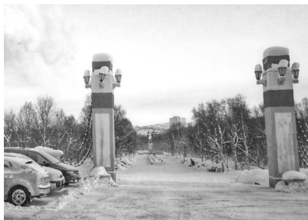
Входная группа городского парка ждет обновления.

ся здесь игровыми видами спорта, кататься на роликах. Спортивная площадка будет снабжена трибунами для зрителей, раздевалками, штраф-