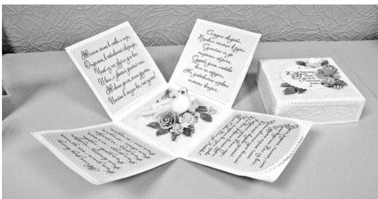
Такая шкатулка сама по себе уже подарок, а ведь в ней есть еще и кармашек для денежного презента.