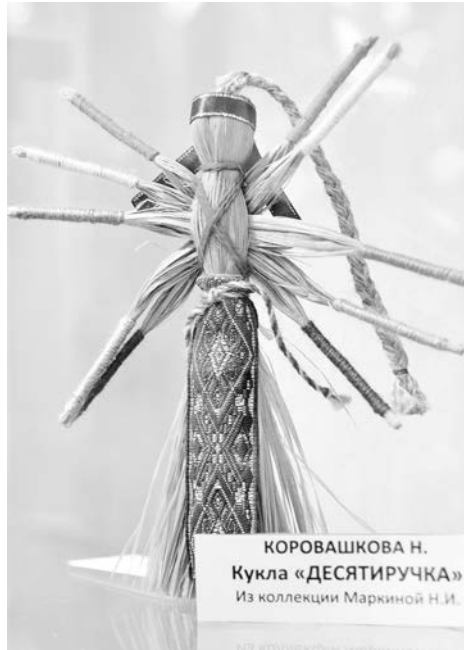
Такая куколка призвана помогать хозяйкам в доме.

В рамках выставки «Лоскутное шитье Заполярья» 29 января в ГДК состоится