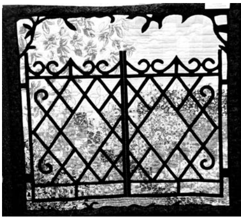
Панно «За калиткой», Татьяна Матвеева, г. Мурманск.

По-американски такой вид рукоделия именуют квилтингом, по-европейски – пэчворком. Названия разные, а суть одна: