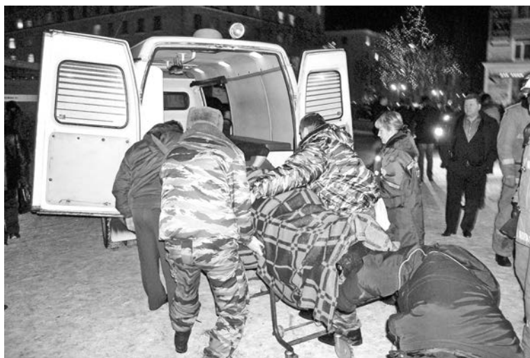
Кареты «скорой помощи» отъезжали от места происшествия с пострадавшими одна за другой.

В среду вечером стало известно, что вторая машина действительно была. Припаркованная на площади «Шкода», за рулем которой находилась женщина, начала сдавать назад в ту самую минуту, когда на мигающий свет светофора ехала «Тойота».