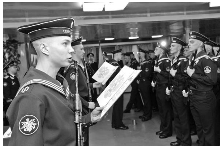
Ночь перед присягой многие ребята провели, заучивая текст клятвы наизусть.