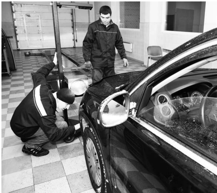
Теперь техосмотр станет более оперативным, но не менее тщательным.

После вступления в силу нового закона инспекторы на дороге перестанут проверять наличие