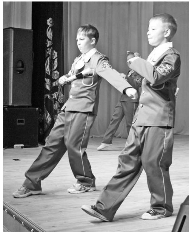
Юные инспекторы из гимназии №1 ПДД могут и рассказать, и спеть, и даже станцевать.