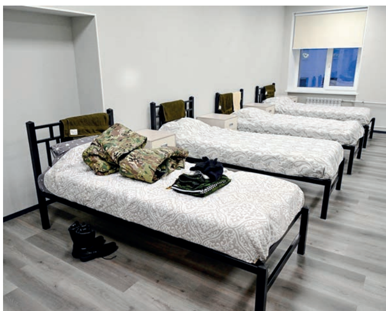
Специально для курсантов «Авангарда» было отремонтировано жилое помещение. Ребята остались довольны.