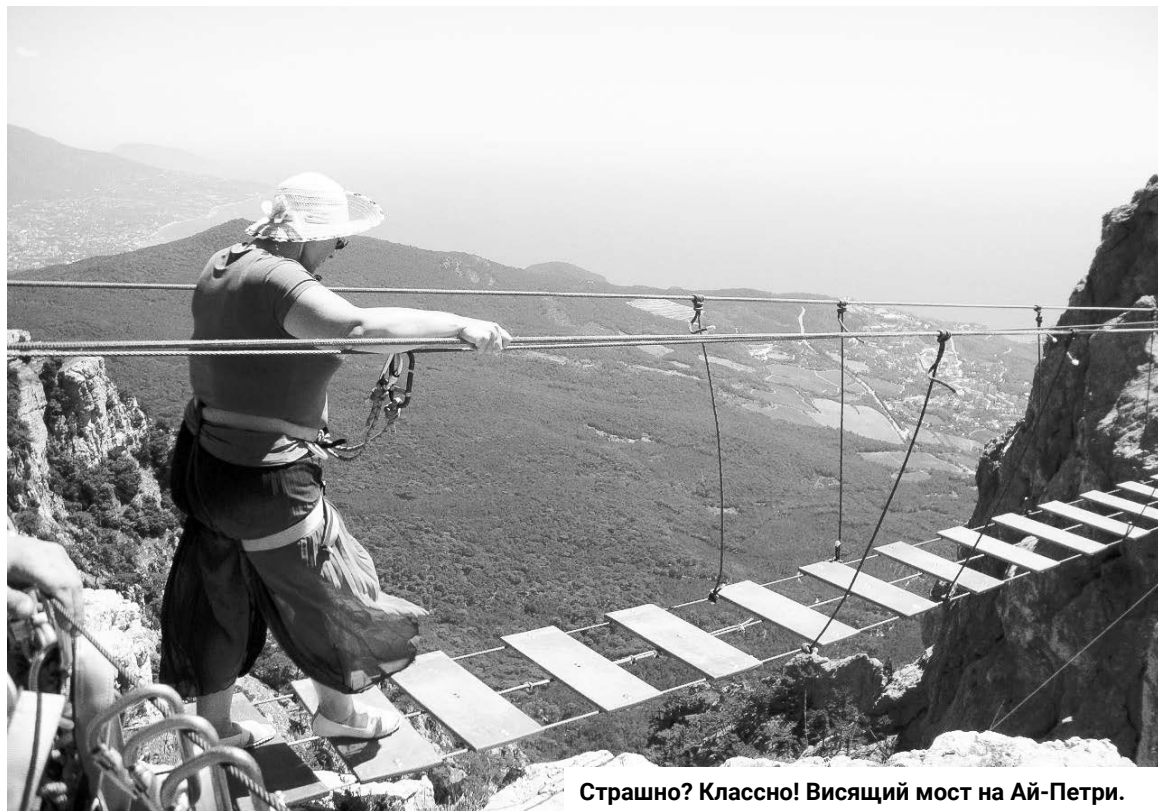
Страшно? Классно! Висящий мост на Ай-Петри.