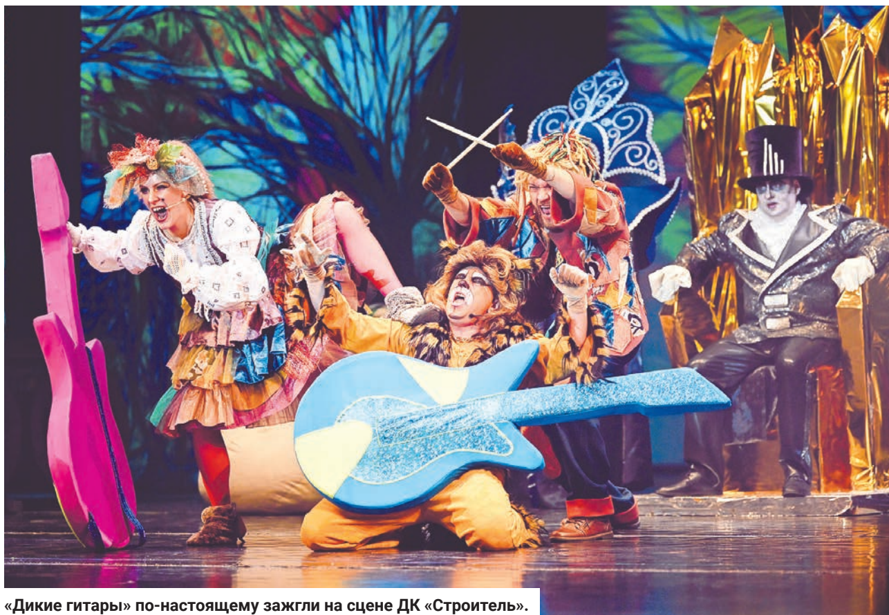
«Дикие гитары» по-настоящему зажгли на сцене ДК «Строитель».

26 декабря коллектив Дворца культуры «Строитель» подарил яркий праздник со спектаклем и сюрпризами одаренным мальчишкам и девчонкам ЗАТО - отличникам, победителям олимпиад и творческих конкурсов, юным дарованиям, добившимся успеха в спорте, творчестве и других областях. Здесь прошла традиционная «Ёлка главы ЗАТО».