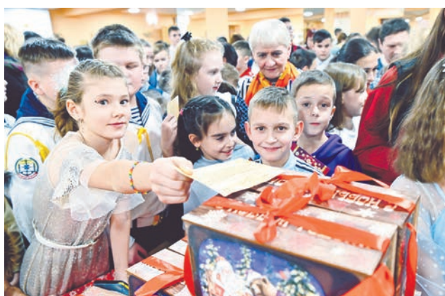
После спектакля ребята не упустили возможность сделать селфи с главой города и конечно, получили подарки.