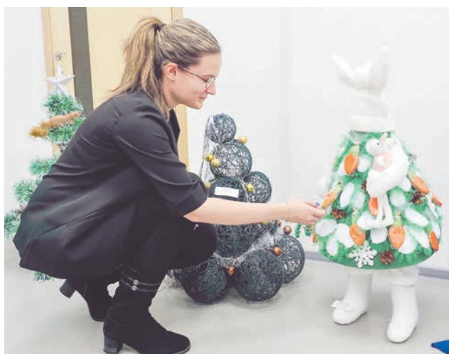
«Зайкина ёлочка» украшена пряниками и морковками.