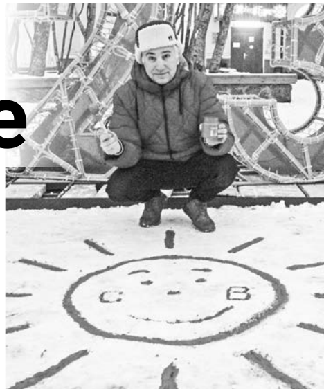
Мы не стали ждать 31 января и нарисовали Солнце заранее, чтобы в полярную ночь стало хоть немного светлее.

Министерство глупой походки и множество разновидностей оной фигурируют в одном британском сериале, в результате его популярности появился на свет Международный день глупой походки, который отмечается 7 января веселым и нелепым шествием. День выпуска газа наступает сразу за