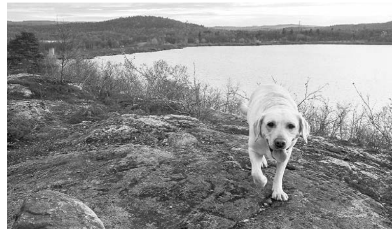
Звезда «Гав-стори» и любимый друг Розабелла.