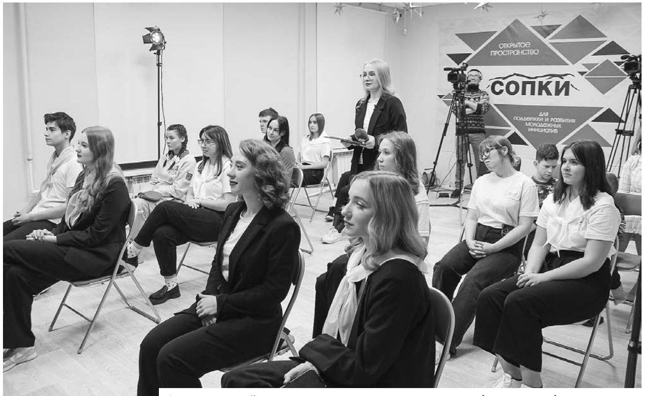
Североморской молодежи есть о чем спросить главу, более часа общения прошли на одном дыхании.

Ну и если продолжить о гордости, то мне, по крайней мере, не стыдно за те работы, которые мы делаем в городе. Я понимаю, что есть еще где приложить усилия и критика в адрес муниципальной власти присутствует. Но в основном она такая: «здесь сделали, а вот там еще нет». И нет критики по тем местам, где работы проведены. Иногда работы по срокам делятся дольше, чем хотелось бы, но во многом потому, что мы стараемся подойти не формально к реализации очередного проекта, а комплексно. И если взятый темп не будет падать, в ближайшей перспективе мы закроем все болезненные вопросы.