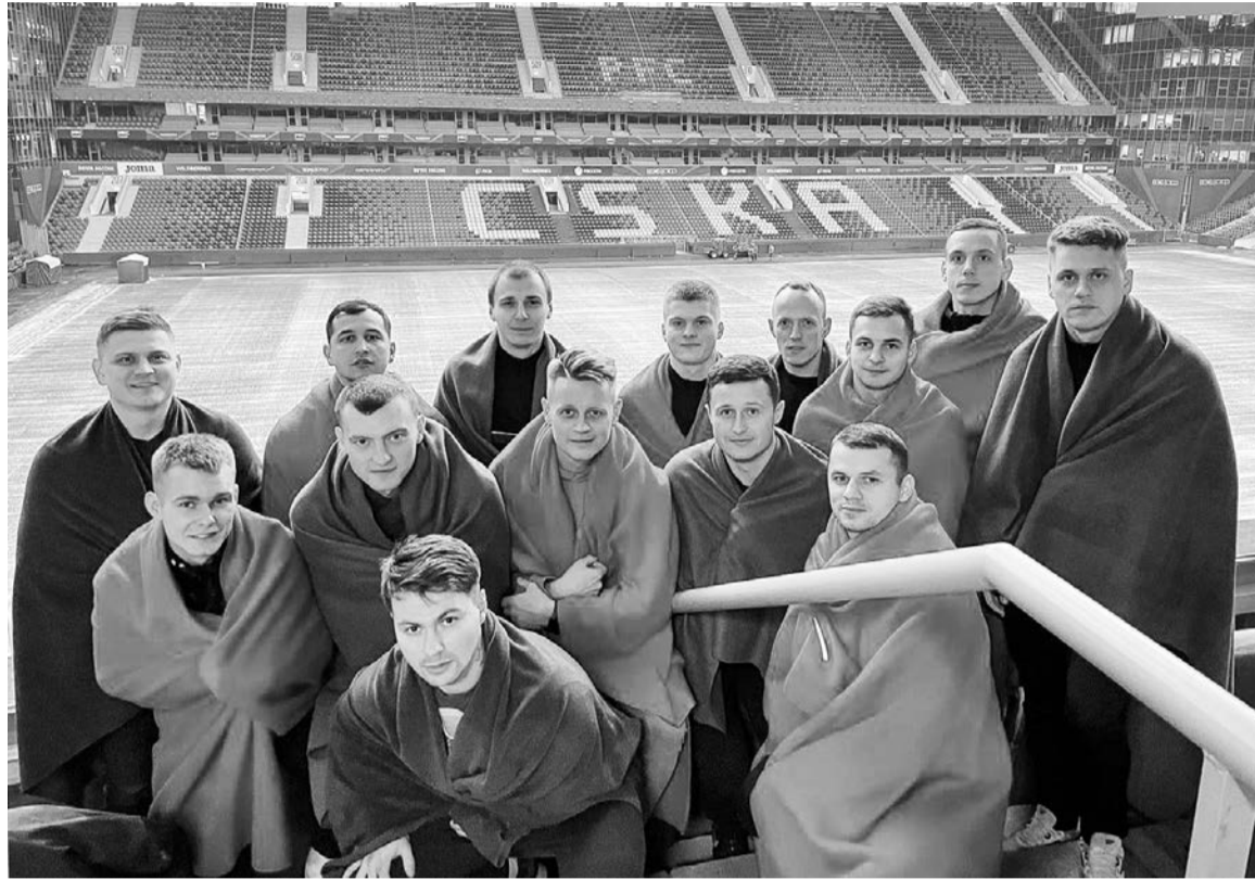
Мини-футболисты Северного флота, облачившись в цвета армейцев — красные и синие пледы, посетили в Москве арену профессионального футбольного клуба ЦСКА.

Непросто поначалу складывался полуфинальный поединок. Уступая после первого тайма сопернику из Южного военного округа 1:2, Северный флот после перерыва