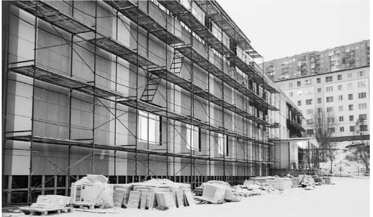
Основные фасадные работы в школе практически завершены, и уже сейчас можно оценить, насколько учреждение преобразилось. Внешне школа выглядит стильно и современно.