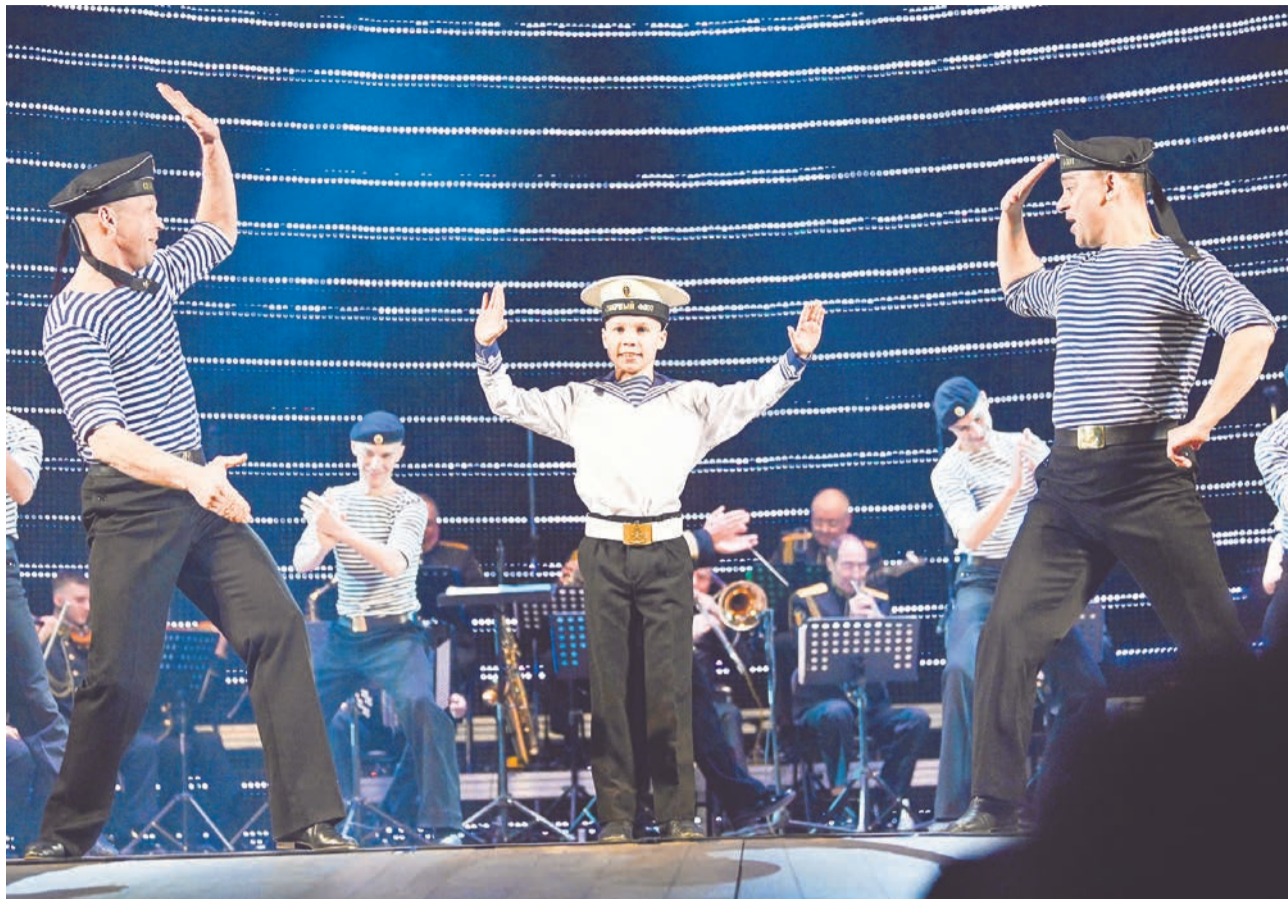
Маленькие артисты органично влились в концертные номера ансамбля и выступили превосходно. Зал аплодировал стоя!