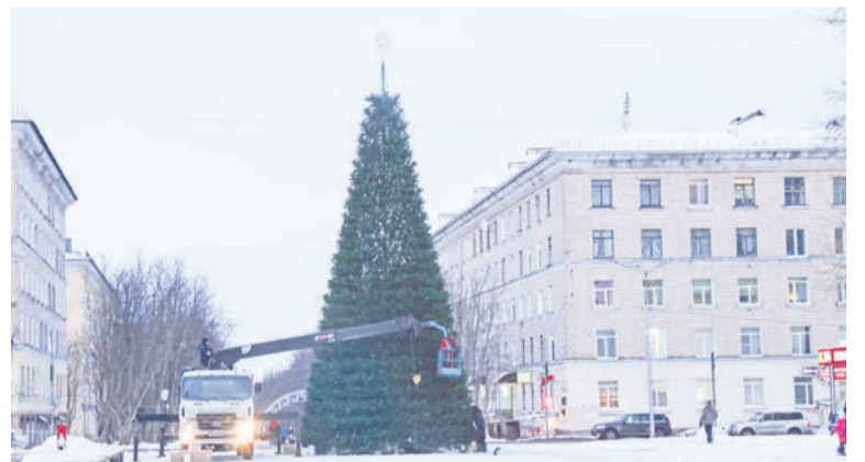
Новая ёлка на ул. Сафонова.

Впрочем, праздничное настроение будет создано не только в центральной части города. К выходным времени в городе и поселках будут установлены четыре деревянные