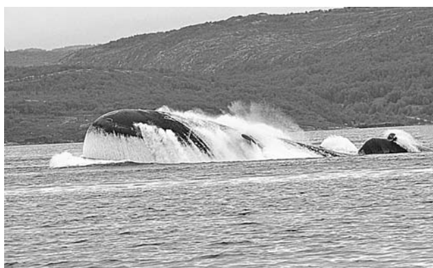
«Прыжок кита» в исполнении АПЛ с экипажем «Полярные Зори».