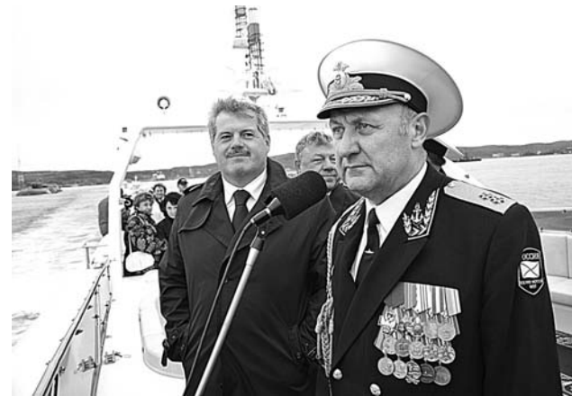
На катере командующий СФ вице-адмирал Николай Максимов, губернатор Дмитрий Дмитриенко, гости и шефы обошли корабли и поздравили экипажи с праздником.