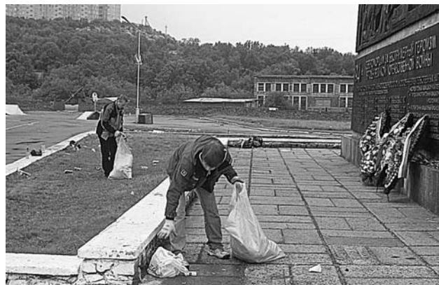
Вместе с работниками «Автодорсервиса» площадь убирала бригада школьников.

Ирина ПАЛАМАРЧУК.