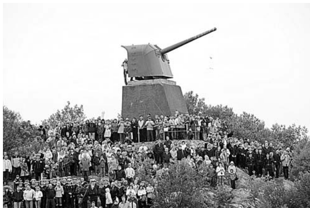
«Зрительные места» на сопках начали занимать еще за час до парада.