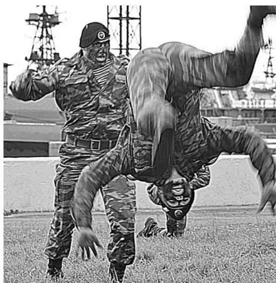
Самая зрелищная часть праздника - высадка и показательный бой морского десанта.