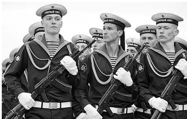
Для матросов участие в таком параде - и испытание, и предмет гордости.