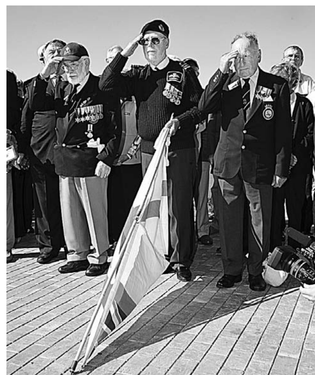
В субботу Мурманск посетили ветераны полярных конвоев из Великобритании, Австралии, Канады и других стран антигитлеровской коалиции. Они приняли участие в митинге памяти погибших в годы Великой Отечественной войны у мемориала Защитникам Заполярья.