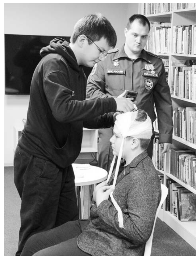
Перевязка должна быть не только быстрой, но и правильно выполненной, за целый ряд ошибок можно было заработать снижение оценки.