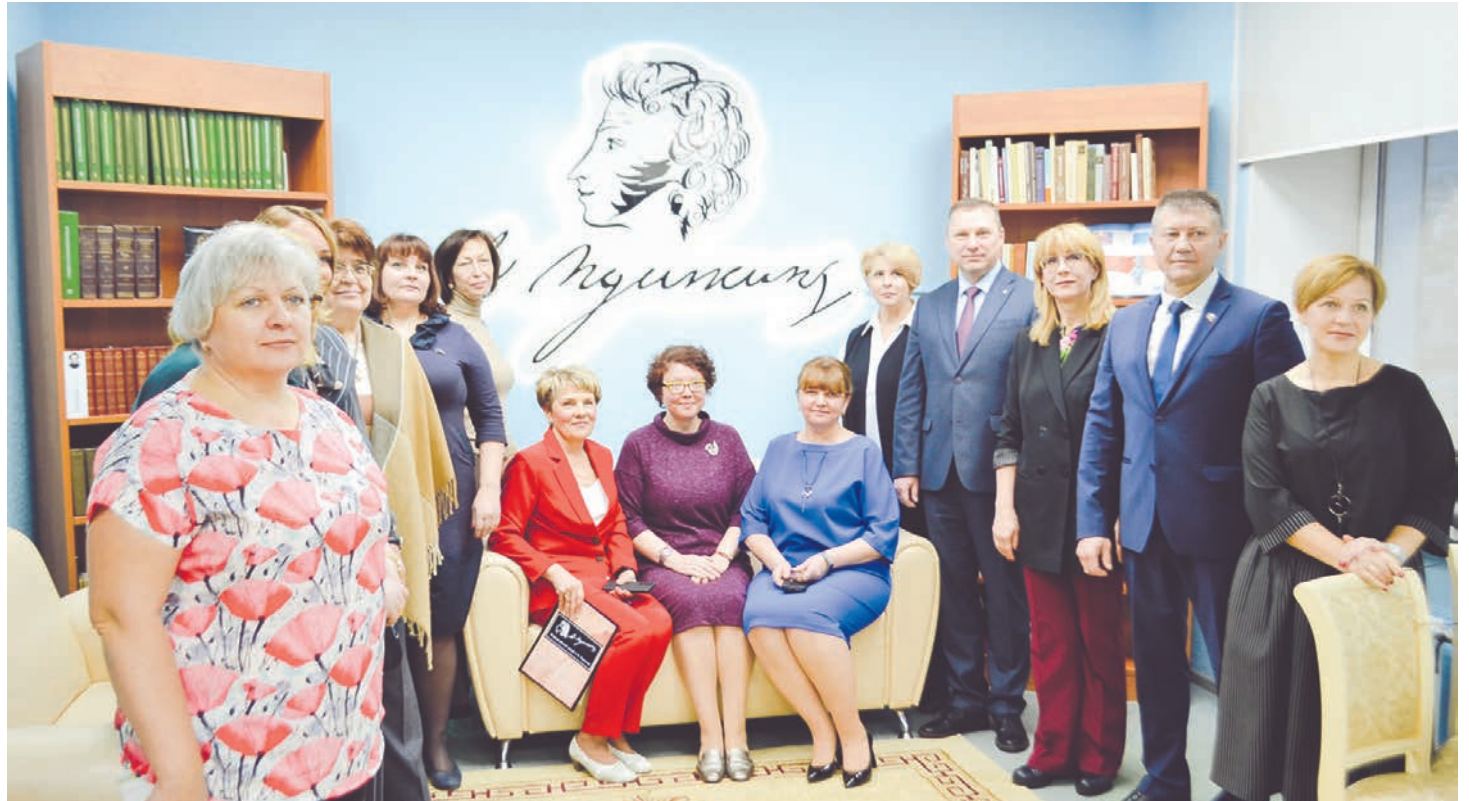
Региональный центр Всероссийского музея А. С. Пушкина в Североморске открыт. Добро пожаловать!

— Открытие регионального центра музея имеет поистине стратегическое значение, интерес к творчеству Пушкина отмечен во всех библиотеках нашей страны, его читают от мала до велика, люди всех социальных слоев и национальностей. Теперь бесценные фонды доступны и североморцам. Один из залов ЦББ, получившей недавно статус модельной библиотеки, был перепрофилирован под так называемый «Пушкинский зал». Здесь теперь будут проходить все мероприятия, связанные с великим поэтом и его современниками. Дизайн был продуман коллективом библиотеки самостоятельно, мы постарались передать атмосферу пушкинской эпохи: книги, статуэтки, костюмы на манекенах, милые штрихи в виде случайно забытого веера,