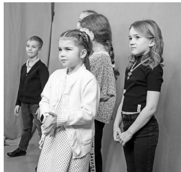
В телестудии участники проекта представили себя в роли ведущих.

Рубрика «Твое время!» выходит на Североморском телеканале шесть дней в неделю. Запись передач можно посмотреть в группе «СТК» «ВКонтакте».