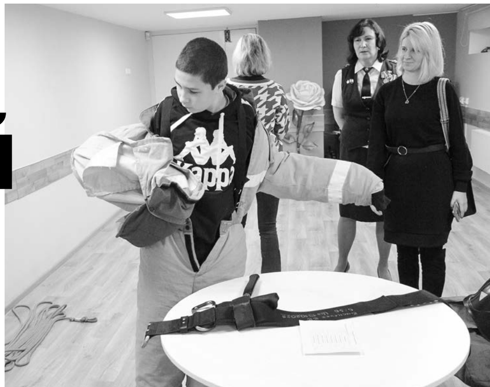
Одно из самых технически сложных и одновременно самых интересных заданий — облачение в боевой костюм пожарного, на него давалась пробная попытка.

— Самое увлекательное — надевать костюм пожарного. А самое трудное,