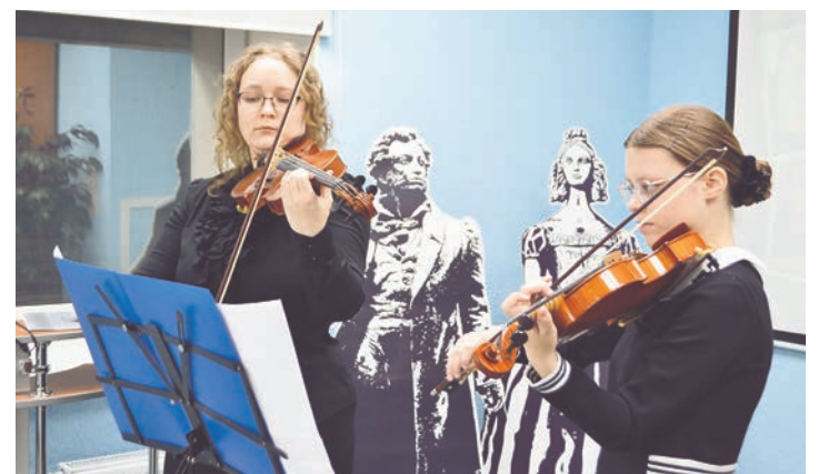
«Старинный романс» Г. Свиридова к к/ф по пьесе Пушкина «Метель» прозвучал в исполнении воспитанников и педагогов ДМШ им. Э. С. Пастернак.