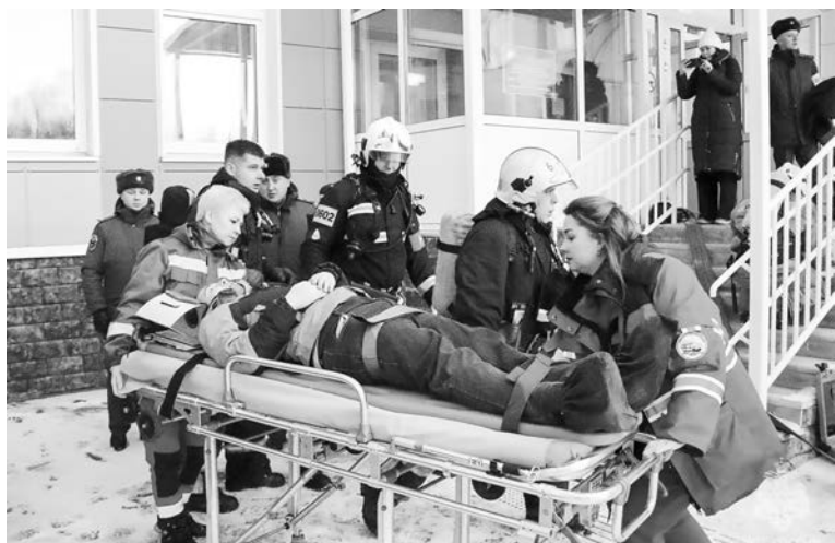
Во время пожарно-тактического учения отрабатываются слаженные действия всех служб, работающих на пожаре.

Пожар в учреждении образования, еще и в рабочее время — всегда большой риск. Поэтому отработке действий при тушении на таких объектах огнеборцы уделяют особое внимание.