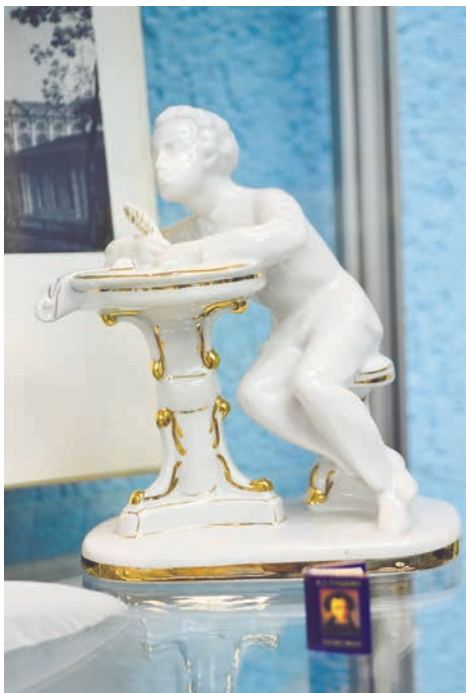
Все предметы экспозиции работают на создание атмосферы пушкинской эпохи.

В Центральной городской библиотеке им. Л. Крейна открылся 23-й в России и первый в Мурманской области региональный центр Всероссийского музея А. С. Пушкина.