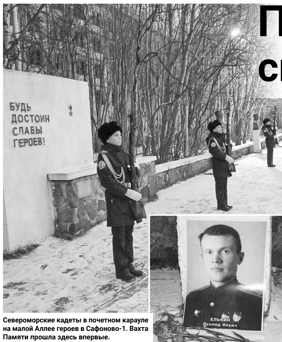
Североморские кадеты в почетном карауле на малой Аллее героев в Сафоново-1. Вахта Памяти прошла здесь впервые.