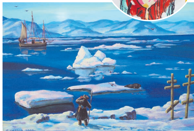
Хотя в работах Сергея Скорова и его внучки мало общего, идея семейного творчества обязательно найдет отклик в сердцах североморцев.