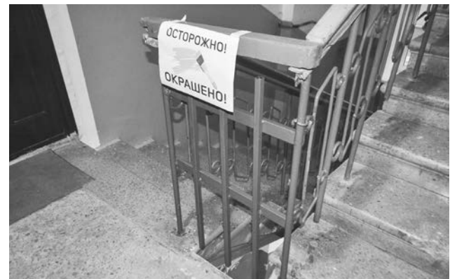
УК «Инвест ЖКХ» восстановила ограждение лестничных пролетов в первом подъезде дома №7 по ул. Сафонова.