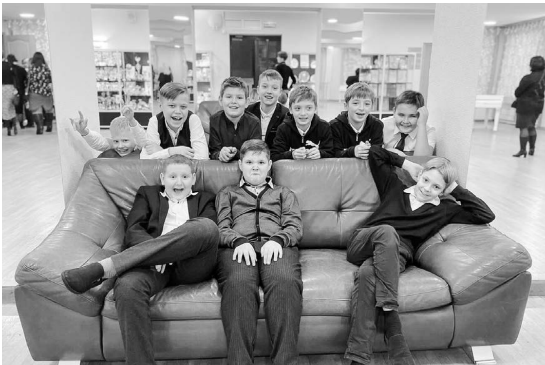
Детская баскетбольная команда «Север-баскет» перед церемонией награждения премией главы ЗАТО Североморск.