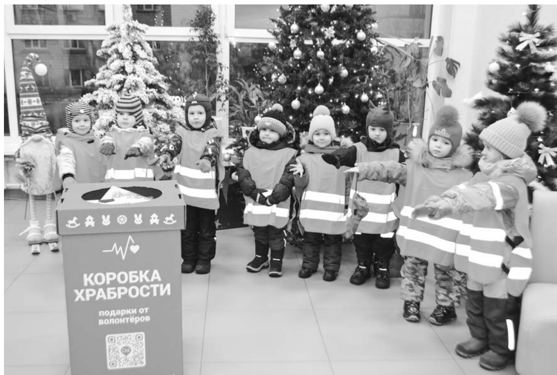
Ребята из группы «Кораблик» детского сада №47 вместе с родителями и воспитателями регулярно участвуют в благотворительных акциях.