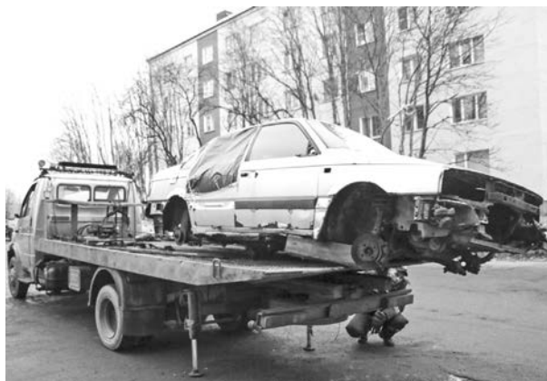
Эвакуация авто с ул. Комсомольской.