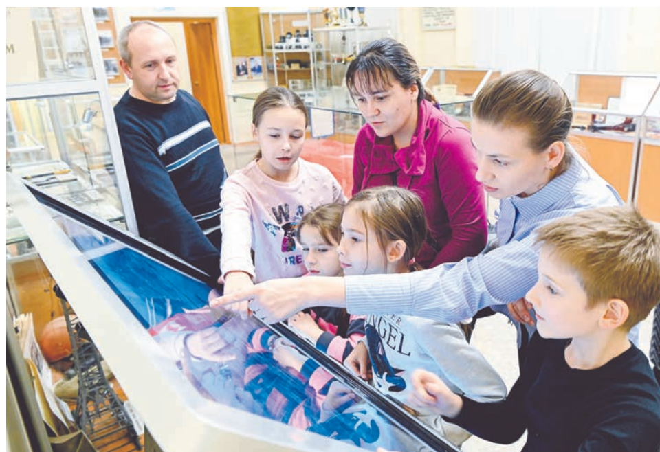
В «Ночь искусств» североморцы курсировали между тремя творческими площадками целыми семьями и дружескими компаниями.