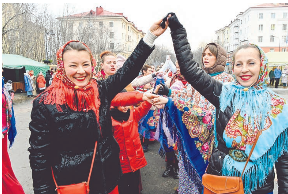
Игра в «ручечек» подарила гостям праздника отличное настроение.