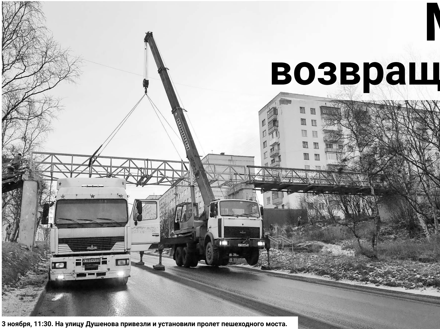
3 ноября, 11:30. На улице Душенова привезли и установили пролет пешеходного моста.