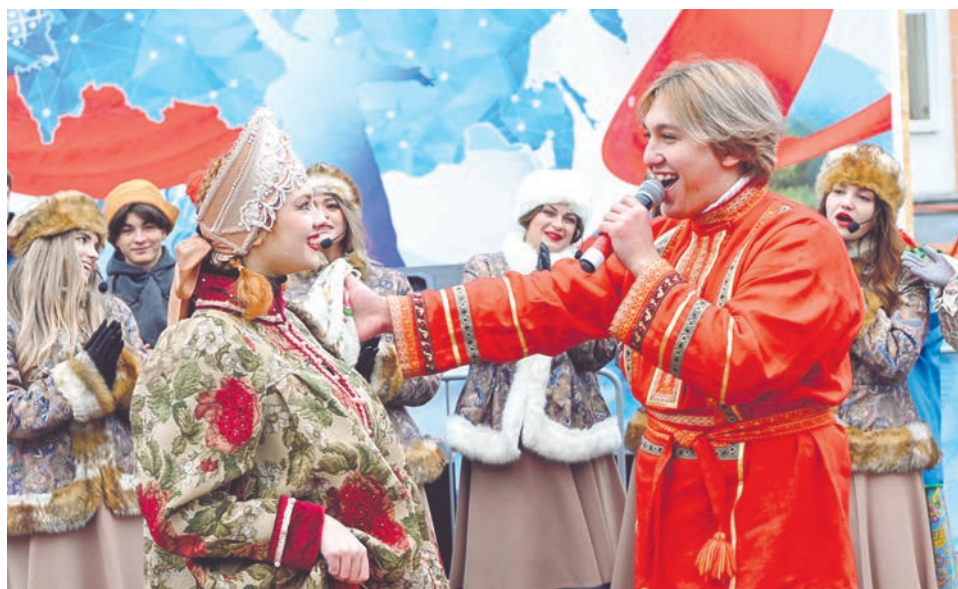
Изюминкой мероприятия стала театрализованная зарисовка «Русская свадьба» в исполнении специалистов ЦДМ.

ли участие все гости мероприятия. В знак мира они надели перчатки-куколки, изготовленные североморцами на мастер-классе и символизировавшие разные национальности.