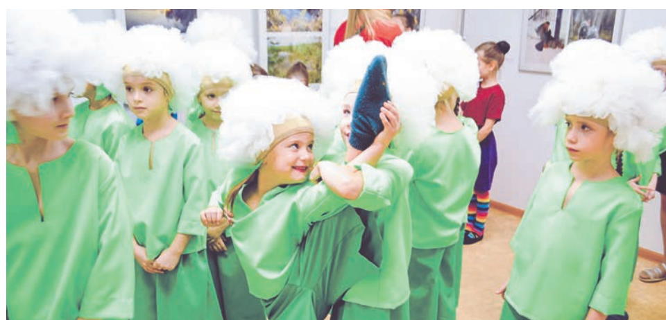
Воспитанники ансамбля современной хореографии «Импровизация» («СеверОК») добавили позитивных эмоций посетителям выставочного зала.