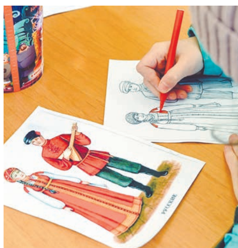
С особым удовольствием дети раскрашивали изображения своего народа.

области, — творческие коллективы и исполнители объединений Дома Дружбы.