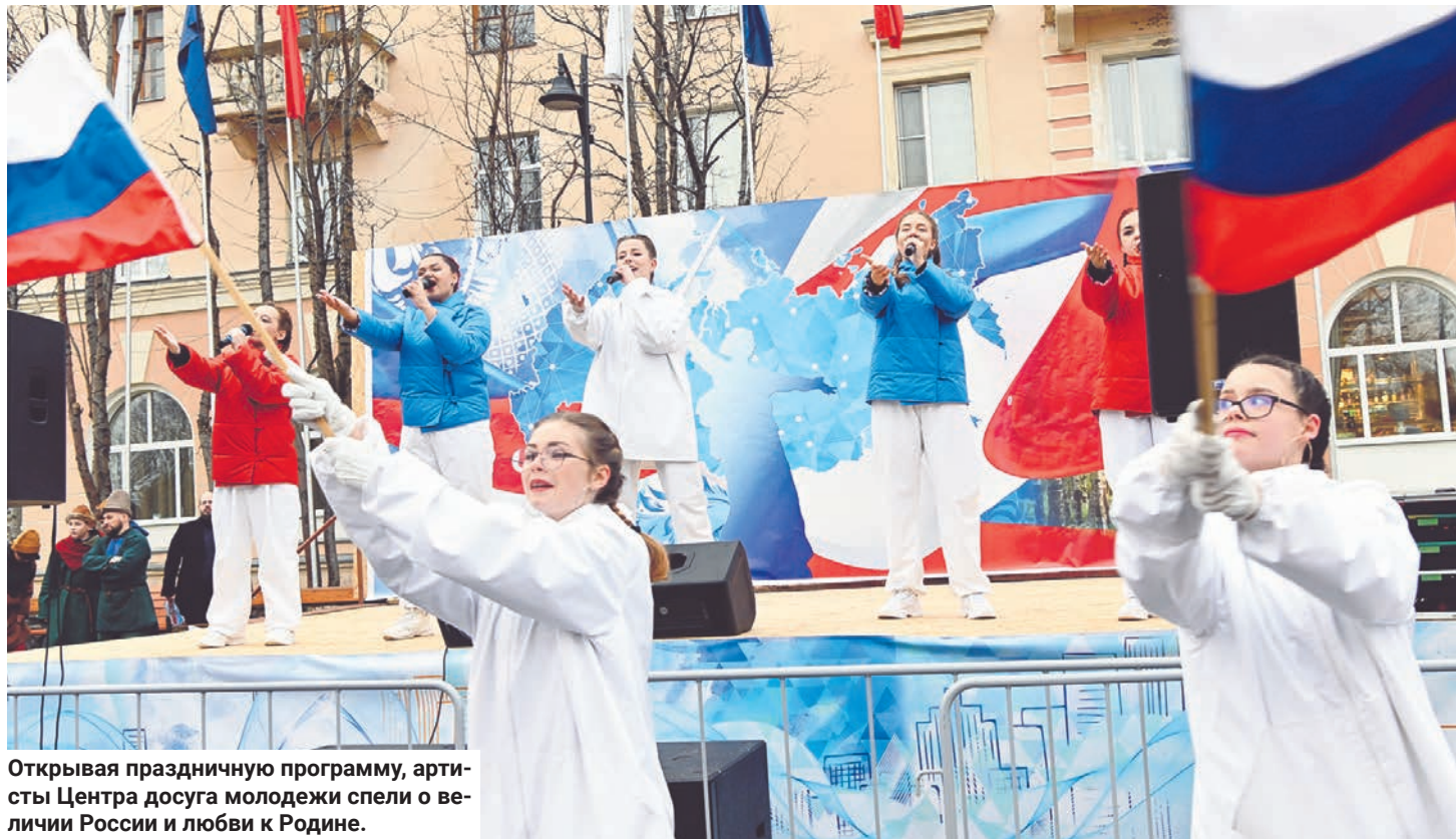
Открывая праздничную программу, артисты Центра досуга молодежи спели о величии России и любви к Родине.

С историей Дня народного единства, народными играми и песнями, элементами свадебного обряда жителей и гостей города познакомили специалисты ЦДМ, а с культурой и традициями народов, проживающих в Мурманской