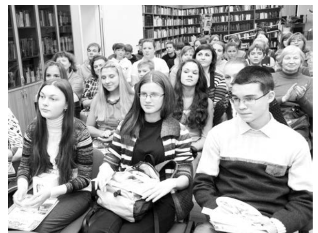
В первых рядах дипломанты первой и второй степени.

- Викторина показалась мне относительно сложной, - поделился впечатлениями