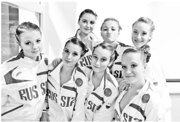
Тренировки, соревнования, занятия в школе - а участницы «Надежды» всегда полны сил и выглядят превосходно.