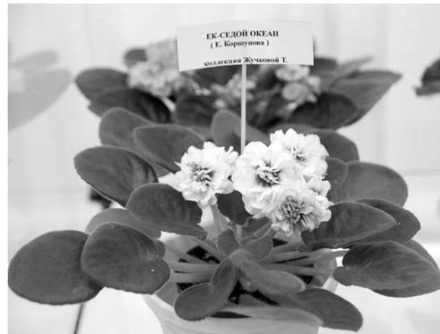
Такую розетку можно вырастить за полгода из единственного листочка.

Клуб коллекционеров «Сенполия», что в переводе с латыни означает «фиалка», существует при музее уже более 10 лет. Его участницы – женщины самых разных профессий. Встречаются среди них и учителя, и военнослужащие. Любимому