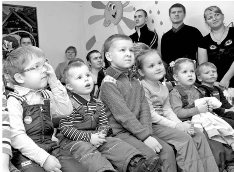
В детской библиотеке малыши могут не только читать, но и играть, мастерить, смотреть мультики и спектакли.