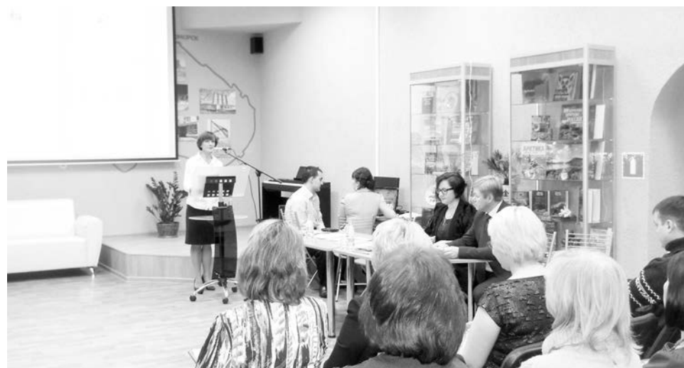
В просторном читальном зале ЦГБ хватило места и гостям, и участникам конференции.