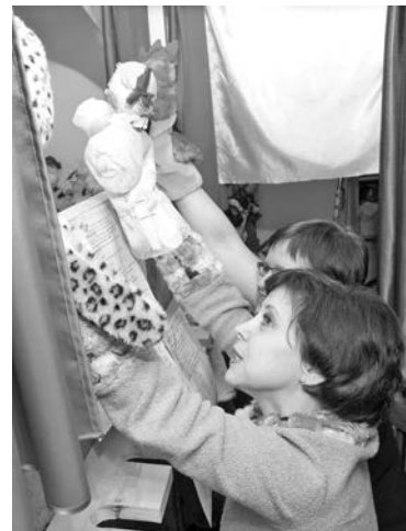
Гостям ЦДБ показали кукольный спектакль.