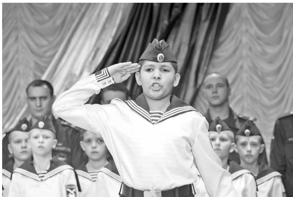
«Клянусь быть честным и верным товарищем, любить свою Родину и быть готовым в любую минуту встать на ее защиту!»

По традиции учениками кадетского класса становятся мальчишки из разных городов нашего региона, окончившие начальную школу. Пятиклассниками они впервые дают клятву свято блюсти честь свою и класса, привыкают к форме и полувойсковому укладу. Стать частью кадетского братства – для них не только высокая награда, но и ответственная миссия. К привычному списку общеобразовательных прибавляются морские дисциплины и основы военной подготовки: история Российской армии и флота, кадетских корпусов, военная топография и военноморская тактика. В образовательной программе для кадетов всегда присутствовали основы спасательного дела. Мальчишки регулярно выходят в море во время шлюпочной практики, погружаются с аквалангом, знают, как правильно действовать при тушении пожара, стреляют из пневматической винтовки и тренируются по программе «Юный спасатель». Именно поэтому осенью 2010 года между школой-интернатом и Специальным управлением Федеральной противопожарной службы №48 МЧС России было