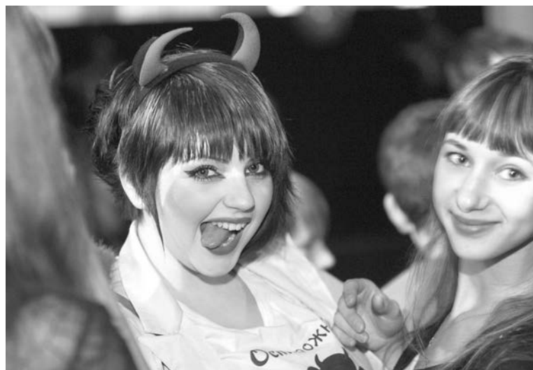
Эта девушка с чертовщинкой на вечеринке затмила многих.

Не было отбоя от желающих обзавестись «пулевым ранением» или «окровавленным рубцом» у мастера боди-арта из коллектива «Ifrit». Из-под кисти подростки выходили бледными, изрядно подурневшими, но очень довольными. Наряду с другими номерами световое шоу этого же коллекти-