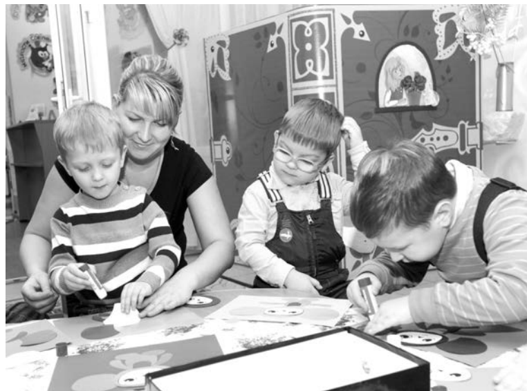
Пока родители знакомились с возможностями библиотеки, дети клеили Чебурашку в творческой мастерской.