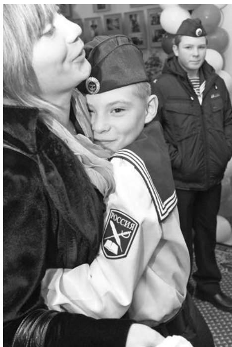
После маминых объятий в новую жизнь шагать уже не страшно.

2012 год стал годом юбилейного – десятого – набора в кадетские классы общеобразовательной школы-интерната. Напутствия и подарки, слезы мам и гордость