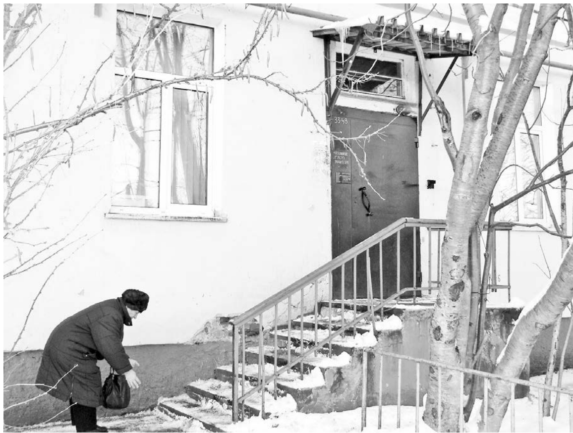
Лидия Абубакарова в красках рассказывает о своих злоключениях на крыльце.

Разработать проект, соблюсти все технические условия, произвести согласования с газовой службой (над окнами первого этажа проходит газовая труба –