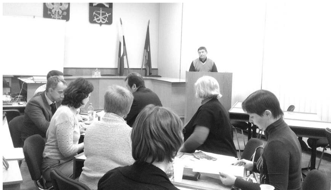
Областная комиссия по государственной поддержке малого и среднего предпринимательства с начала года уже распределила 15 стартовых грантов на общую сумму более 4,5 млн. рублей.