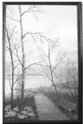
А.Герасенко, «Время для размышлений».

Елена ЗАХАРОВА.