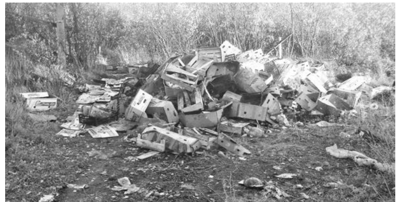
Свалка за СШ №9 не единственная в Авиагородке. Еще одна – более крупная – на ул.Гвардейской.

Ирина ПАЛАМАРЧУК.