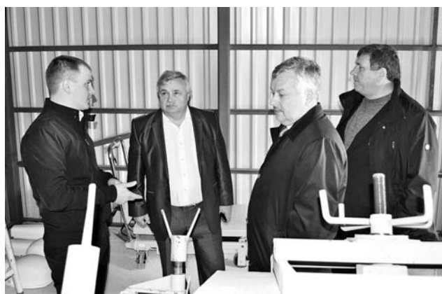
Руководители города посетят пост контроля еще раз, когда он начнет свою работу.

В Североморске завершается возведение уникального для Мурманской области поста контроля опасных отходов. На месте, где раньше находилась городская свалка, вырос современный комплекс. Сюда будут свозиться отходы разного происхождения со всего ЗАТО.