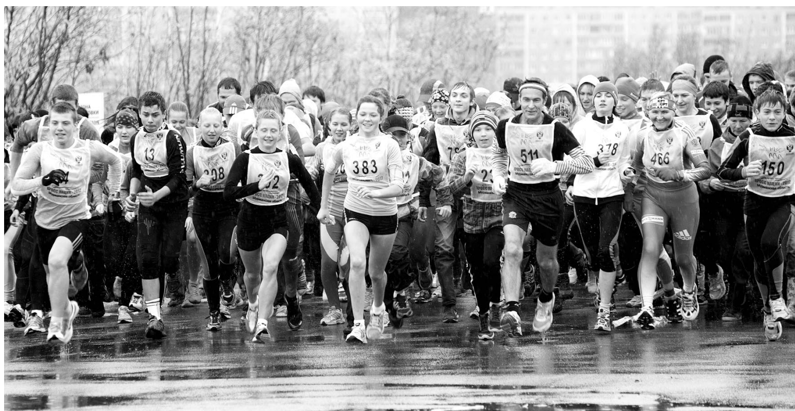
Старты кросса нации по популярности приближаются к другому массовому мероприятию - «Лыжне России».