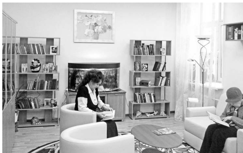
Зеленая гостиная создана специально для чтения в спокойной обстановке.

В библиотеке установлена система внутреннего и внешнего видеонаблюдения, сложное климатическое оборудование, поддерживающее комфортную для