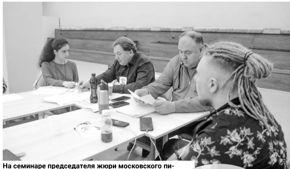
На семинаре председателя жюри московского писателя Алексея Витакова.

Все подробности о фестивале можно узнать на страничке «Капитана Грэя»: https://vk.com/kapitan.grey . 16+