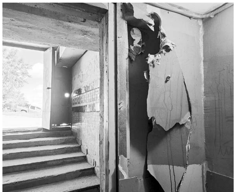
Свет погас не только в подземном переходе, но и в головах некоторых граждан. Иначе как объяснить их темные дела?

Теперь о подземных переходах. Объект на Северной Заставе перешел в оперативное управление ГЦ ЖКХ недавно. Напомним, в мае, когда из перехода ушли предприниматели, он стал подвергаться постоянным нападениям вандалов. Это стало причиной того, что в итоге центральную часть перехода отгородили. Но вандалы не успокоились. ГЦ ЖКХ уже трижды восстанавливал там электричество, однако сейчас освещение вновь сломано. Его опять восстановят, но, как сказано выше, в свою очередь. Такая же ситуация и в переходе на ул. Кирова. Светильники там меня-