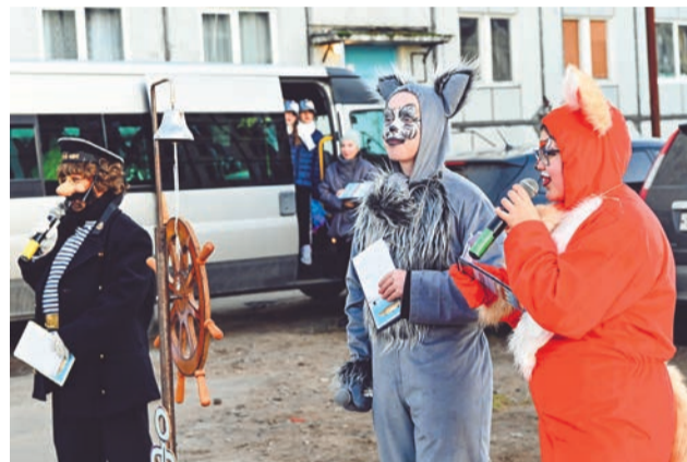
Гостей праздника развлекали Боцман Бывалый, Кот и Лиса.