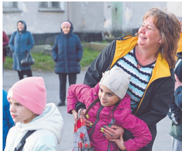
В подвижных играх участвовали дети и взрослые.