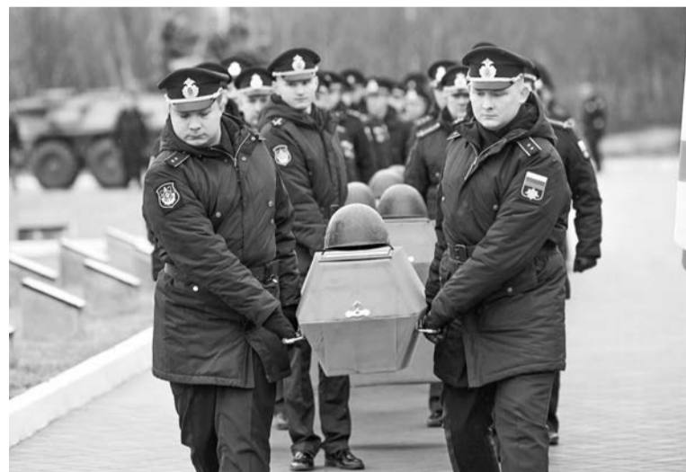
Захоронения в Долине Славы проходят ежегодно. И речи о том, что эта работа движется к завершению, пока не идет.