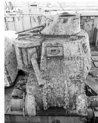
Танк «М3 Lee» планируют реставрировать.

В конце прошлой недели киллекторное судно аварийно-спасательного отряда Северного флота «КИЛ-143» доставило в Североморск американский средний танк «М3 Lee».