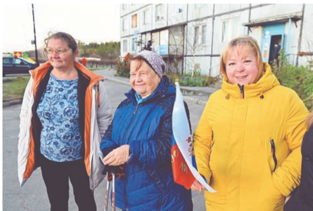
Жители Щукозера пришли на юбилей с хорошим настроением.