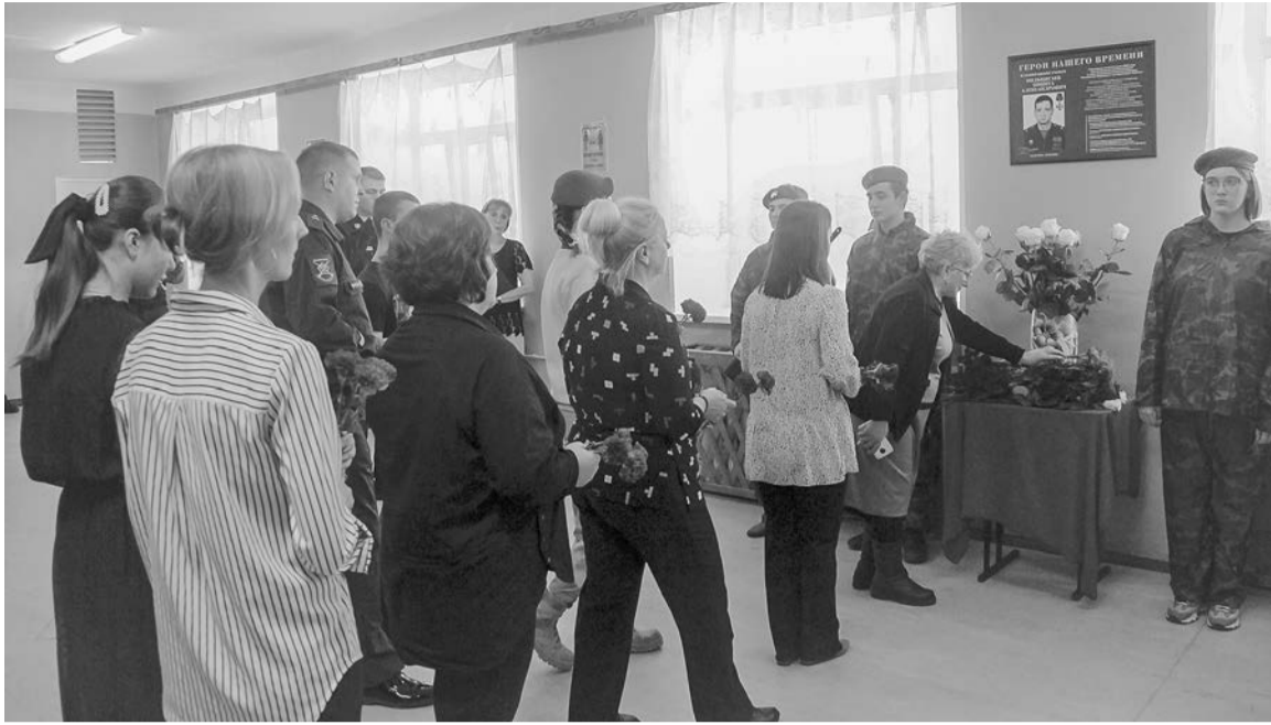
Торжественная церемония открытия памятной доски в школе №5 завершилась возложением цветов.