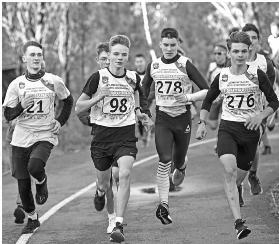
Во время стартов на Аллее спорта шла упорная борьба. Особенно азартно соревновались юноши.

В Североморске продолжается серия встреч для молодежи с лидерами Всероссийского движения «Вдохновители».