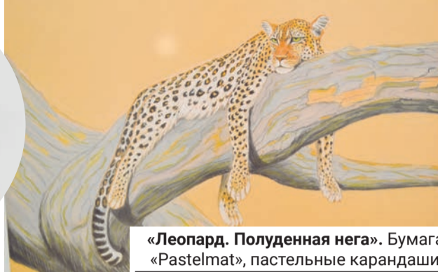
«Леопард. Полуденная нега». Бумага «Pastelmat», пастельные карандаши.

ев. Даже профессию девушка выбрала близкую к миру природы — окончила Севастопольский национальный университет ядерной энергии и промышленности по специ-