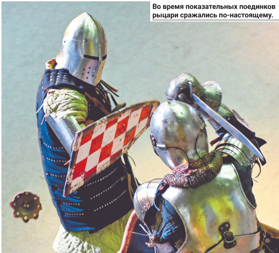
Во время показательных поединков рыцари сражались по-настоящему.

это в том числе хобби. Наш коллектив занимается не только ранним Средневековьем, но и другими эпохами.