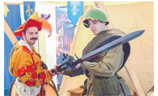
На фестивале прошлое соседствовало с будущим.

цы мастерской исторического костюма «Светлица».