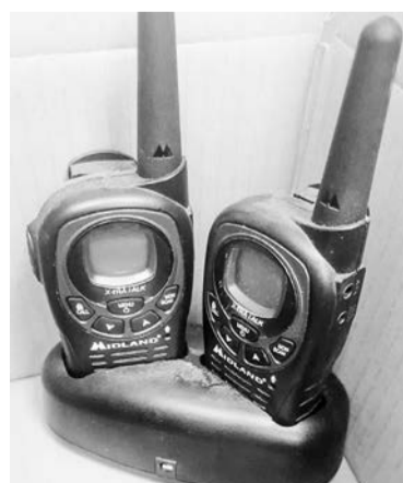
Североморцы помогают деньгами или самостоятельно закупать необходимые вещи.