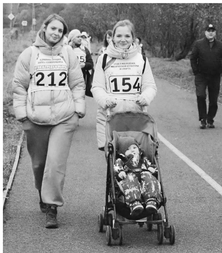
Прогулка на свежем воздухе помогает укрепить иммунитет, поднять настроение и обеспечивает здоровый сон.