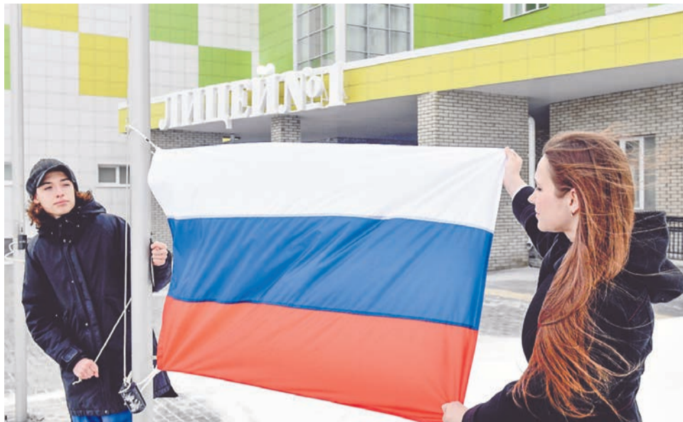
Традиция каждый понедельник поднимать на торжественной линейке флаг России в нашем регионе началась с лицей. Впервые здесь подняли флаг 25 апреля.