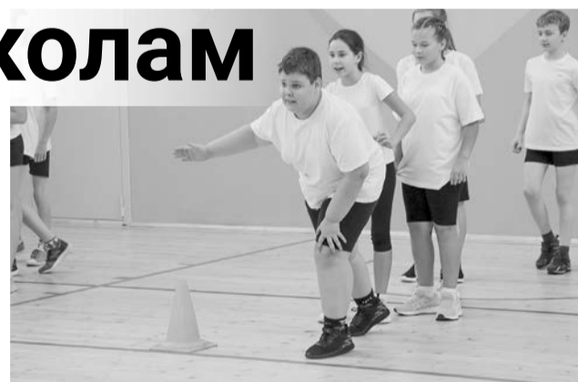
В старом корпусе лицея №1 на ул. Гвардейской дети с радостью занимаются в обновленном спортзале.

В ходе объезда его участники также обсудили возможность обновления отдельных школьных пространств в рамках региональной программы Arctic Schools. Что это будет — спортивный зал, столовая или учебный кабинет — педагоги будут решать вместе с уче-