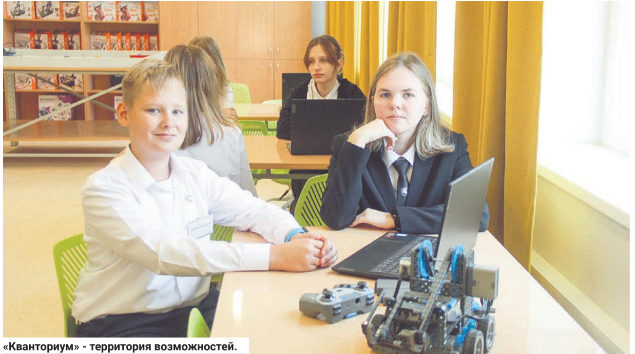
«Кванториум» - территория возможностей.