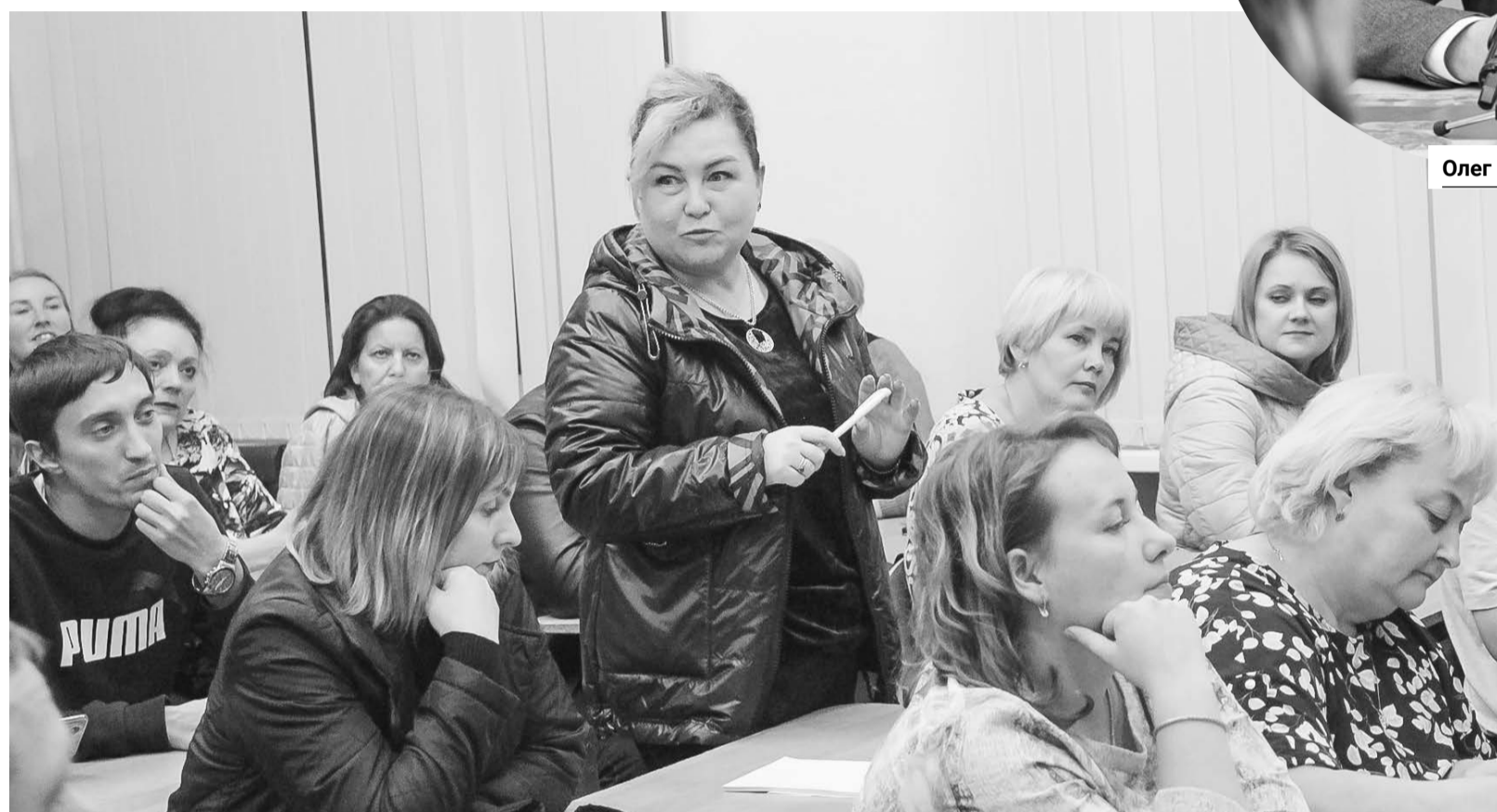
Жители поселка Сафоново приняли активное участие в голосовании за выбор объекта благоустройства, в результате в будущем году будет реконструирована детская площадка «Городок сказок».