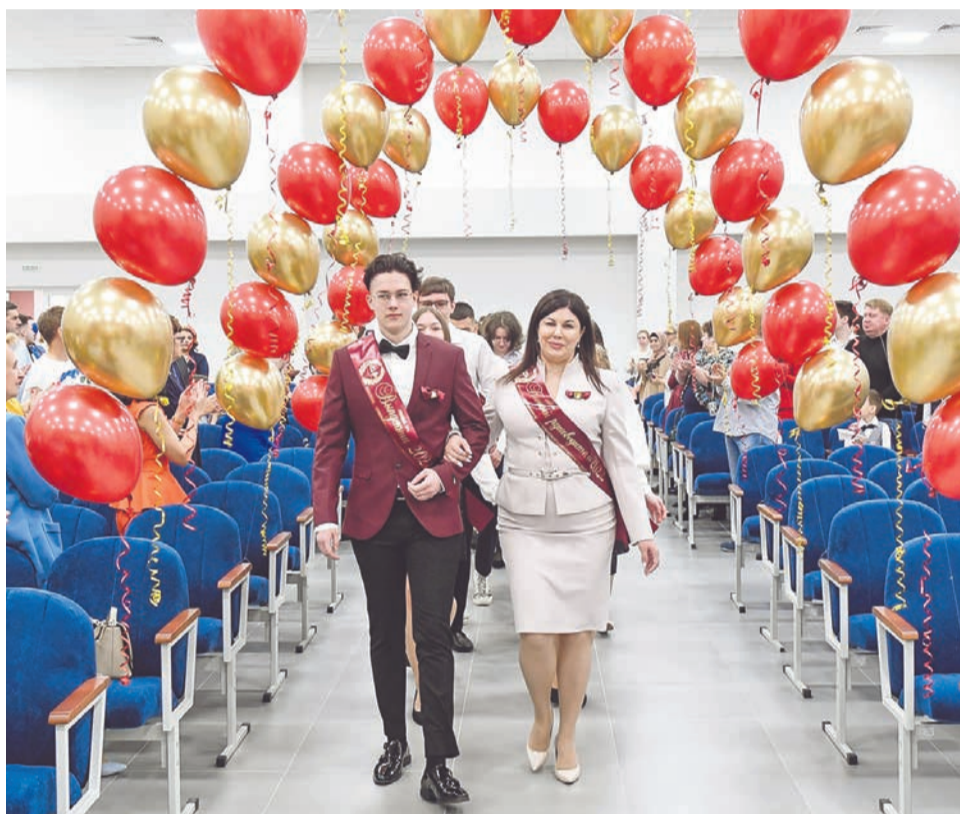
Выпускники-2022 - самые первые! С них началась летопись лицей.

вивают пространственное и креативное мышление. А уже старшие учащиеся осваивают моделирование на компьютере, — пояснил Вадим Чаенко.