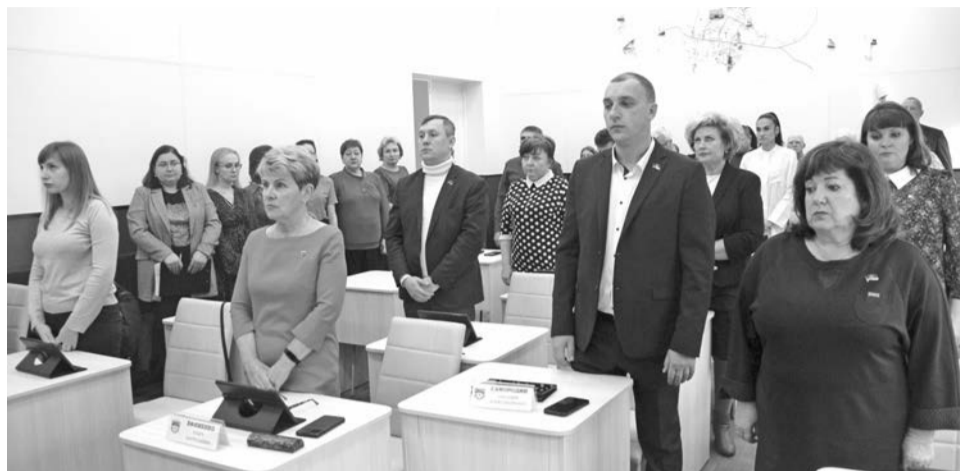
Заседание городского Совета депутатов предварилось минутой молчания в память о погибших накануне в ижевской школе согражданах.

Благодарственные письма Совета депутатов ЗАТО Североморск были вручены воспитателю «Североморской