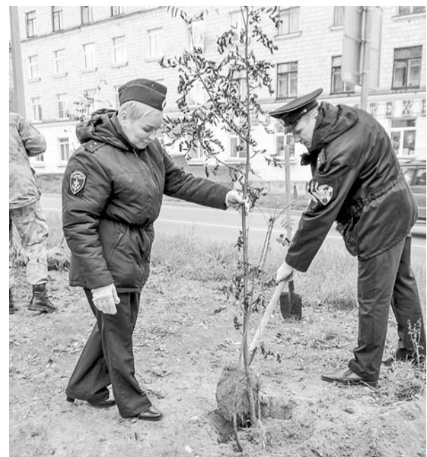
Сотрудники Росгвардии всегда среди активных участников городских акций.