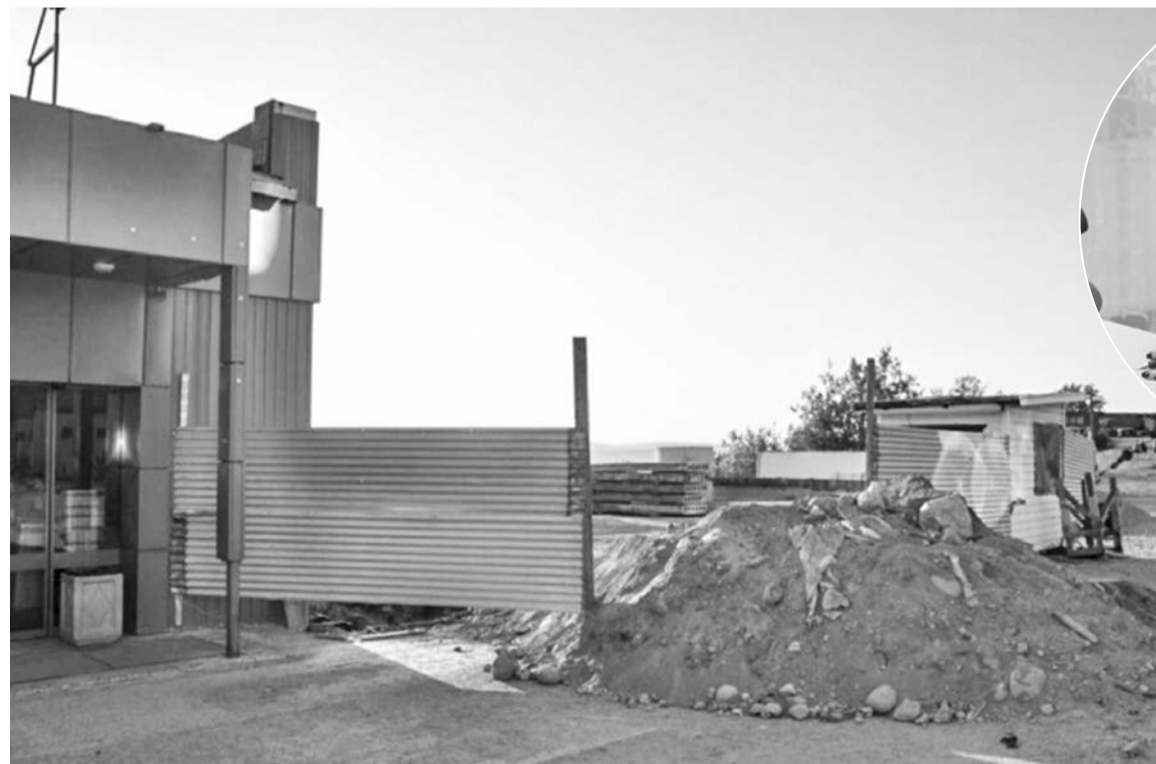
Строительные работы на ул. Полярной индивидуальный предприниматель Святослав Мордасов обещает завершить к ноябрю.

— В настоящее время на земельном участке ведутся работы по реконструкции здания, которые предусматривают возведение пристройки к магазину в границах земельного участка. Разрешение выдано до 22 ноября 2022 года. И к этому момен-