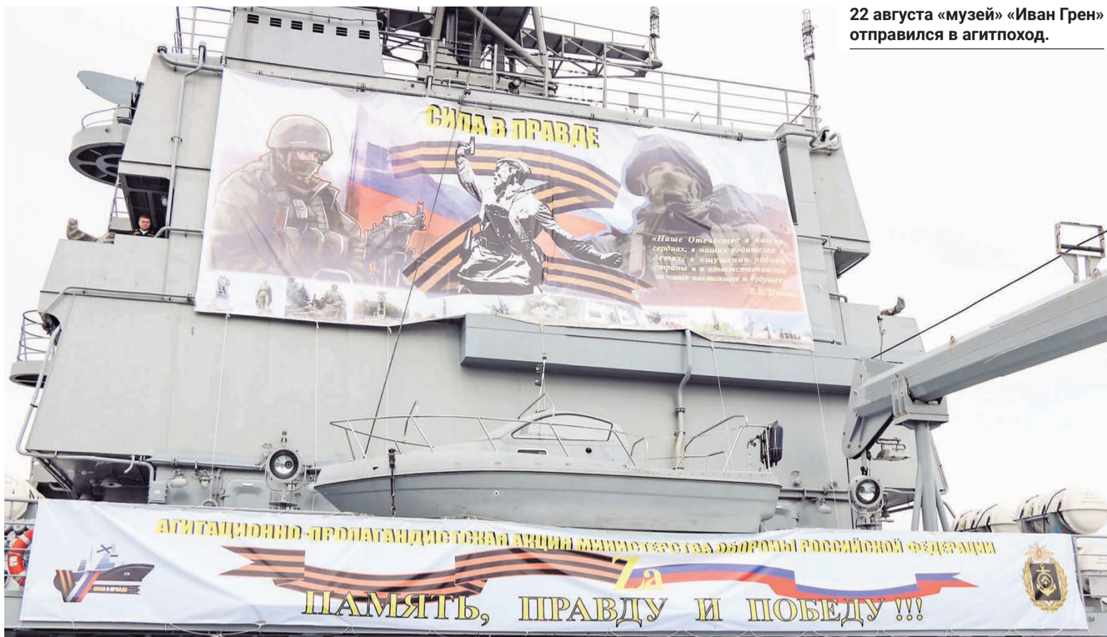
22 августа «музей» «Иван Грен» отправился в агитпоход.