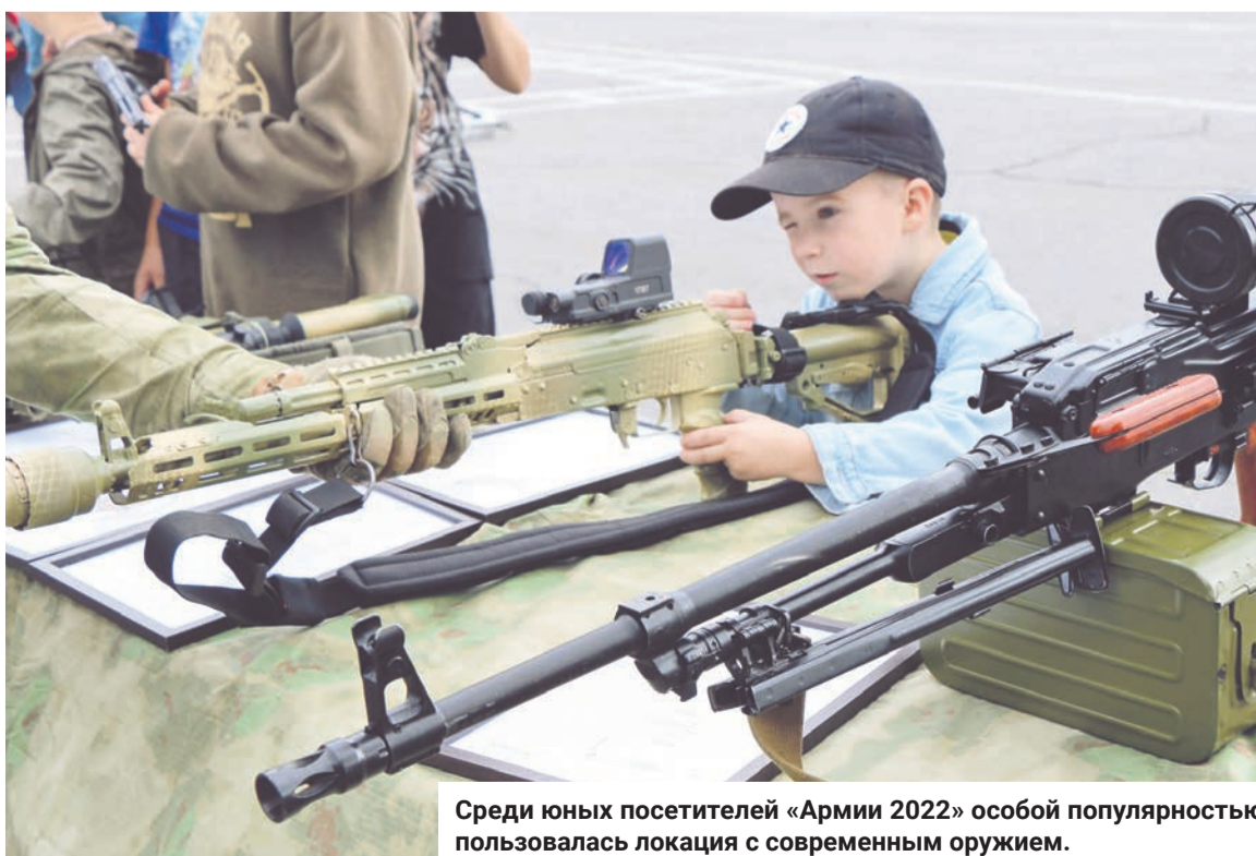
Среди юных посетителей «Армии 2022» особой популярностью пользовалась локация с современным оружием.

Одной из особенностей этого военно-технического форума стала акция, организованная по инициативе Министерства обороны и Северного флота «Сила в правде». Большой десантный корабль «Иван Грен» на время превратился в плавучую выставку, музей. И вдвойне приятно, что первыми ее оценили жители флотской столицы. Все желающие могли ознакомиться с историей Северного флота и уникальными артефактами периода Великой Отечественной войны в Заполярье, с современным вооружением береговых войск, надводных кораблей и подводных лодок ВМФ России, узнать о подвигах российских военнослужащих, принимающих участие в специальной военной операции на Донбассе и Украине, увидеть военные трофеи. Музыканты военного оркестра и Ансамбля песни и пляски Северного флота исполнили для посетителей корабля известные композиции и патриотические произведения.