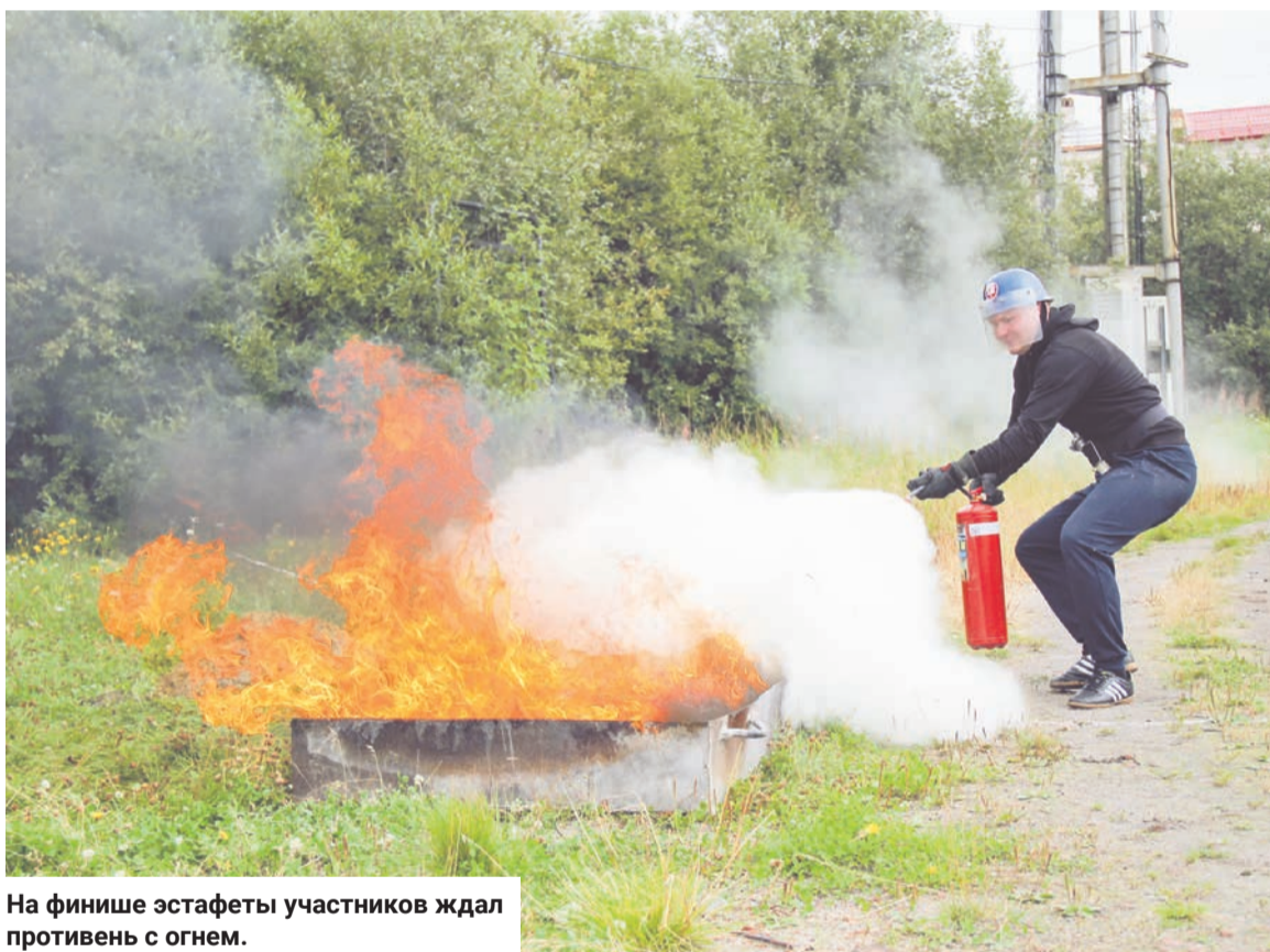
На финише эстафеты участников ждал противень с огнем.