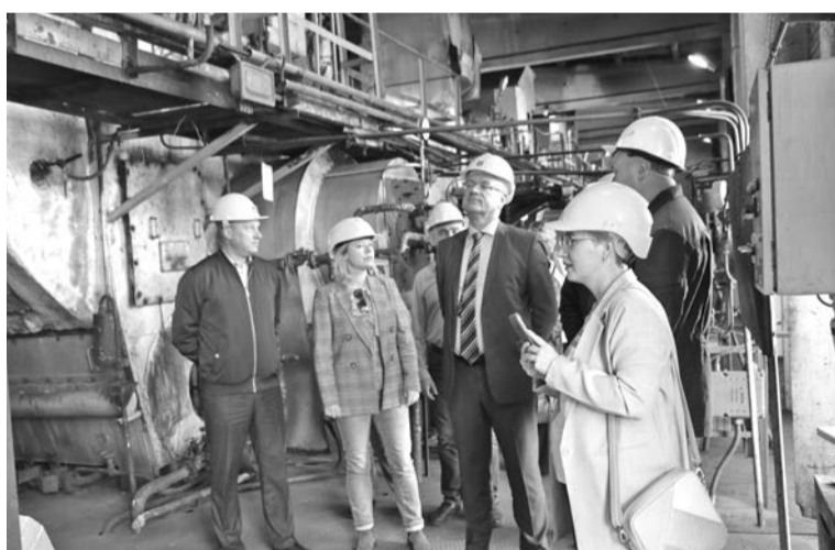
На 46 ТЦ участники выездной проверки в том числе проинспектировали ход работ по замене резервных котлов.

несколько дней позже, чем планировалось изначально, — пояснил глава ЗАТО Олег Прасов.