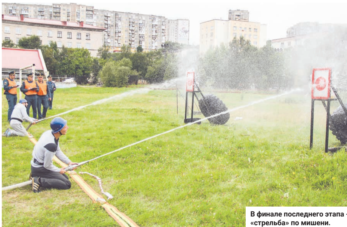
В финале последнего этапа - «стрельба» по мишени.