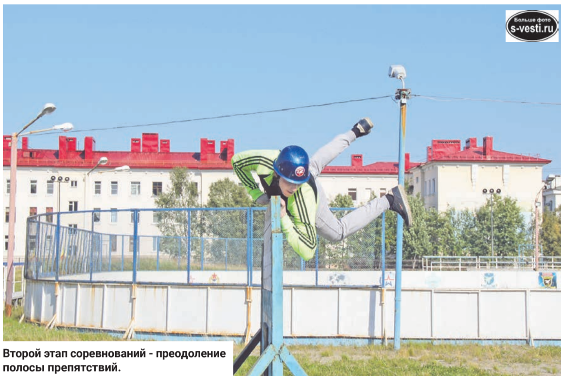
Второй этап соревнований - преодоление полосы препятствий.