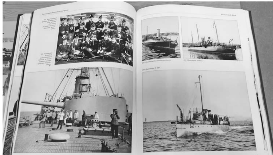
На выставке можно ознакомиться и с обычными книгами. Североморцев заинтересует такой богатый иллюстрированный фолиант, как «Русский императорский флот в фотографиях конца XIX - начала XX века».

Экспозиция проходит при поддержке Министерства культуры региона, а также церковных властей. На открытии выступил епископ Северноморский и Умбский Тарасий: