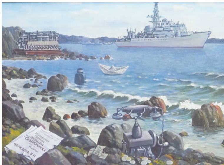
Иван Ворон. Возвращение домой. 2017.