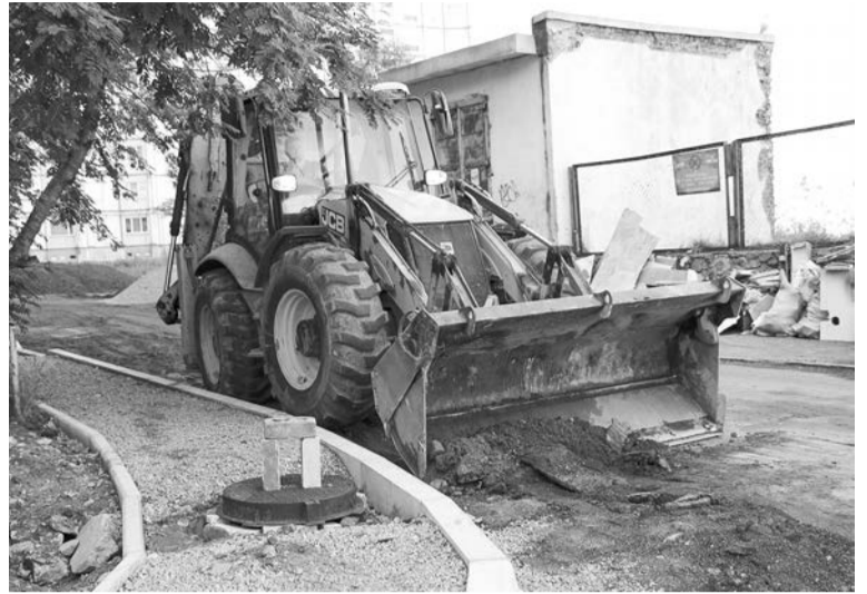
В рамках ФКГС подрядчик уже традиционно максимально расширяет проезжую часть и увеличивает количество парковочных мест.