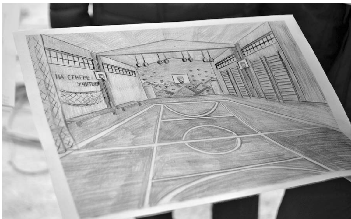
Одно из обязательных условий программы - участие школьников в разработке проекта. На фото - карандашный рисунок обновленного спортзала, выполненный учениками лицея №1.

В рамках реализации проекта в 2022 году в общеобразовательных организациях будут преобразованы 13 спортивных школьных пространств, 11 школьных столовых, 19 общественных пространств