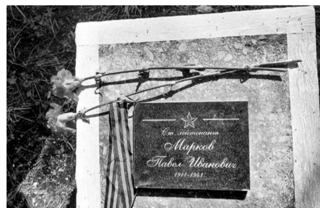
Новую табличку на обелиске постарались сделать максимально похожей на ту, что была здесь установлена в 70-х годах.