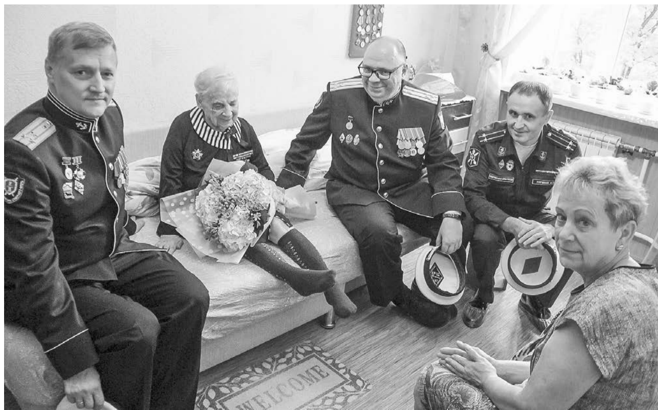
Сотрудники военной прокуратуры Северного флота в гостях у прославленной морячки.