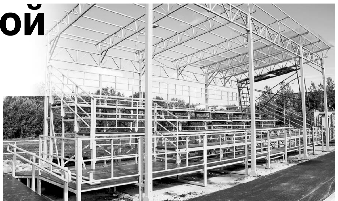
Матч состоится в любую погоду: трибуна под крышей даст возможность наблюдать за спортивными баталиями с комфортом.

Эта новая спортивная площадка станет едва ли не самой большой в муниципалитете, ввод ее в строй с нетерпением ждут жители поселка. Также стоит отметить, что вдоль всего спорткомплекса проложены дренажные системы для стока вод, установлены 10 опор освещения со светодиодными светильниками.