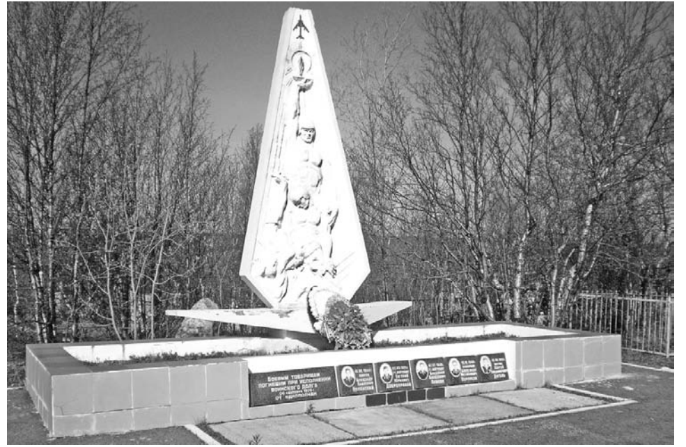
Памятник авиаторам, погибшим при исполнении воинского долга.