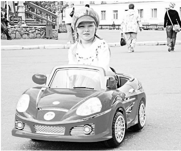
Такой автомобиль тоже нельзя оставлять на улице.