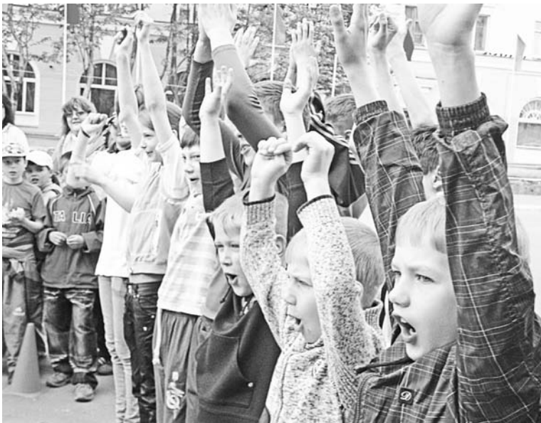
«Мы - лучшие!» - каждая команда была уверена в победе.

ска и многое другое. На выбор оптимального маршрута и выполнение всех заданий у восьми команд был час и пятнадцать минут.