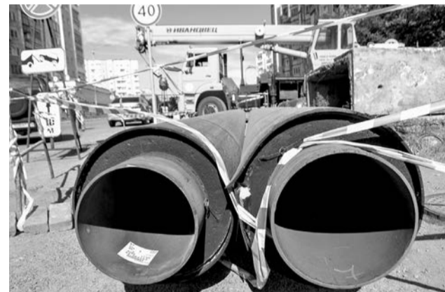
Новые трубы на улице С. Застава улучшат теплоснабжение микрорайона, в котором за последний отопсезон было немало аварий.

Северная Застава. Срок завершения работ — 15 августа, постараемся сделать быстрее.