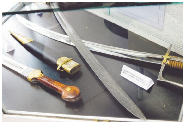
Старинного оружия на выставке не очень много, в основном новое, но очень качественное. Казаки заказывают оружие признанным мастерам.