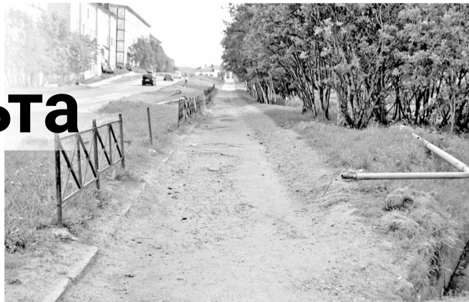
Тротуар на улице Кирова полностью обновится и будет расширен.

Около 2 тыс. м 2 асфальта мы заменим на тротуаре, толщина асфальтобетонного покрытия здесь составит в один слой 3 см. Покрытие на тротуаре будет выровнено, вдоль него подрежем нависающие ветки деревьев, чтобы уборочная техника не ломала их во время работы. Для лучшего прохода уборочной техники будет также расширен тротуар. Вдоль пешеходной части демонтируем деревянный бордюр, установим бетонный бордюрный камень, обновим бордюр и вдоль проезжей части. Предусмотрена замена старого металлического забора, который приходилось постоянно перекрашивать, на новый — из оцинкованного материала.