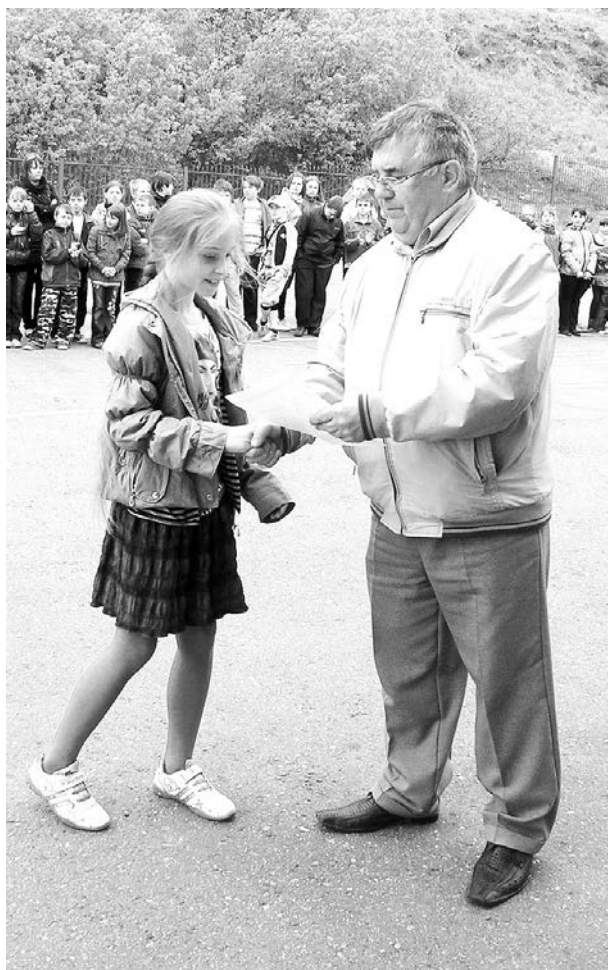
Спортивную молодежь нужно поддерживать и поощрять, поэтому все участники спартакиады получили призы.