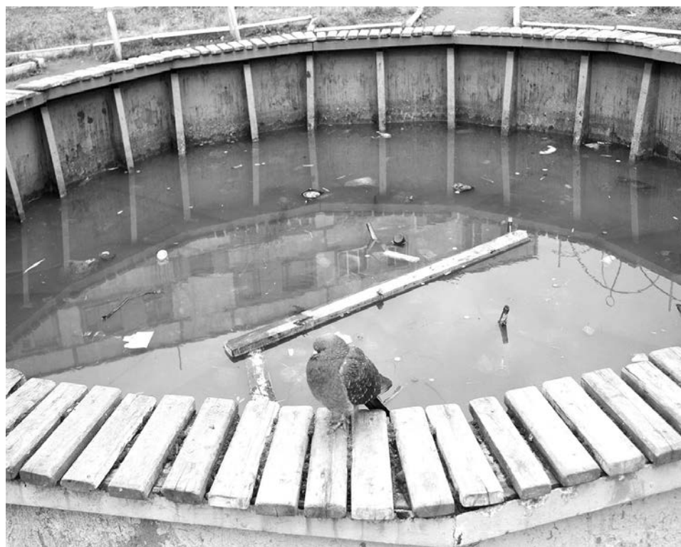
В октябре прошлого года одна из достопримечательностей поселка - фонтан - производила унылое впечатление. Скоро все изменится.

Ирина ПАЛАМАРЧУК.