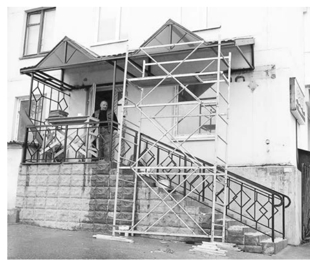
В мебельном салоне на ул.Душенова, 22 также будет отдельный вход.