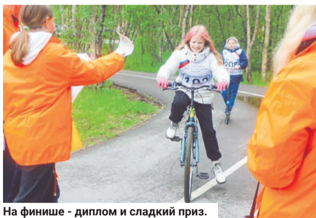
На финише - диплом и сладкий приз.