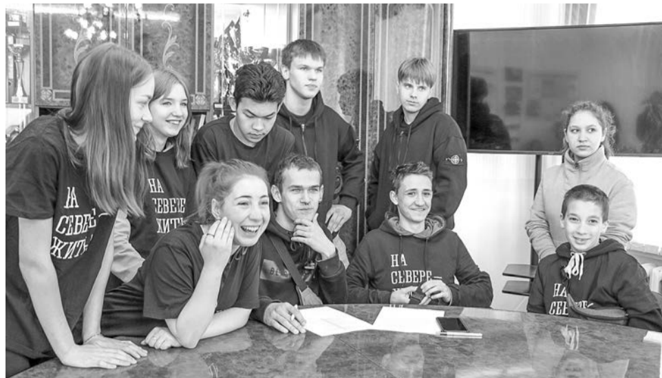
Станции «Маршрута здоровья» посетили 40 подростков из североморских школ №1, 7, 10 и школы полного дня.

Прямой и откровенный разговор – тот формат, который позволяет достучаться до детей в непростом подростковом возрасте.