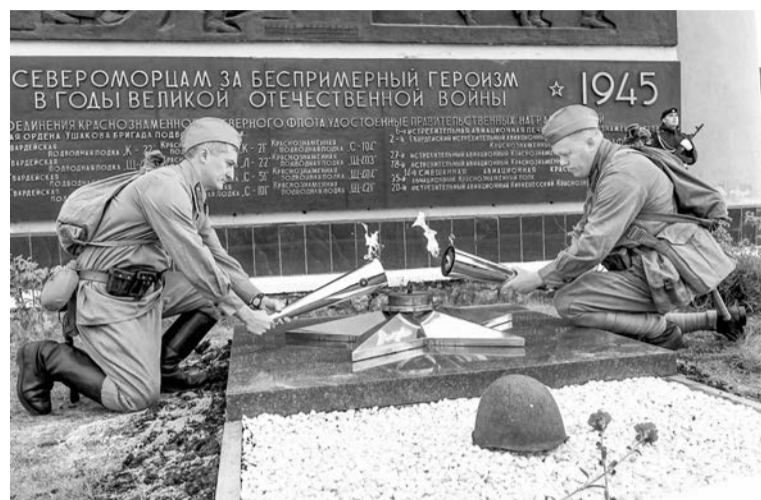
Огонь памяти зажигают военные реконструкторы.

Несмотря на ранний час, поддержать акцию к памятнику «Героям североморцам — защитникам Советского Заполярья» пришли поисковики, представители общественных и молодежных объединений, волонтеры, сотрудники учреждений города, работники культуры и образования, просто жители Североморска. — Мы живем в городе боевой сла-