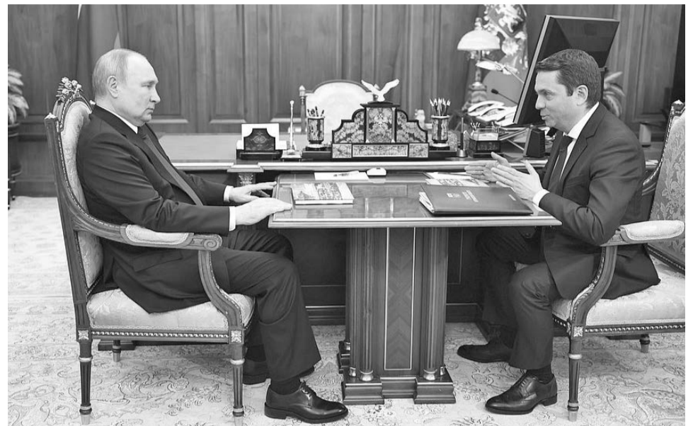
Президент РФ Владимир Путин выслушал доклад губернатора Мурманской области Андрея Чибиса о состоянии дел в регионе.

Одним из ключевых решений, принятых на встрече Владимира Путина с Андреем Чибисом, стал вопрос газификации Мурманской области. После глубокой проработки вопроса газификация региона от ресурсной базы Единой системы газоснабжения за счет строительства магистрального газопровода «Волхов — Мур-