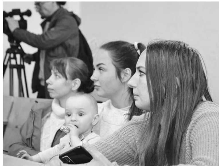
Молодые мамы Щукозера ждут помощи от руководства ЗАТО.

— По паспорту эта дорога относится к категории «грунтовых», и после ремонта, то есть простого асфальтирования, она не может вдруг