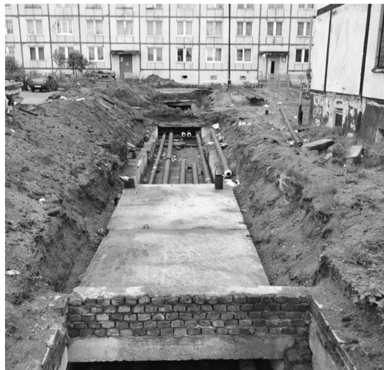
Запуск обновленной теплотрассы будут ждать все жители поселка, не первый отопсезон включающие в квартирах обогреватели.

поменять свой тип и стать асфальтобетонной. Здесь необходимо проектирование и строительство новой дороги со всеми вытекающими финансовыми расходами, в том числе и на освещение. То, что некоторые старожилы помнят, что здесь лежал асфальт, не может быть для нас ориентиром. Возможно, когда-то