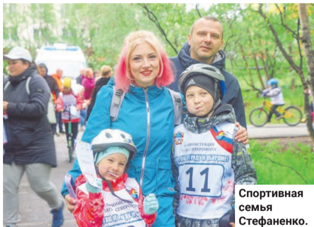
Спортивная семья Стефаненко.