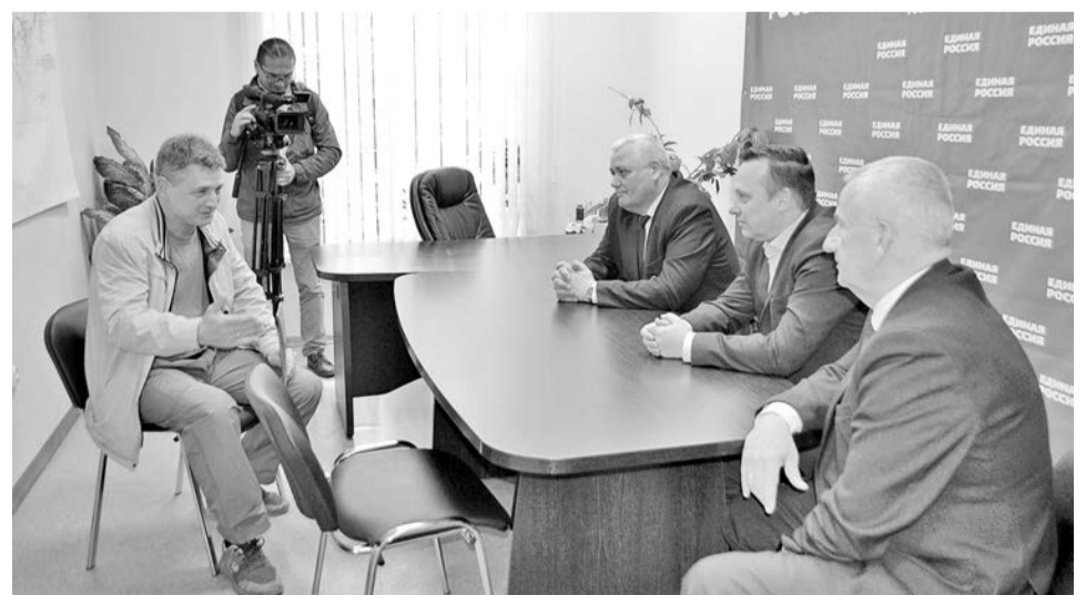
Один из вопросов на совместном приеме касался получения военнослужащими СФ жилищной субсидии от Министерства обороны РФ.