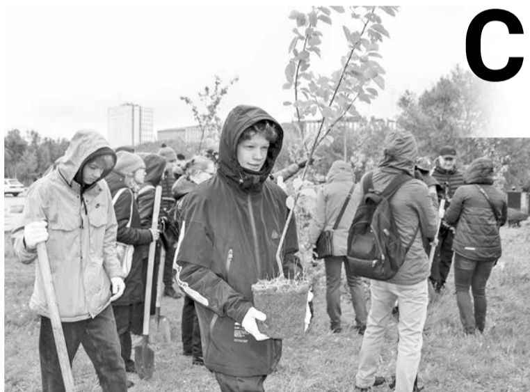
В первые ряды — черемуху, дальше — березки и рябинки.