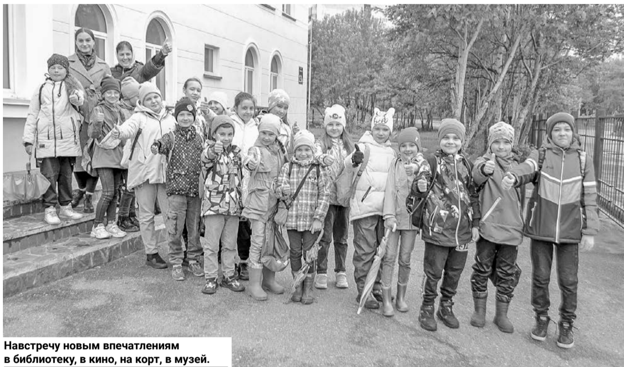
Навстречу новым впечатлениям в библиотеку, в кино, на корт, в музей.