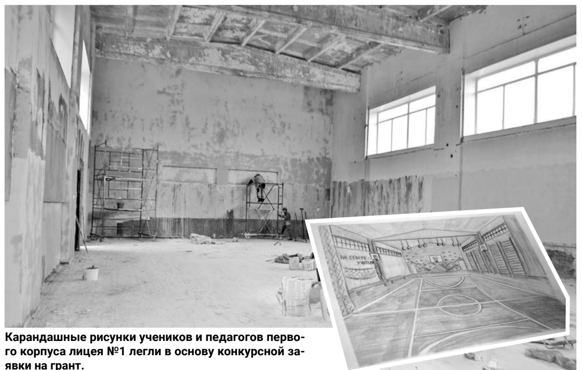
Карандашные рисунки учеников и педагогов первого корпуса лицея №1 легли в основу конкурсной заявки на грант.