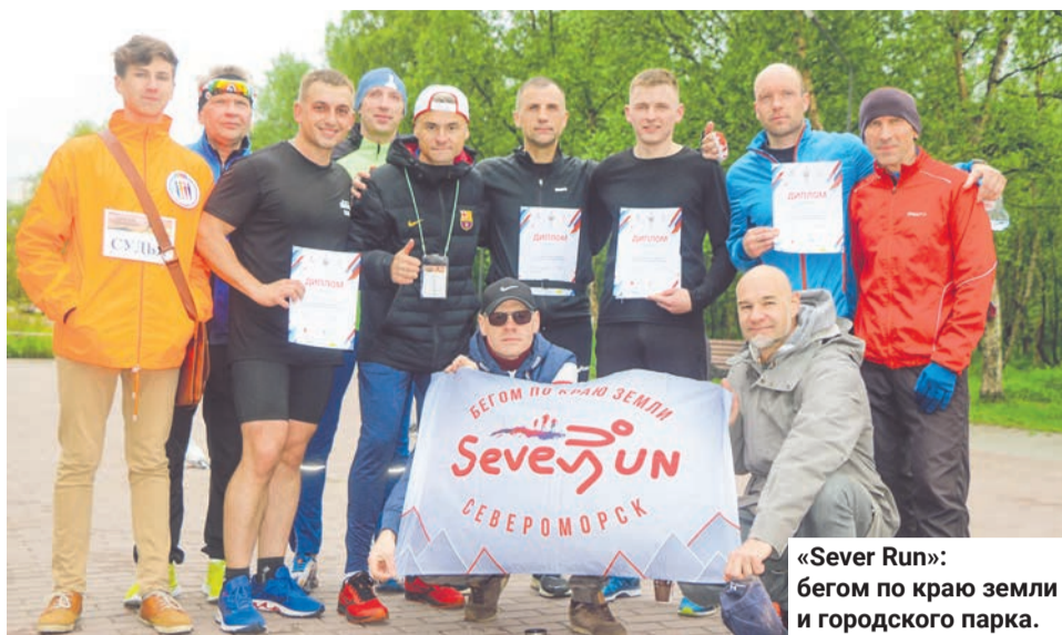
«Sever Run»: бег по краю земли и городского парка.