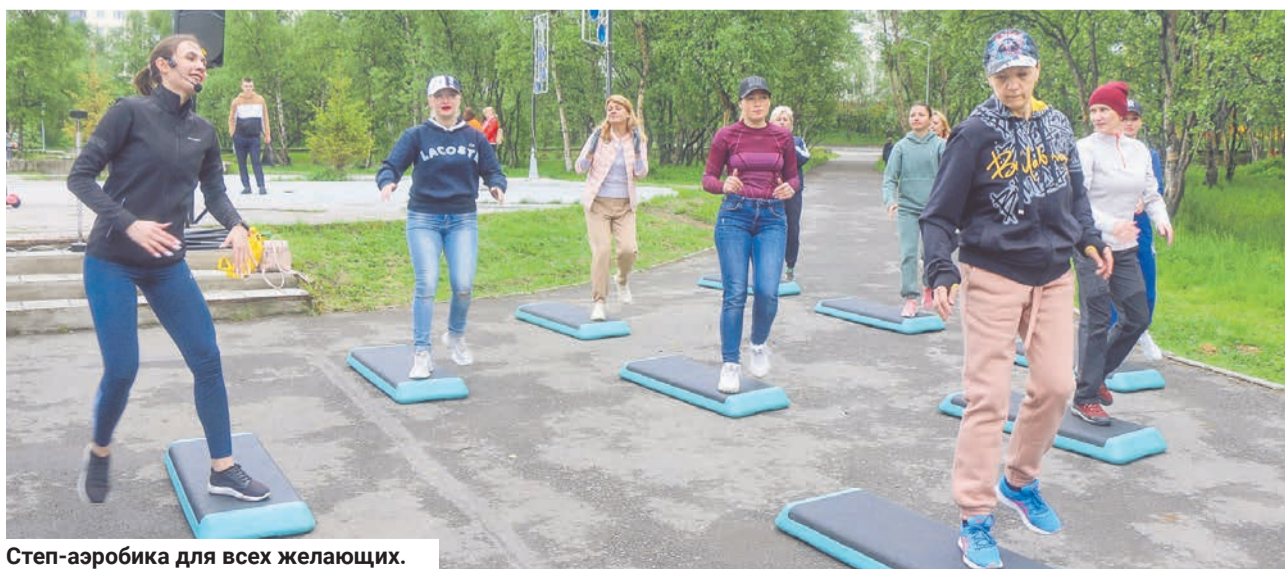
Степ-аэробика для всех желающих.