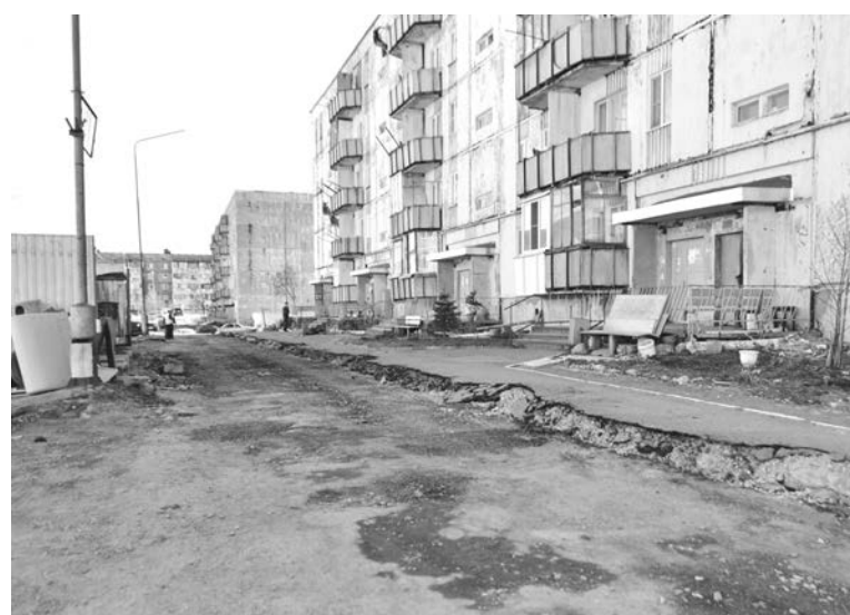
Дом и двор под ключ: дом №13 по ул. Героев Североморцев в этом году участвует сразу в двух ремонтных программах ФКГС и капремонта.