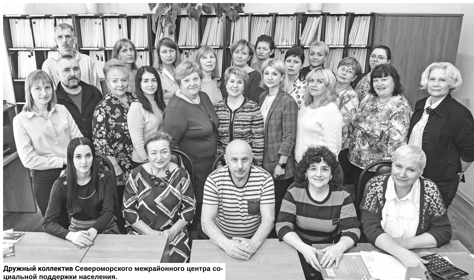
Дружный коллектив Североморского межрайонного центра социальной поддержки населения.

Материал подготовила Наталья СТОЛЯРОВА.