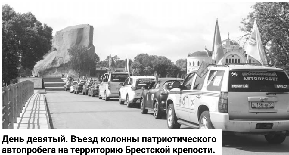
День девятый. Въезд колонны патриотического автопробега на территорию Брестской крепости.