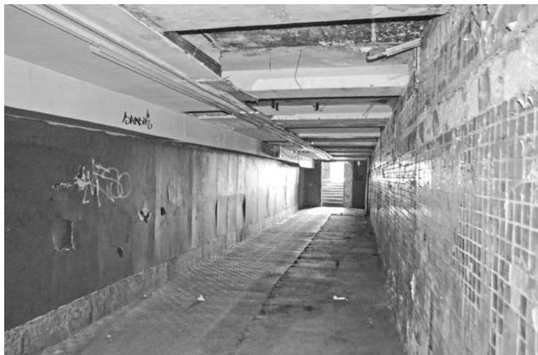
С момента сдачи подземного перехода в аренду в 1998 году капитальный ремонт здесь не проводился.