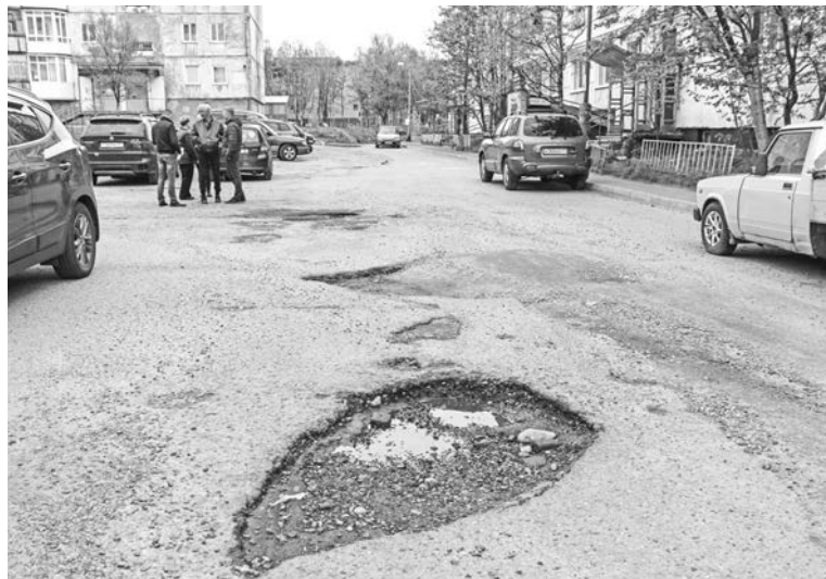
Проезд между домами №1 и 3 на ул.Колышкина. Вместо тысячи слов...

Вторая площадка на Северной Заставе возле дома №14 — новенькая, в прошлом году ее подарил городу АНО «Центр городского разви-