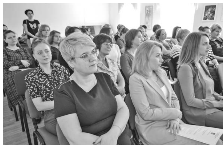
В 2021 году североморский КЦСОН второй раз подряд был признан лучшим в Мурманской области по независимой оценке качества оказываемых соцуслуг.