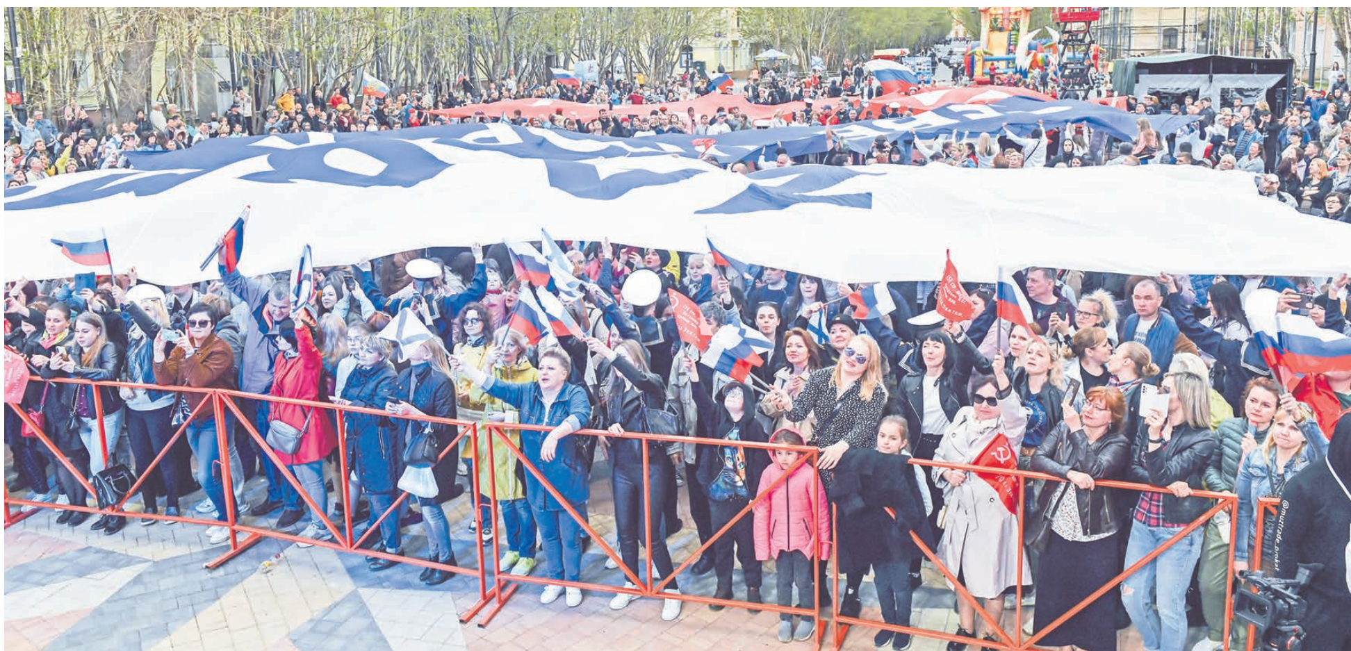
В финале патриотической акции огромные полотна цветов российского триколора были развернуты в форме буквы Z, ставшей символом российской армии.