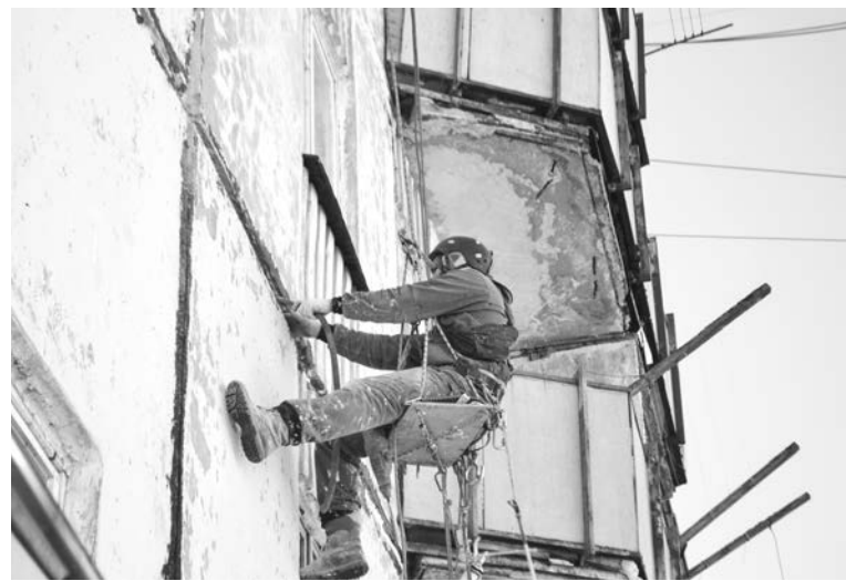
Тепло и уют в домах во многом зависит от герметичности межпанельных швов.