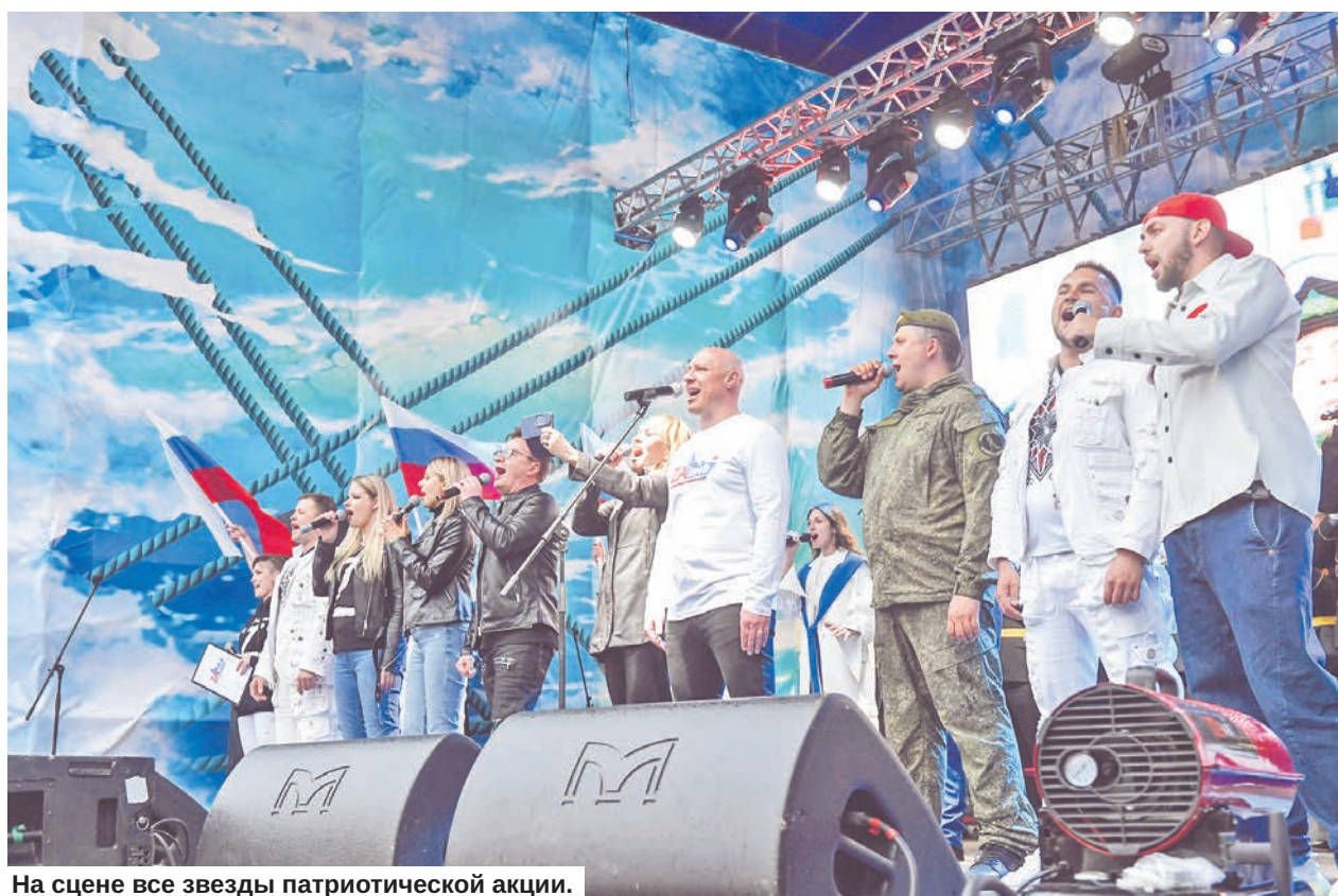
На сцене все звезды патриотической акции.