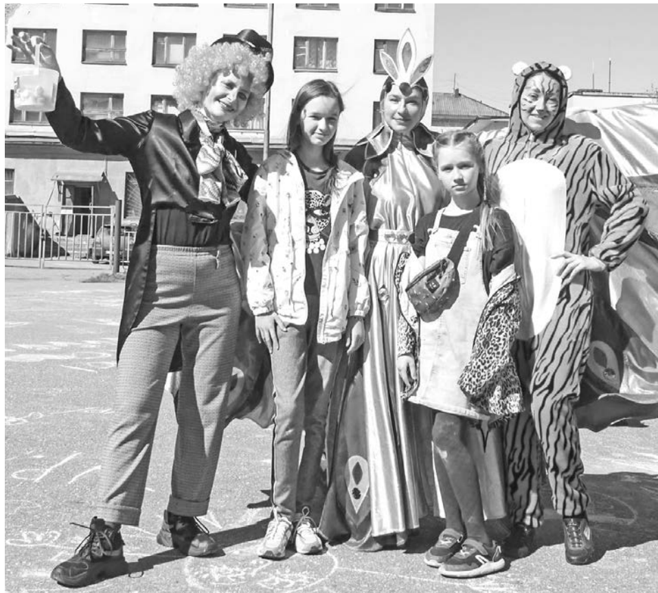
Фотосессия со сказочными героями на празднике во дворе Дома детского творчества.

Вторая смена оздоровительной кампании пройдет с 24 июня по 14 июля и будет посвящена безопасности дорожного движения. На ее мероприятиях 195 школьников смогут показать и расширить знания правил дорожно-