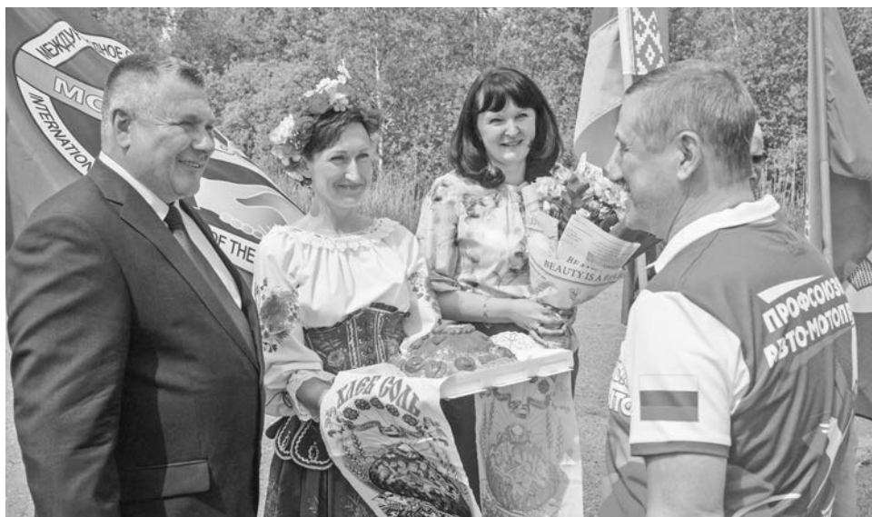
День шестой. Белоруссия встречает хлебом-солью.