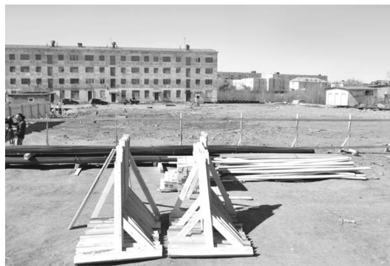
В этом году здесь должна появиться новая модульная амбулатория по аналогии с недавно введенной в строй в п.г.т. Сафоново.