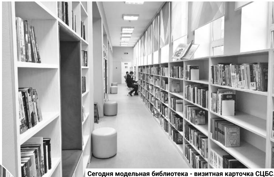
Сегодня модельная библиотека - визитная карточка СЦБС.

— Этот конкурс отличается всеохватностью критериев для участия, необходимо соответствовать параметрам в сфере пожарной безопасности, охраны труда, доступной среды, энергосбережения, предоставления услуг, — отмечает директор ЦБС. — В 2021 году, защищаясь перед конкурсной комиссией, мы представили наши библиотечные музеи, семейно-досуговые центры и брендовые акции — «Суперчитатель года», «Лучик», «Первые книжки для вашей малышки». Очная защита перед региональной комиссией по качеству из 15 человек — один из самых волнительных моментов, но присутствует и гордость, ведь мы рассказываем о том, чего добились, что можем предложить нашим читателям. Из библиотечных систем Мурманской области только Североморская ЦБС регулярно принимает участие в этом конкурсе, получая статус не просто участника, а лауреата. Таким образом, о североморцах знает вся область, мы на слуху у Правительства региона, представители которого тоже входят в комиссию. Никакой финансовой отдачи статус лауреата не дает, однако престиж Североморской ЦБС — вот что бесценно!