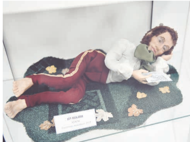
Пушкин. Кукла. Пластика. Текстиль. 2015 год.