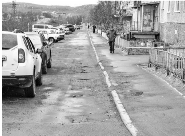
Дворовые территории на нечетной стороне Северной Заставы к сентябрю должны быть как новенькие.

— Застава просто чудесным образом преобразилась прошлым летом. Обновилась спортивная и детская площадки. Хочется, чтобы и другая сторона улицы стала такой же. Здесь сделают дворовые проезды, тротуары, парковку, поставят лавочки, добавят освещения, а заодно починят и трап, ведущий от Северной Заставы к улице Гаджиева.