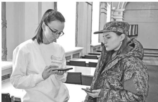
С помощью приложения на телефоне волонтера за «Городок сказок» проголосовали и военнослужащие.

Продолжается голосование за выбор общественных территорий, которые будут благоустроены в 2023 году в рамках программы «Формирование комфортной городской среды».