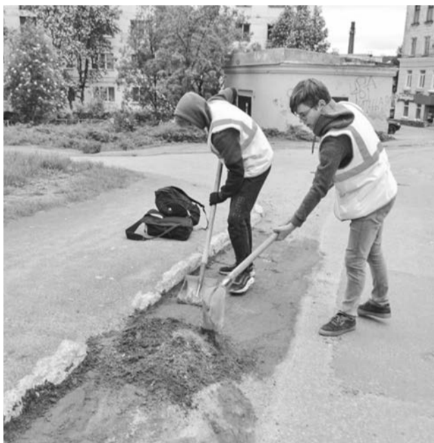
Чтобы трудоустроиться в летние каникулы, нужно подать заявление на платформе «Работа в России».

В частности, чтобы принять участие в программе временного трудоустройства в период летних каникул 2022 года, несовершеннолетним гражданам необходимо подать заявление на получение государственной услуги содействия гражданам в поиске подходящей работы на Единой цифровой платформе в сфере занятости и тру-