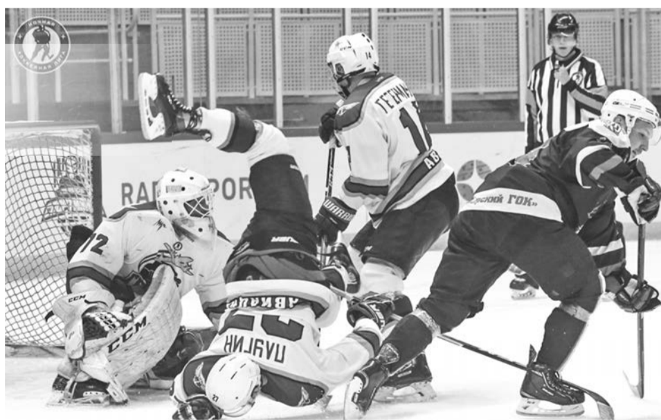
Ох и не просто пришлось «Грозе» уже в первом поединке в Сочи, когда ей противостоял прошлогодний победитель «Лиги Мечты» «Вольфрам Б» из Вологодской области.

В течение сезона проводятся отборочные матчи в регионах, а затем победители состязаний приезжают в Сочи на Фестиваль. Это, кстати, весьма удачно выбранное слово — не просто финал соревнований, а именно Фестиваль, можно еще сказать, карнавал,