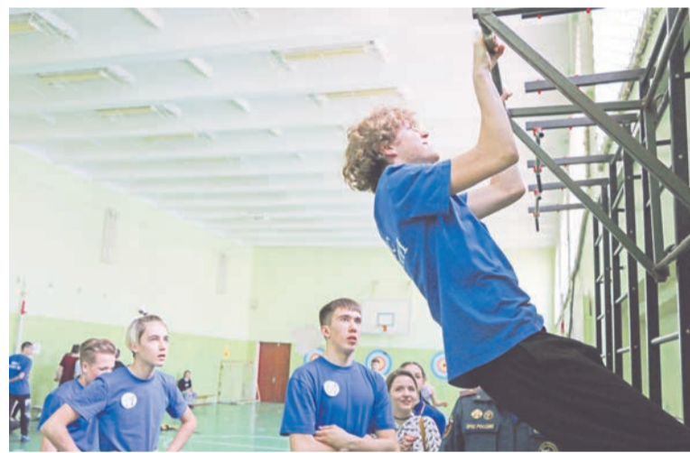
«Лицейсты» сдают нормативы - и весьма успешно.