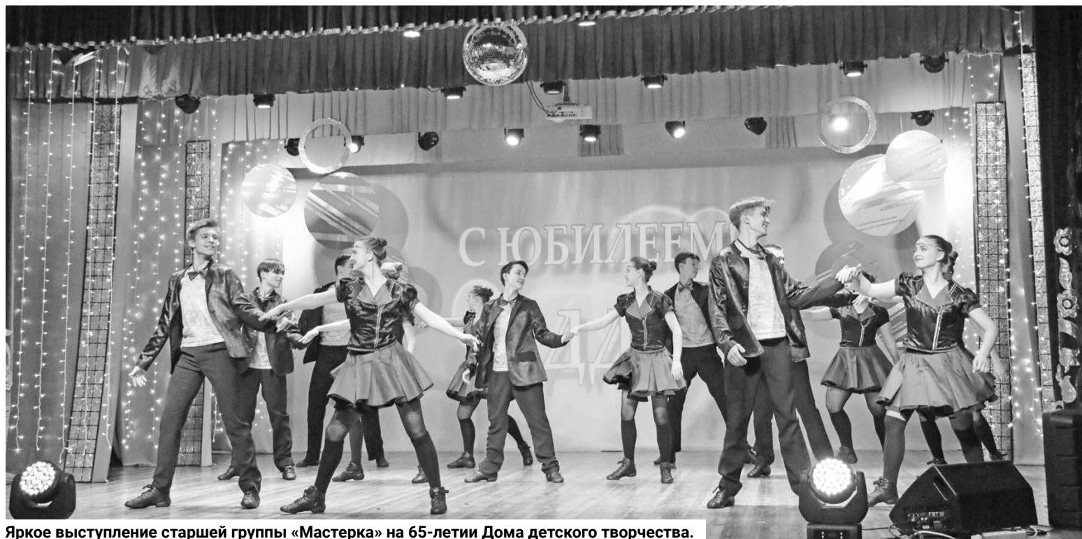
Яркое выступление старшей группы «Мастерка» на 65-летию Дома детского творчества.

ния (ПФДО). Родителям необходимо заполнить заявление, согласившись на обработку персональных данных, выбрать то объединение, куда они хотят зачислить ребенка, и мы зачисляем его с 1 сентября. Активировать ПФДО можно прямо у нас — на ул. Головки, 1а.