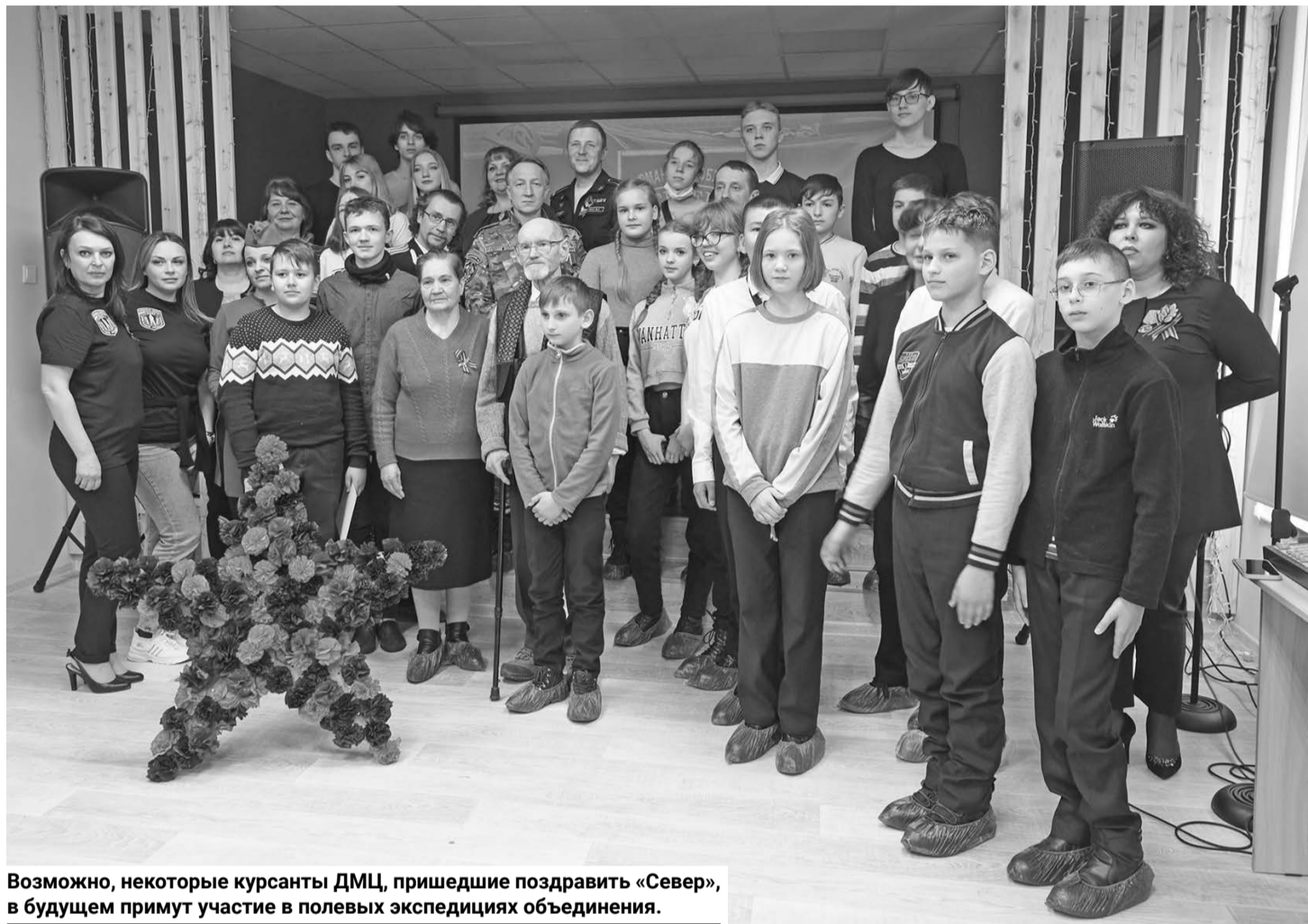
Возможно, некоторые курсанты ДМЦ, пришедшие поздравить «Север», в будущем примут участие в полевых экспедициях объединения.

чение работе с оборудованием. В поисковых работах участвуют молодые люди с 18 лет, в мемориальных с согласия родителей и под контролем взрослых могут участвовать подростки с 14 лет.