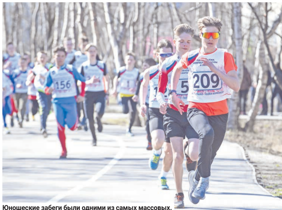
Юношеские забеги были одними из самых массовых.