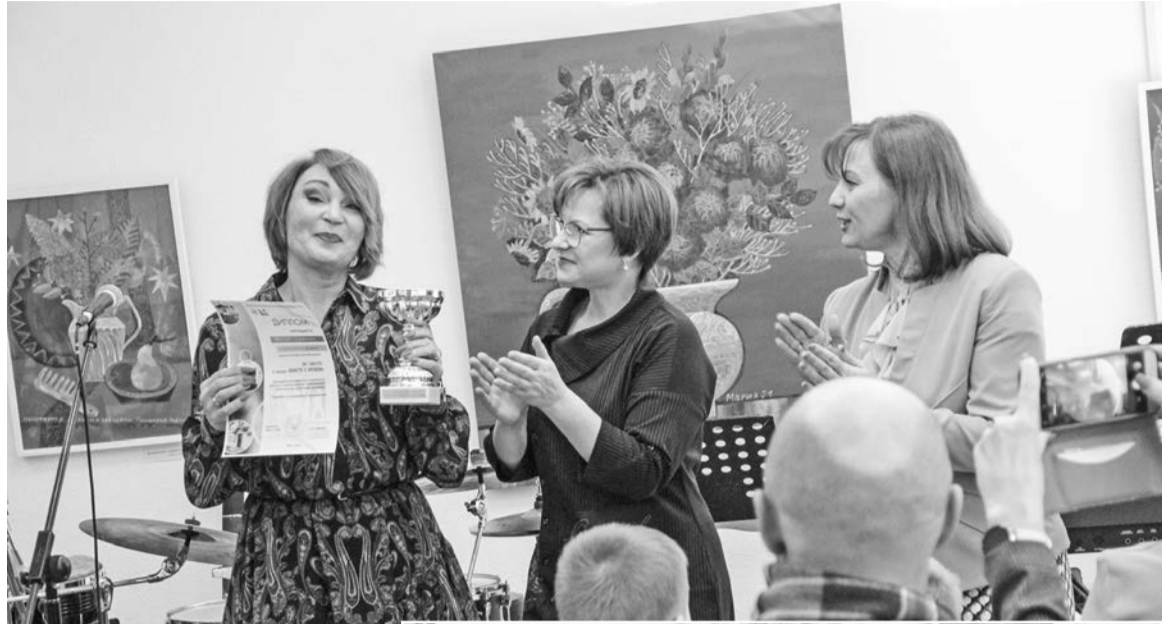
Десятая школа - победитель акции «Вместе с музеем».

— Музей тесно сотрудничает со школами и детскими садами. Ребята приходят в гости на все наши площадки: на различные занятия, мастер-классы, экскурсии. Мы вместе приобретаем детей к ценностям культуры, истории. У нас разработан цикл занятий для школьников и дошкольников. Окружающий мир и краеведение, народная культура и ремесла, искусство и творчество. Есть классы, которые появляются у нас в гостях каждый месяц. Мы ценим труд педагогов, ведь такая работа для них не является обязательной, а скорее дополнительной. Поэтому в конце года определяем самых активных учителей и учреждения, чтобы наградить благодарственными письмами.