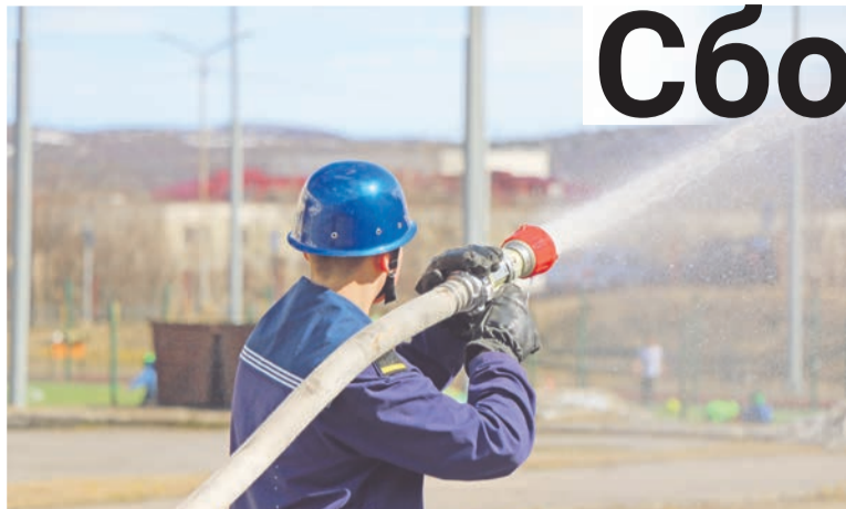
Кадеты отрабатывают боевое развертывание.

Они ловко надевают боевую одежду пожарного, умело орудуя огнетушителем, искусно вяжут спасательные узлы, могут наложить повязку травмированному и вообще готовы к любой экстренной ситуации!