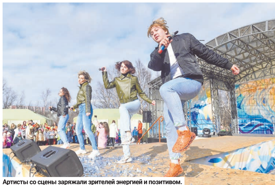
Артисты со сцены заряжали зрителей энергией и позитивом.