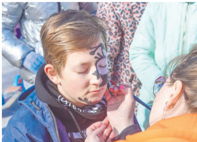
Мастер аквагрима создавала образы по желанию детей.