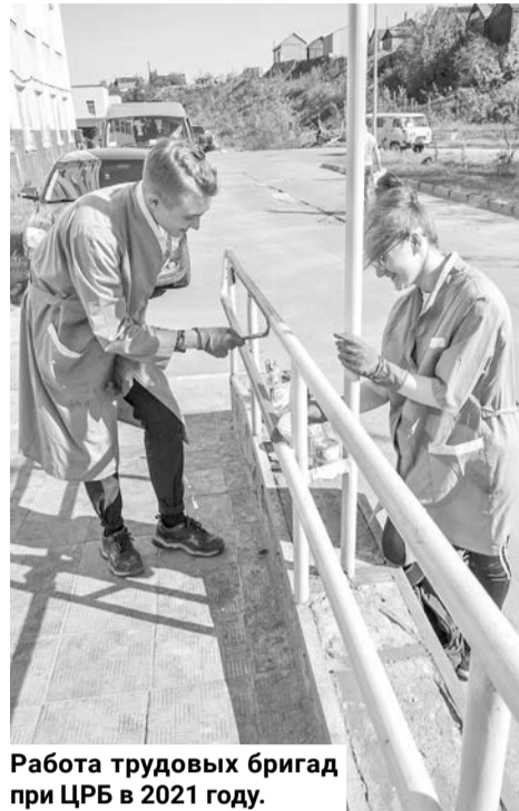
Работа трудовых бригад при ЦРБ в 2021 году.

Для трудоустройства гражданам, признанным безработными, студентам-очникам и школьникам от 14 до 18 лет необходимо