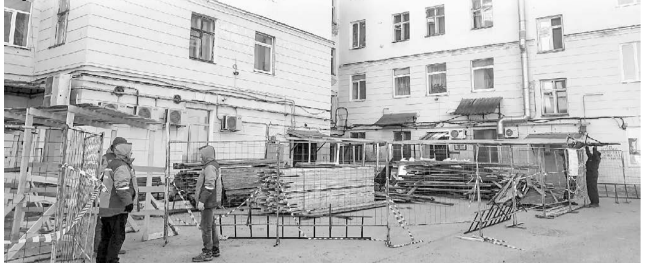
К дому № 12 по ул. Сафонова подвезены материалы, уже ведутся подготовительные работы.

В Заполярье начинается активный строительный сезон. И если в зимний период в рамках капитального ремонта по большей части ведутся работы по замене лифтового оборудования и инженерных сетей, то после схода снега в центре внимания — кровельные и фасадные работы.