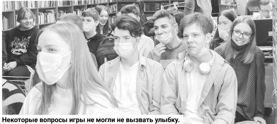
Некоторые вопросы игры не могли не вызвать улыбку.

Члены жюри и гости мероприятия поблагодарили ре-