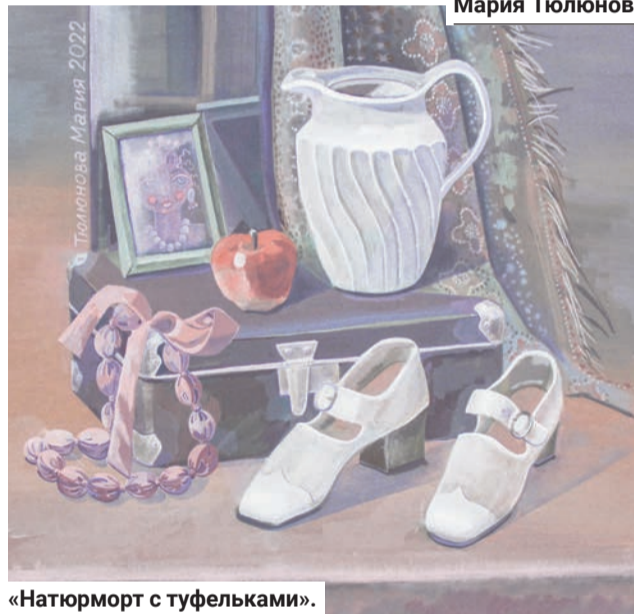
«Натюрморт с туфельками».