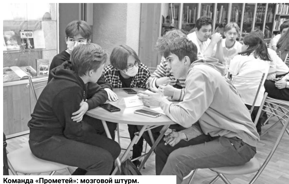
Команда «Прометей»: мозговой штурм.