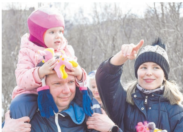
На праздник североморцы традиционно приходят семьями.

23 апреля в Североморске прошло праздничное народное гуляние.