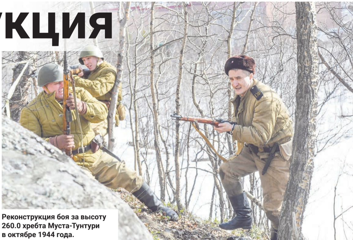
Реконструкция боя за высоту 260.0 хребта Муста-Тунтури в октябре 1944 года.