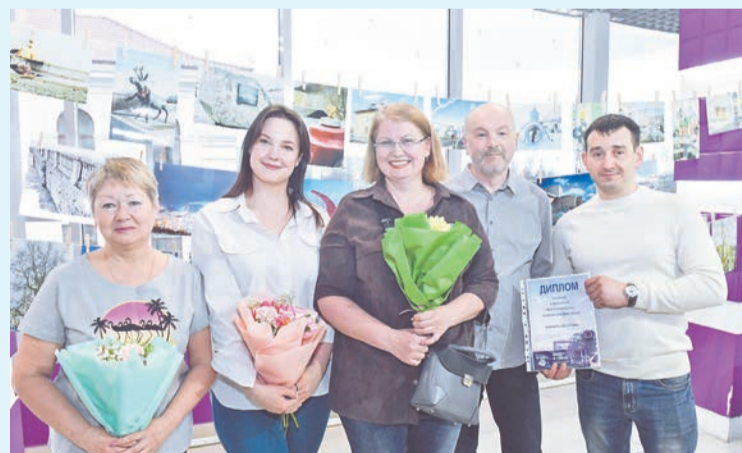
Команда «Винтаж» - победители IV фотоквеста «Мой Североморск».

Еще шесть команд — «Семейный очаг», «Полярные звезды», «Глюон», «Северные зайчики», «Семья» и «Ре-