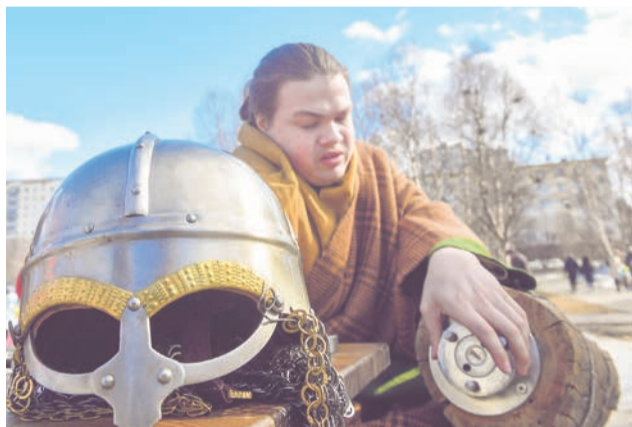
Желающих примерить шлем эпохи викингов было много.