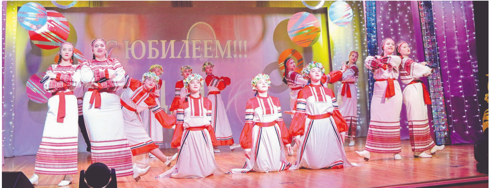
На сцене - образцовый коллектив народный вокально-хореографический ансамбль «Родничок».

Несмотря на солидный возраст, они молоды, активны, успешны, сохраняют традиции и открыты новому, а детство всегда с ними!