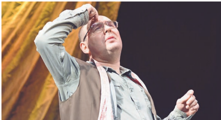
Александр Клоков — режиссер и, если нужно, актер.