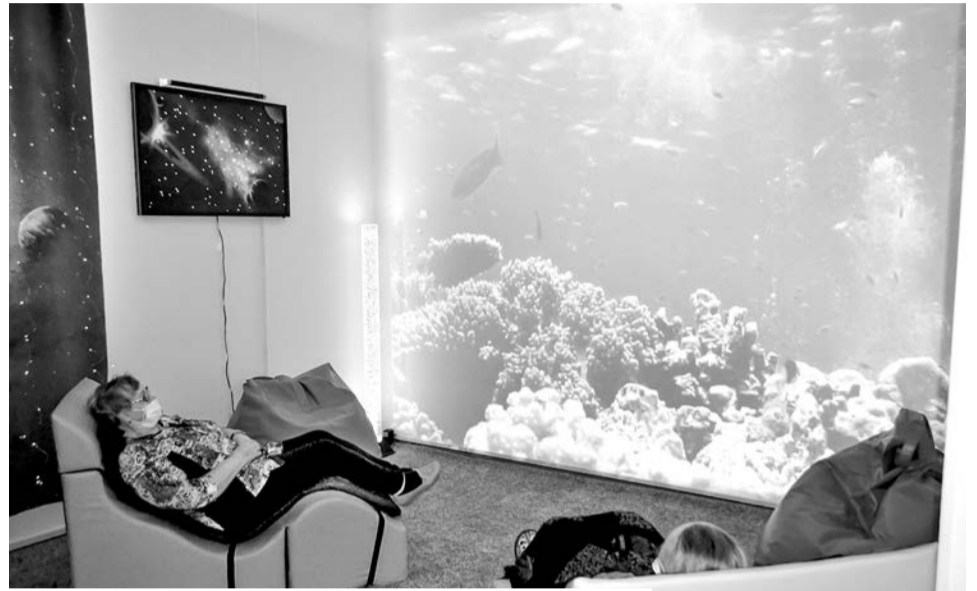
Для старшего поколения, любящего созерцание и покой, сенсорная комната — настоящая находка.

— Я провожу сеансы релаксации, которые могут сопровождаться текстом, музы-