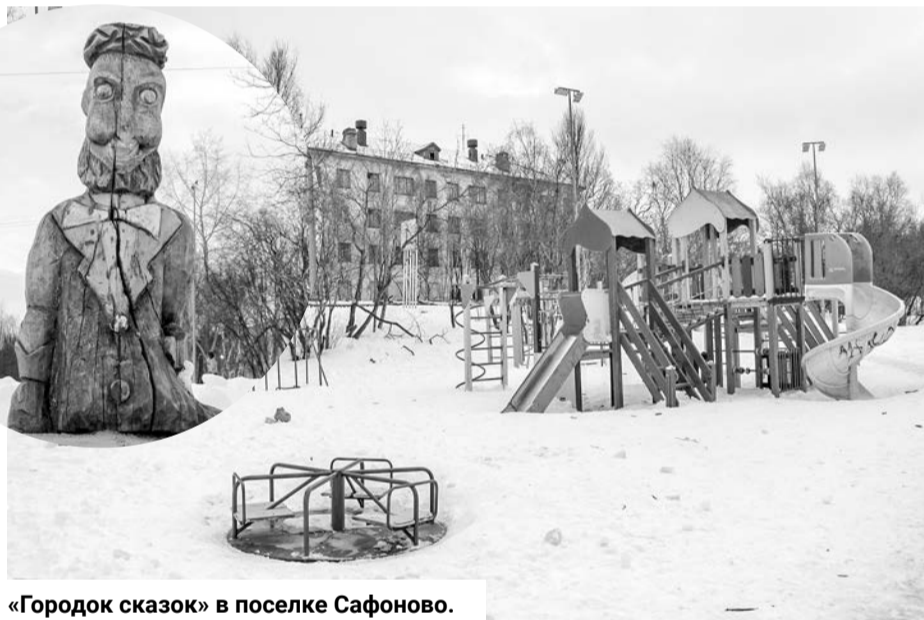
«Городок сказок» в поселке Сафоново.