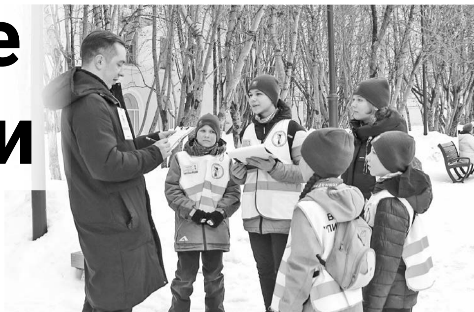
Младшая команда «пилигримов» отвечает на вопрос у бюста Б. Ф. Сафонову.

Чтобы за 2,5 часа побывать во всех 15 точках, командам пришлось потрудиться. Кто-то заранее спланировал маршрут и финишировал одним из первых, кто-то нашел не все точки, решил не рисковать и вернуться вовремя, а кто-то рискнул и за-