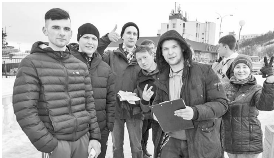
Команда в/ч 49324 «Гроза» на точке маршрута на набережной у Морвокзала.

9 апреля в Североморске в 16-й раз прошла историко-краеведческая игра «Город на скалах и сам как скала!», организованная Управлением культуры, спорта, молодежной политики и международных связей администрации ЗАТО г. Североморск и Североморским музейно-выставочным комплексом.