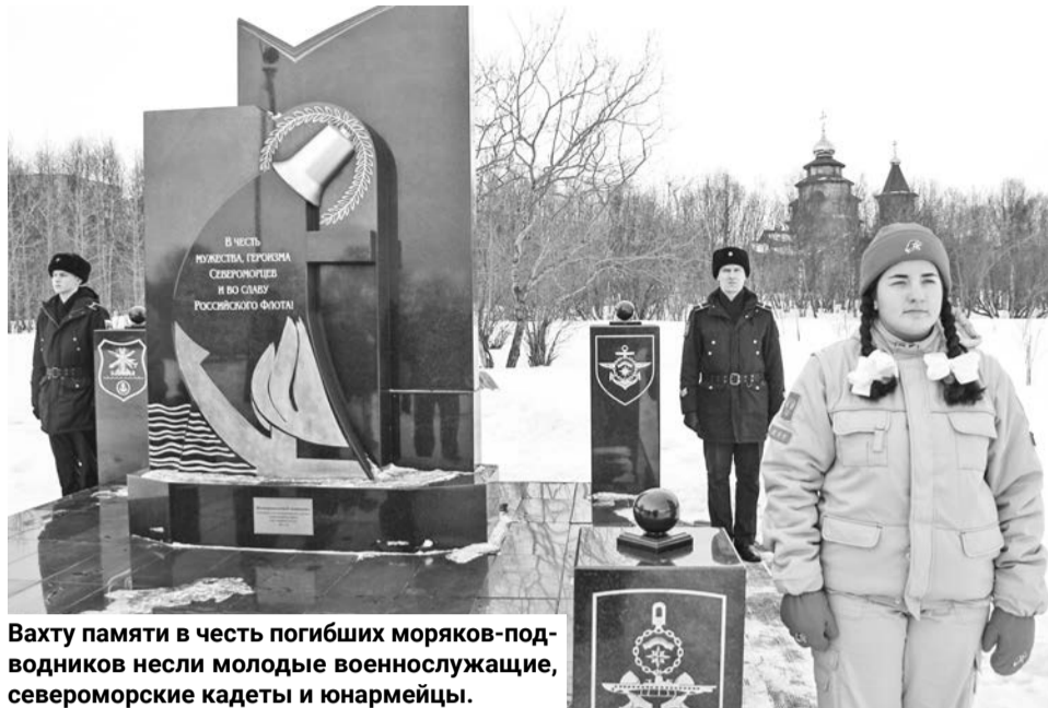
Вахту памяти в честь погибших моряков-подводников несли молодые военнослужащие, североморские кадеты и юнармейцы.

— В этот день я прибыл в краткосрочный отпуск к родителям и утром в но-