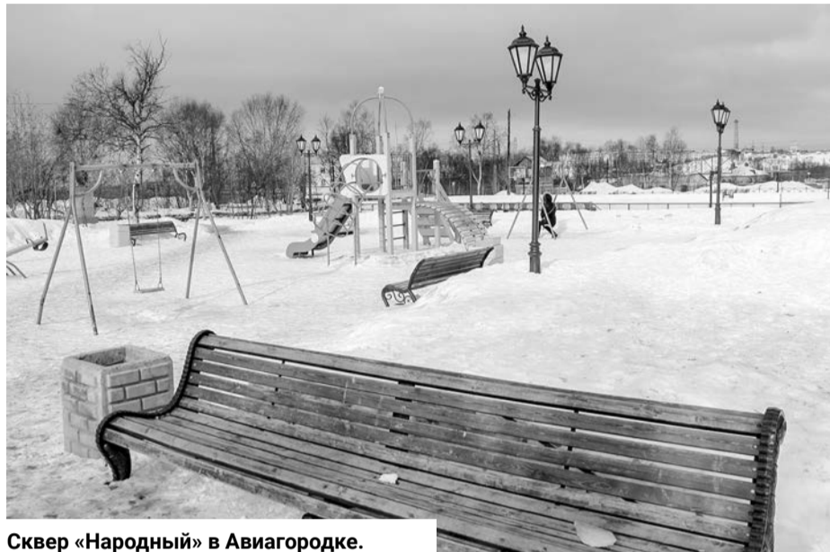
Сквер «Народный» в Авиагородке.