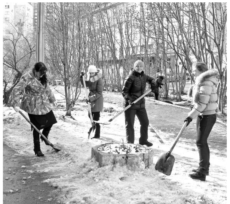
Сотрудники администрации постарались сделать все, чтобы освободить сквер от снега и приблизить весну.