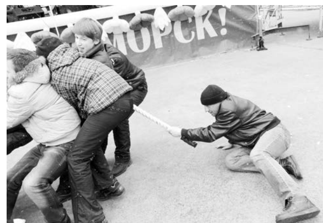
В перетягивании каната важен вклад каждого участника.