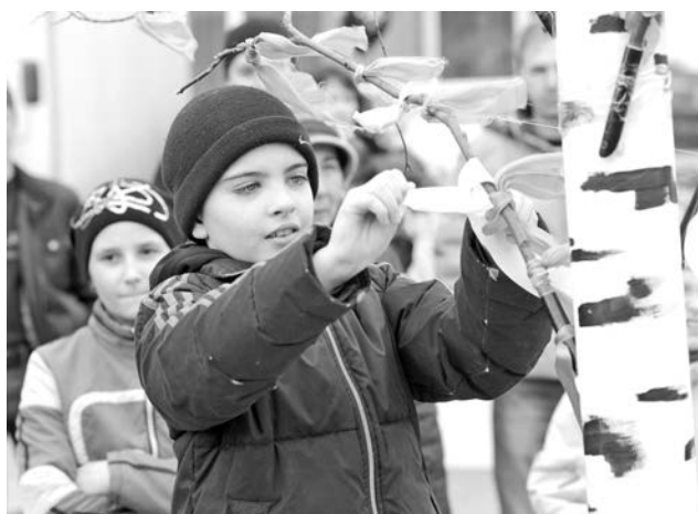
В старину ленточку на ветке березы завязывали для исполнения желания.