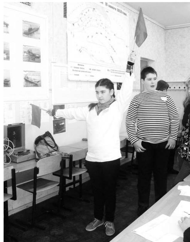
Команда школы №3 на этапе флажного семафора.