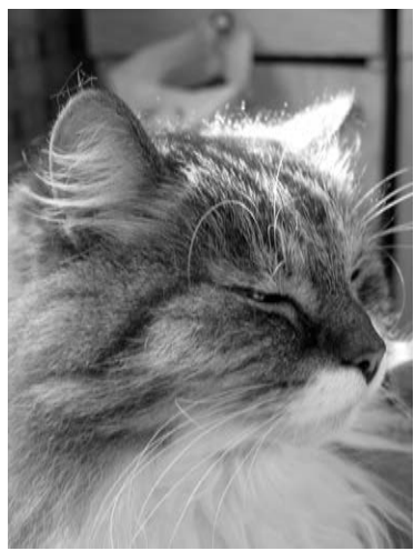
По человеческим меркам Димка - почтенный старик. Но его поведение говорит об обратном.