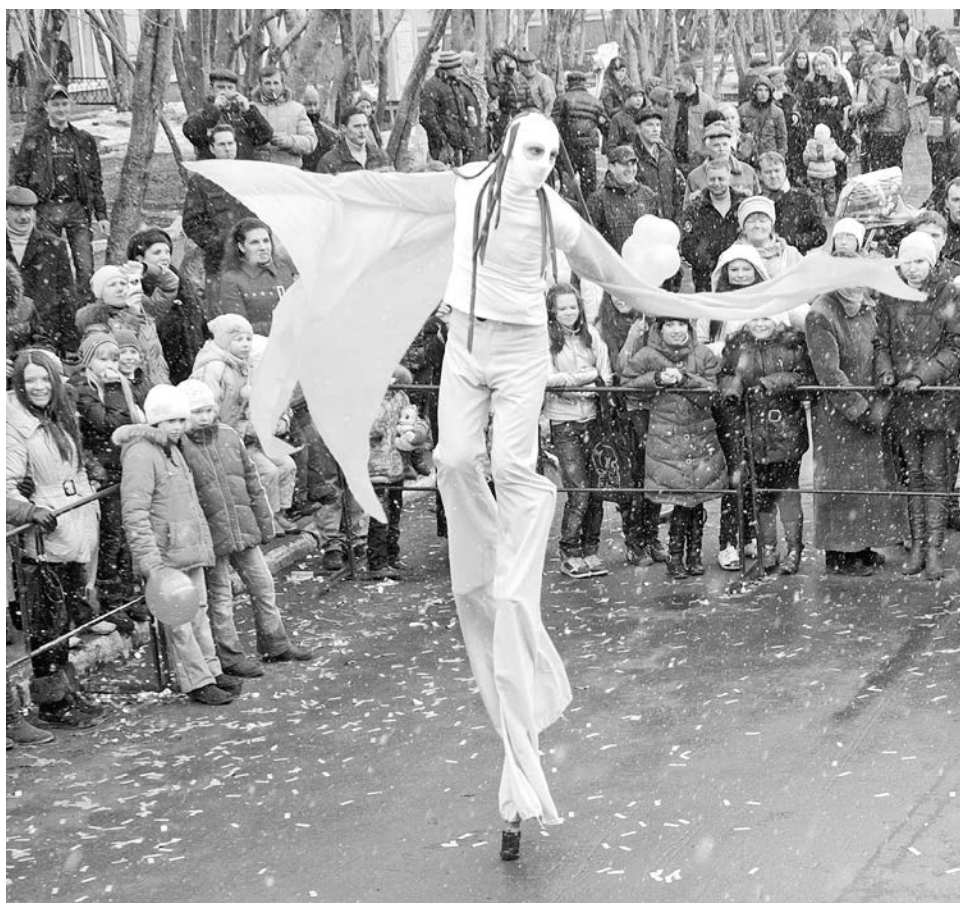
Артисты театра на ходулях весь день развлекали зрителей и разгоняли крыльями тучи над городом.