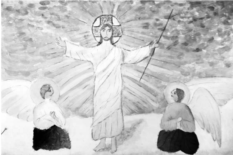
Конкурс рисунка «Пасха Христова», задуманный как разовая акция, стал традиционным.

Конкурс детского рисунка «Пасха Христова», организованный приходом святого апостола Андрея Первозванного, уже приобрел статус традиционного. Почти три месяца участники подавали свои работы. И вот 22 апреля в Доме детского творчества состоялся пасхальный концерт, где заслуженные награды получили победители и призеры конкурса.