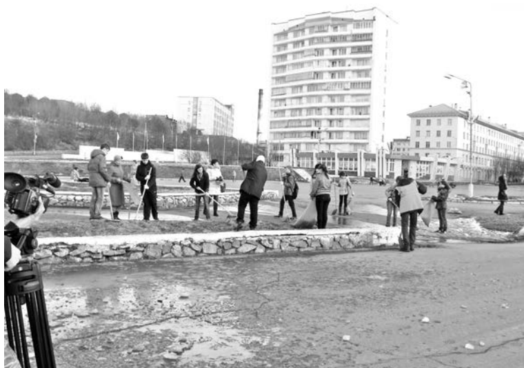
Немалый вклад в преобразование Приморской площади внесли ученики школы №12 и представители ООО «АДС».