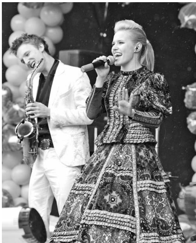
Свое прочтение народных песен столичной группой «Матрехи» горожанам пришлось по душе.