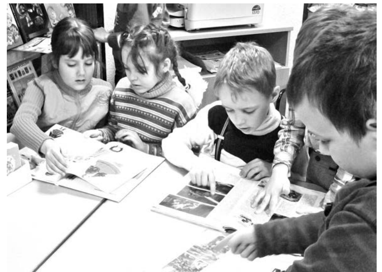
На библиотечном уроке «Книжные кладовые» главное сокровище - дети.

Сегодня у библиотеки одна только проблема - не хватает места для проведения массовых мероприятий: если больше 20 человек собираются - уже тес-