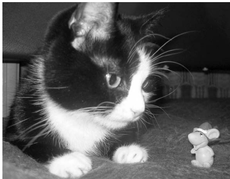
Меньше всего Дарька любит фотографироваться вместе с котом. Делить славу - не ее кошачье кредо.

Наш сибиряк отличается терпением, присущим буддийскому монаху, но Дарька, которую домашние прозвали куцехвостой террористкой, умудрялась вывести его из себя, и тогда ей же приходилось искать пятый угол, потому что Димка начинал валять