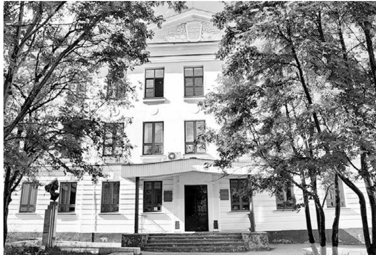
Какое бы название ни носил Дом творчества, сюда всегда будут стремиться юные и талантливые.

Остаться на должном уровне в 90-е годы помогла старая педагогическая закалка, верность своему делу, стремление оградить детей от взрослых проблем, которые тогда грозили, казалось, вовсе утопить ковчег культуры. Хор, ансамбль баянистов, экскурсии в краеведческий музей, авиа-