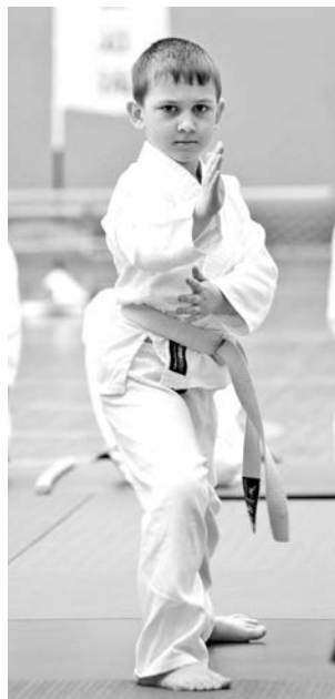
Айкидо – техника боя и образ мыслей.

Когда у ребенка есть желание заниматься спортом, но нет конкретных предпосылок, он и его родители сталкиваются с непростой задачей выбора секции. В этом случае возможно лично увидеть, что из себя представляет то или иное спортивное направление и каких высот позволяет достичь, станет намного полезнее чьих-то советов.