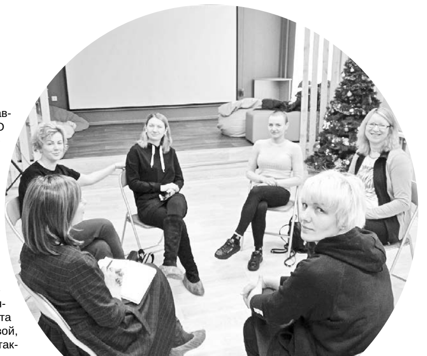
Новое молодежное пространство «Сопки» (ул.Морская, 10) отлично подходит для встреч в рамках проекта «ПРО НЕЁ».