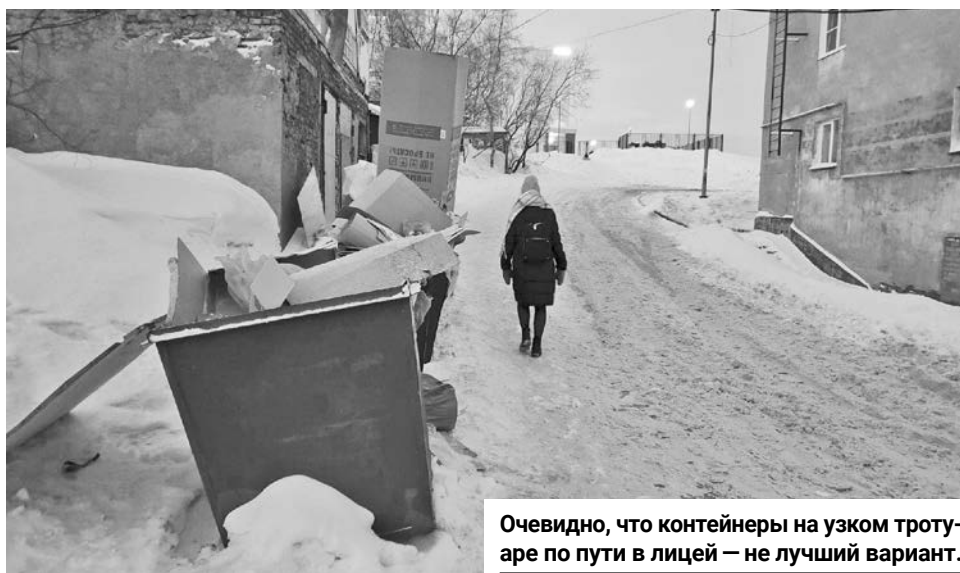
Очевидно, что контейнеры на узком тротуаре по пути в лицей — не лучший вариант.