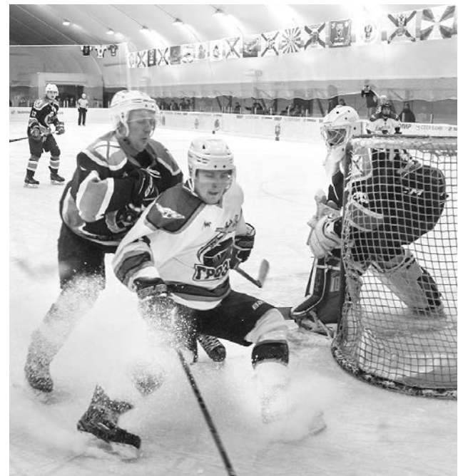
Очередная атака авиаторов накатывает на ворота моряков Кольской флотилии.

— Поражение от «Шквала» в предыдущем поединке заставило нас сделать определенные выводы. Но я не скажу, что подготовка к решающему матчу была какой-то особенной. Оба коллектива прекрасно понимают силу друг друга, мотивационной «накачки» здесь не требуется. Но это хоккей, при прочих равных здесь многое зависит от головы, а ребята у нас молодые, горячие, в пылу игры могут надумать ошарашить. Тем более что правила в Ночной хоккейной лиге особенные, скажем, нельзя вести силовую борьбу, из-за этого легко можно заработать удаление. Победили за счет коллективной игры и самоотдачи, парни не жалели себя, бросались под шайбу. Хочу поблагодарить руководство команды и наших болельщиков за поддержку.