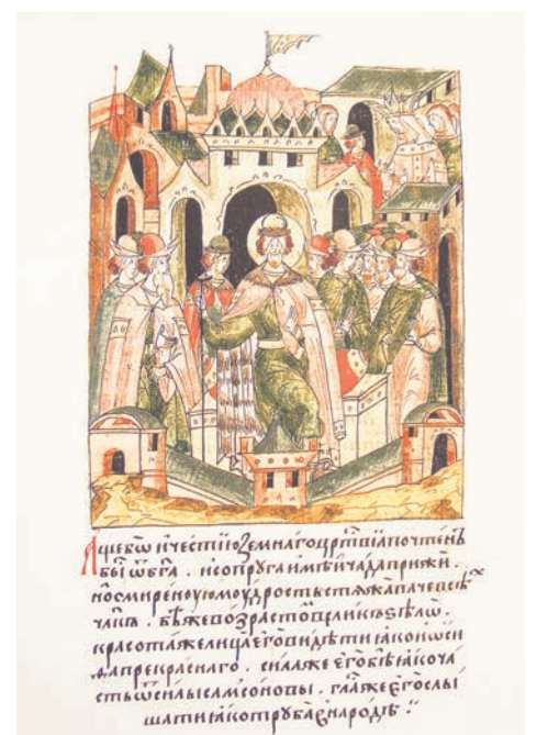
Так выглядят страницы Лицевого летописного свода.

Александр Невский — выдающийся военнополитический деятель русской истории, был причислен к лику святых еще в XVI веке. На своем веку ему не раз доводилось отражать удары с Запада, со стороны шведов и крестонос-