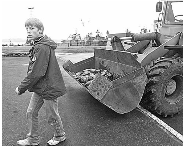
Школьники принимают активное участие в уборке города.

Валерия ЗАГУЗОВА.