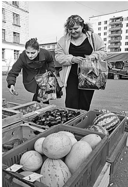
Разнообразие овощей и фруктов радует глаз.

Пока уличной торговлей заняты 6 предпринимателей, но пик сезонных