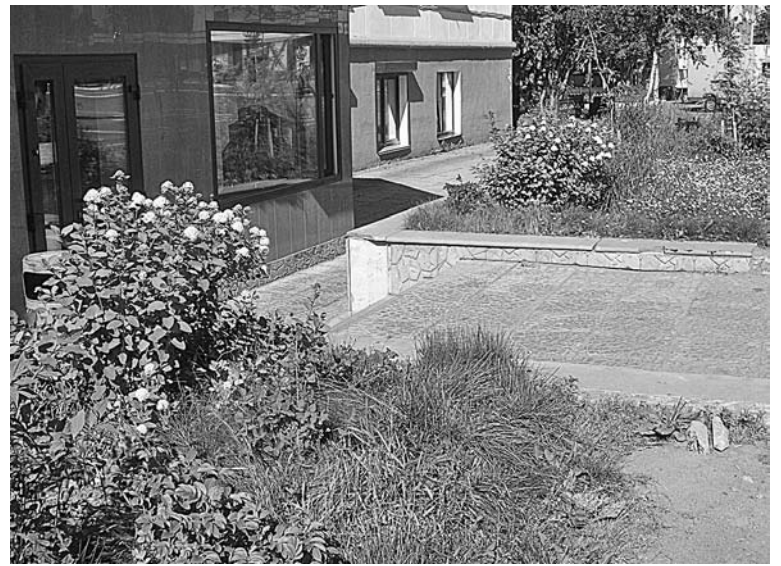
Цветущие кустарники и солнечные дни дарят североморцам ощущение лета.

Энтузиасты садового дела встречаются среди представителей разных профессий, в том числе предпринимателей. У одного