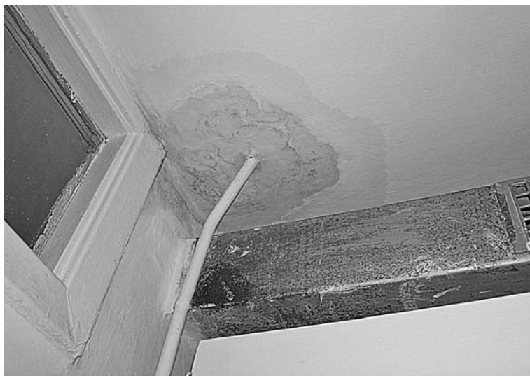
Так выглядит потолок в квартире Г.Мустафиной.

В 2000 году случился первый крупный потоп. Залило квартиры