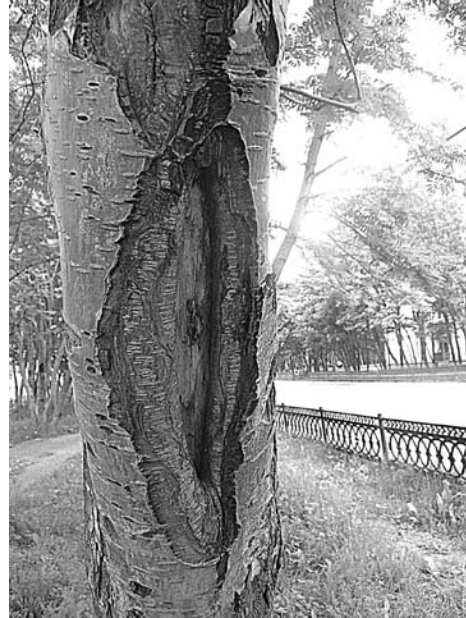
От трещин страдают многие рябины на аллее ул.Сафонова.

Основные древесные напасти в Североморске – трещины и отлупы коры, зараженность вредителями и болезнями. Листья березы, например, одолела ржавчина, а ивы козье – черная пятнистость. Лучше всего себя чувствуют осины и черемуха – здоровых среди них более 80%. Ну а причины болезней – это произрастание вблизи проезжей части городских магистралей, загущенность посадки. Кроме того, зачастую корневая система деревьев забросана песком с дорог. Единственный выход, по мнению ученых – провести ландшафтную реконструкцию зеленых насаждений, удалив сильно ослабленные деревья и посадив новые, более приспособленные к ус-