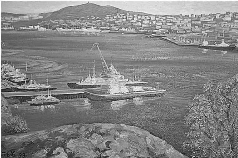
В.Горохов, «Вид на город Мурманск» (оргалит, масло), 1999г.