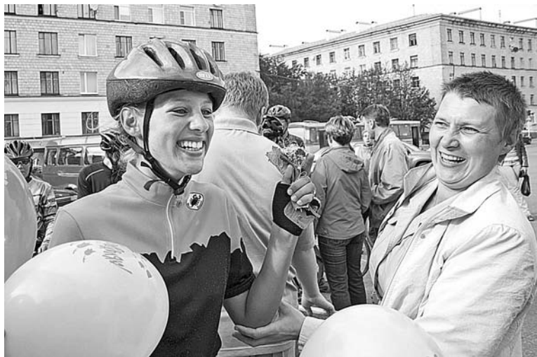
Радость, улыбки, счастье - наконец-то можно обнять родных и близких.

31 июля на площадь к администрации подъехали более 20 велосипедистов: 10-й велопробег детей и молодежи по странам Баренц-региона завершился – во флотскую столицу вернулись ребята из клуба «Пилигримы». Следует добавить, что к североморцам присоединились участники из Мурманска, Апатитов, Мончегорска, Кировска и даже из Подмосковной Балашихи. За спиной они оставили 3800 километров, привезли немало наград и море положительных эмоций. Ребята не только участвовали в различных соревнованиях, но и ходили в аквапарки, музеи, ловили рыбу.