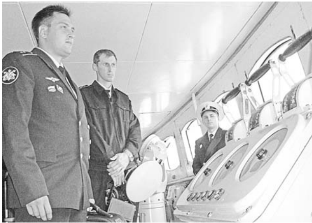
Ходовая рубка ледокола как машина времени: здесь можно увидеть технику прошлого века.