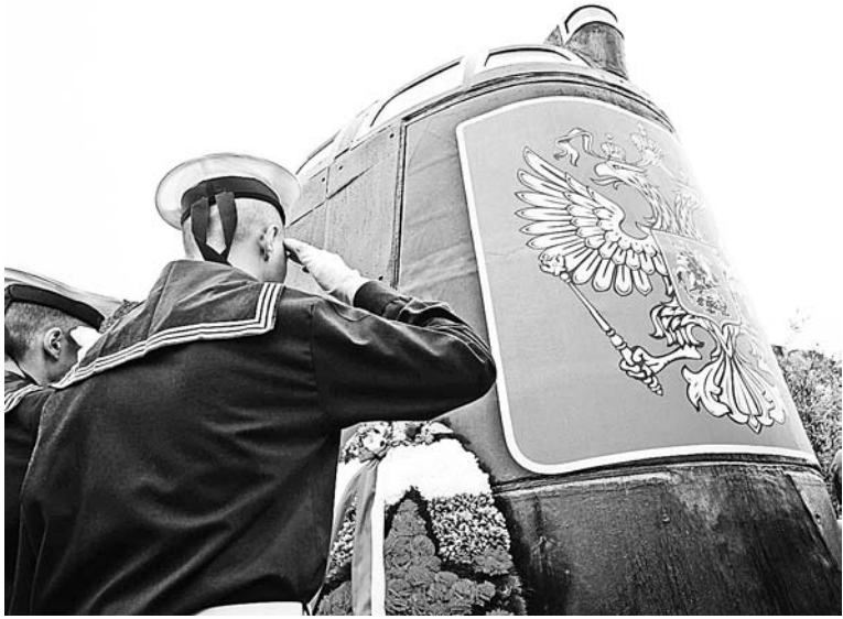
Мурманчане почтили память погибших моряков у мемориала возле храма Спаса-на-водах.

Десять лет назад не вернулись из моря 118 моряков. 12 августа 2000 года затонула подводная лодка «Курск».