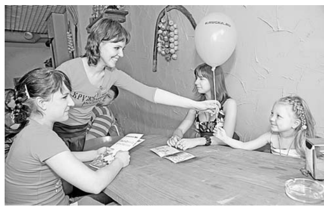
В «Кружке» всегда рады и взрослым, и самым юным посетителям.