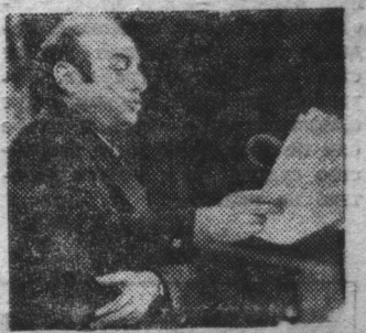
На снимке: писатель-сатирик Михаил Жавнецкий во время выступления.

Теперь эта передача стала традиционной. Уже пять раз она выходила в эфир. Впереди зрителей ждут новые встречи.