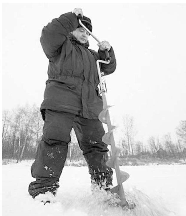
Ледобур следует держать строго вертикально.