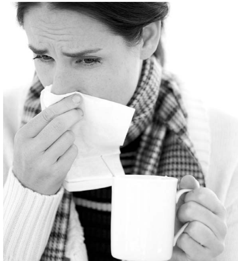
Ключ к спасению от ринита – в разумном использовании медицинских препаратов.

– Длительное использование сосудосуживающих препаратов, а «нафтизиновый» стаж у некоторых исчисляется десятком лет, приводит к обратному эффекту, – говорит Николай Васильевич. – Сосуды начинают расширяться еще сильнее и образуют в слизистой кавернозные тела, заполненные кровью. Наступает гиперплазия (увеличение объема ткани в результате новообразования клеток – авт.) слизистой носа. Постепенно она утрачивает чувствительность к назальным средствам и другим внешним факторам. Прямое следствие – нарушение обоняния. Не исключены носовые кровотечения, образование полипов. Неправильное носовое дыхание приводит к недостаточному насыщению клеток мозга кислородом, что негативным образом сказывается на интеллектуальных способностях, особенно детей. Как следствие – сонливость, снижение внимания и работоспособности. Медикаментозный ринит провоцирует нарушение слуха и работы сердца. Вынужденное ротовое дыхание приводит к поражению верхних дыхательных путей. Противопоказаны сосудосуживаю-