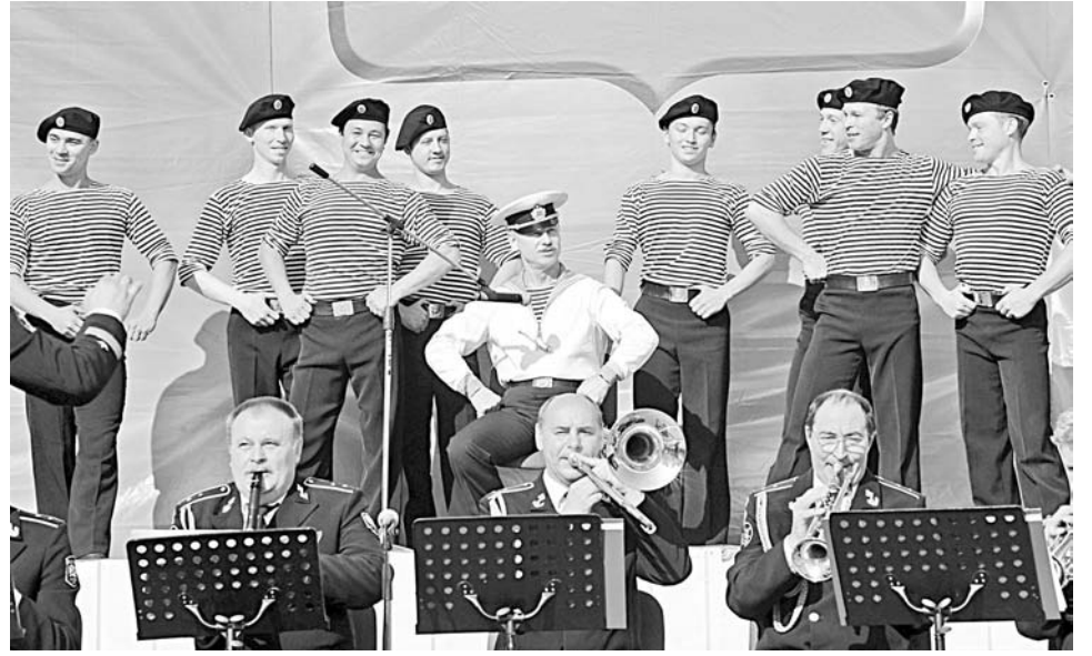
Ансамбль песни и пляски КСФ сегодня - это 60 танцоров, музыкантов и вокалистов.

Сегодня в условиях реорганизации военной структуры ансамбль переживает непростые времена. Сузилась гастрольная география. Последнее масштабное турне коллектив предпринял в 2007 году, когда в рамках Международного фестиваля фольклора выступал в Бельгии и Франции. А вот радовать самого верного — зрительского — артисты не прекращают. В мае этого года дали в городах Мурманской области ряд концертов, посвященных 65-й годовщине Великой Победы. Но какие бы трудности ни переживал коллектив, артисты остаются ему верны. Есть в нем и молодые исполнители, и настоящие мэтры сцены. Более 40 лет отдали ансамблю народ-