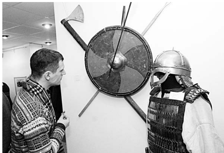
Хоть раз облачиться в рыцарские доспехи мечтает, пожалуй, каждый мужчина.