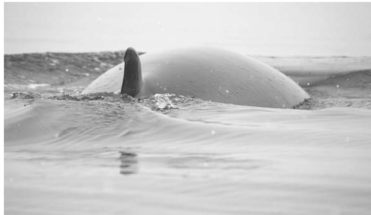
Минквал - один самых распространенных видов кита.

Зато несколько лет назад на причале у 206 завода довелось видеть сразу трех белух. В тот день отлично клевала селедка беломорка, как ее прозвали рыбаки (а по-моему, это обычная молодь сельди). Одна большая белуха появилась посреди залива напротив мыса Шавор и долго курсировала то в сторону Сафоново, то в сторону п.Ретинского и обратно. Позже к ней присоединились две белухи поменьше. Вместе они направились в сторону Мурманска и больше не появлялись. Когда они ныряли и всплывали вновь, казалось, будто это огромные ледяные глыбы прорезают толщу воды. Это взрослые особи белого окраса, а вот неполовозрелые белухи – серого или синеватого. Издали похожи на дельфинов, но отличаются тем, что у них нет спинного плавника. Зато, как и дельфины, они стаями перемещаются вдоль берега в поисках пищи. Иногда, выныривая из воды, белуха выбрасывает невысокий фонтан, издавая при этом своеобразный шипящий звук. Вероятно, отсюда и пошло выражение «реветь белугой», то есть белухой. Питается этот кит в основном крупной рыбой, летом нередко нападает на семгу и кумжу. Западнее мыса Святой Нос появляется только в холодное время года. В Белом море держится