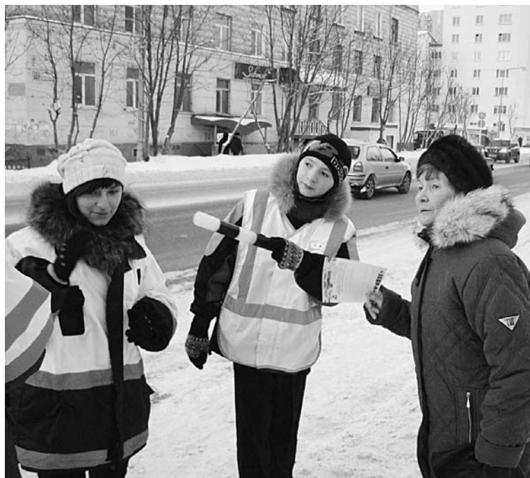
Юные инспекторы ДПС оказались не менее строгими, чем их взрослые коллеги.