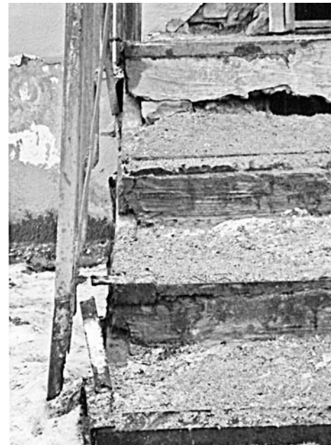
Те самые ступеньки - головная боль жителей подъезда.