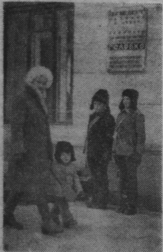
В почетном карауле.