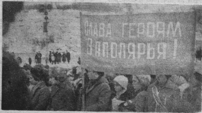
На торжественном митинге.

Затем командование флота, ветераны войны, представители партийных, советских и общественных организаций, воин гарнизона возложили венки к памятнику Владимиру Ильичу Ленину. Колонна направляется к Приморской площади. Засты-