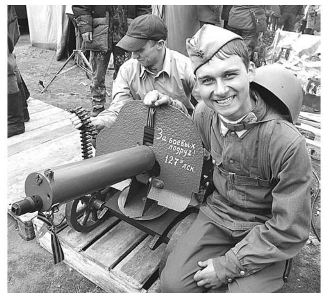
Участники праздника увидели настоящее оружие Великой Отечественной.