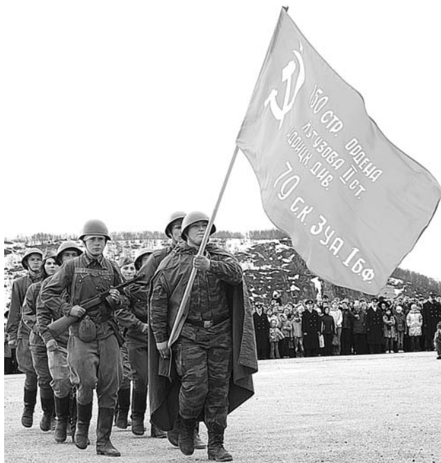
Так выглядели советские солдаты, защищавшие Заполярье.

День Победы праздновала масса северян. У мемориального комплекса в Долине Славы образовалось настоящее столпотворение. Вдоль обочин выстроились сотни машин. Около мемориала выросли целые городки из туристских и военных палаток.