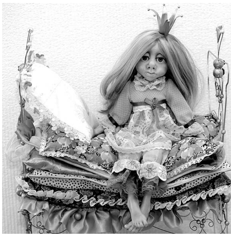
«Принцесса на горошине», Светлана Абарина.