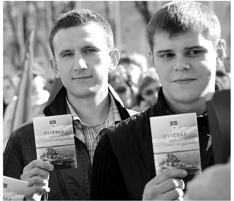
Путевка призывнику на БПК «Североморск»: случайность или начало карьеры...

В каждом городе на рынке труда складывается своя ситуация. Поэтому, прежде чем выбрать специальность, ознакомьтесь с данными по тому городу, в котором ваш ребенок планирует жить после окончания учебного заведения, а заодно и с общими данными по России. Если вы определились с отраслью или областью деятельности, полезно обратиться к справочникам учебных заведений. Ведь о существовании многих востребованных и хорошо оплачиваемых профессий мы даже не подозреваем.