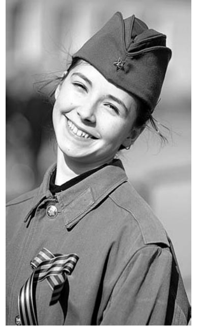
Георгиевская ленточка - символ, понятный всем поколениям.

приказом министра обороны в 22.00 по местному времени в городах-героях, а также в столицах военных округов и флотов в честь Дня Победы проводятся артиллерийские салюты. Однако горожане, пришедшие в назначенный час на Приморскую площадь, остались в замешательстве - кроме двух небольших залпов, отнюдь не увенчавшихся россыпью фейерверка, они ничего не увидели. А ведь заявлен был праздничный салют.