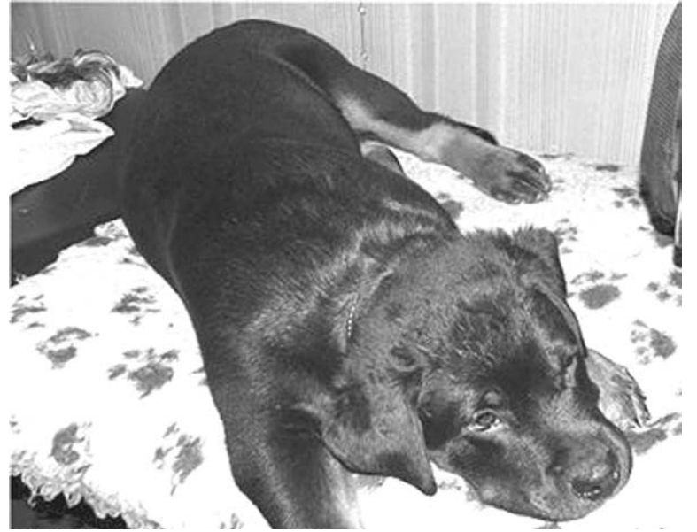
Эх, сейчас бы на прогулку!..

В прошлом году я впервые взяла с собой в отпуск любимого спаниеля. Изучив правила перевозки животных наземным и воздушным транспортом, решились добираться