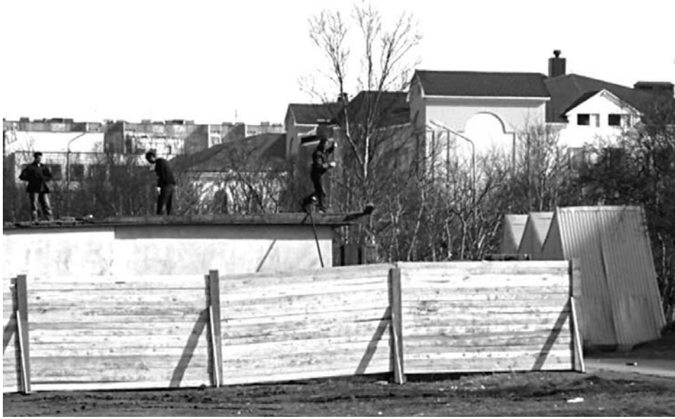
Один из вариантов проекта - объединить магазин с остановочным комплексом.