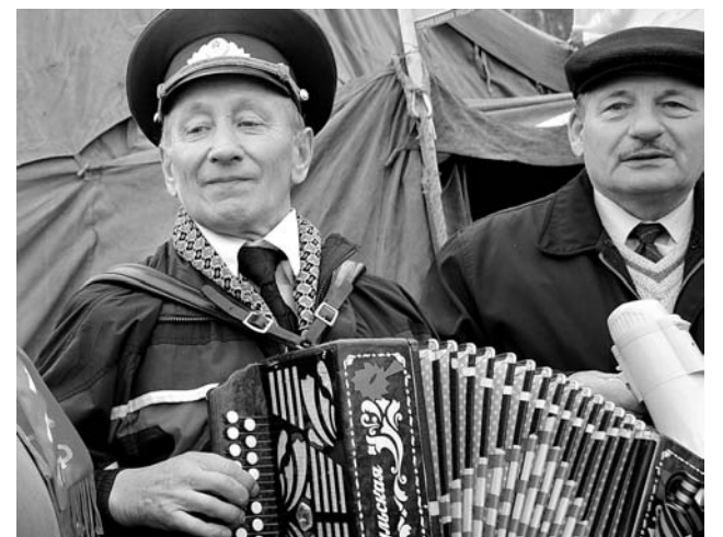
Встреча ветеранов не обходится без фронтовых песен.