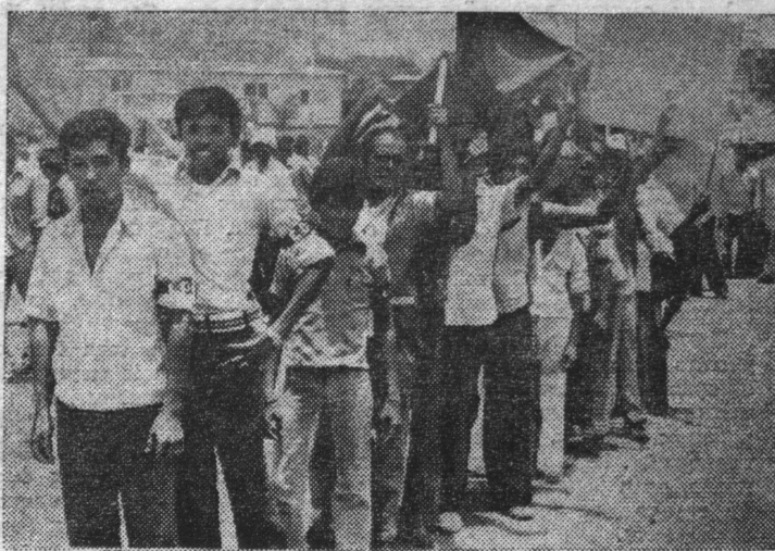
НИКАРАГУА. Праздничная демонстрация. Жители Манагуа выражают радость по поводу трудно доставшейся победы никарагуанского народа над диктатурой Сомосы.