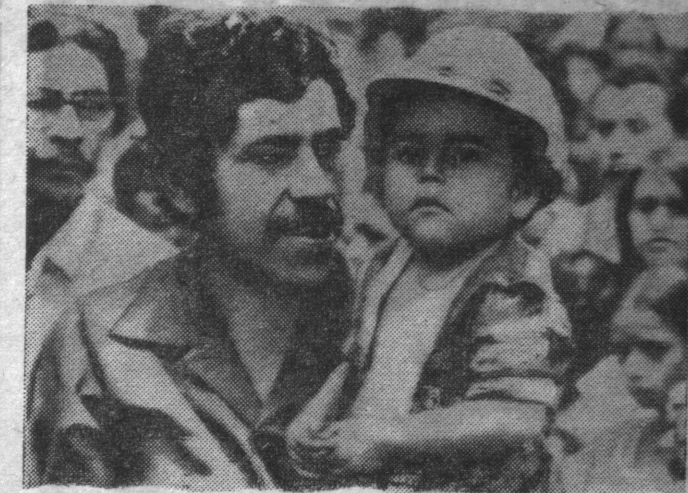
Никарагуа. Кончилась война. Возвращаются в родные места бойцы фронта национального освобождения им. Сандино. Радостно встречают их родные и близкие. На снимке: после долгой разлуки встретился с отцом этот никарагуанский мальчик.

Что же произошло? Сначала преступники похитили жену