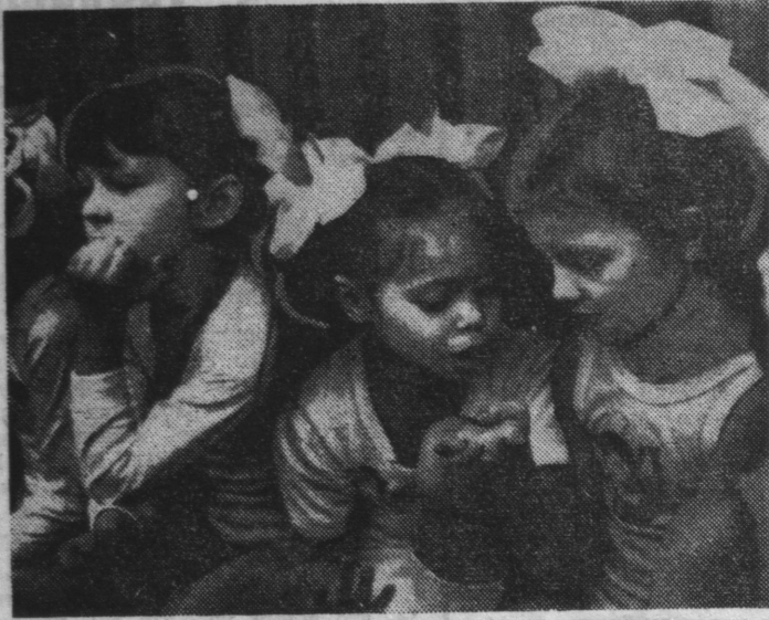
(Оконч. Начало на 3 стр.)

«Неужели проиграем?..»