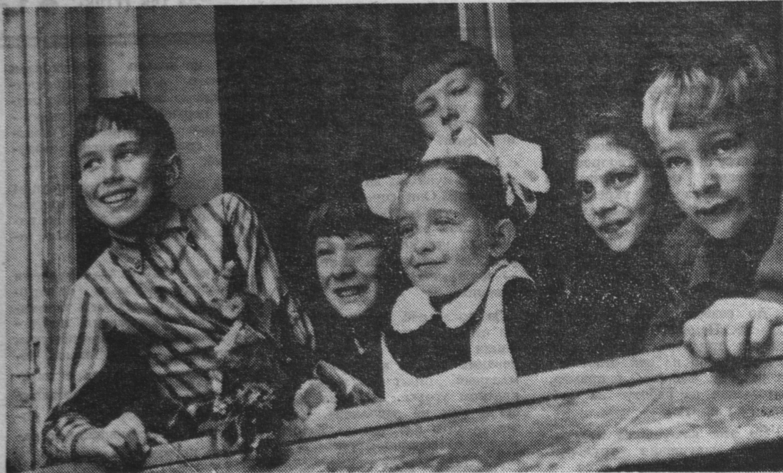
Первый школьный день.