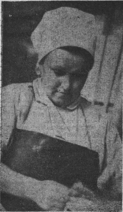
Правофланговые десятой пятилетки